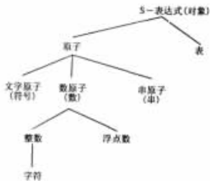
图 2.1 LISP 的基本数据类型

LISP 的基本数据类型及其相互关系如图 2.1 所示。另外还有一些其它的数据类型如数组(Array)、函数(function)、流(stream)等,遇到时再加以说明。