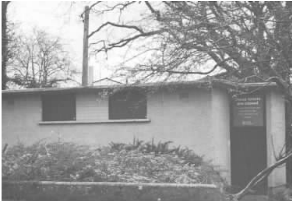
图 11-1 摇摇从月里看到 1980 年 12 月关闭的公交车终点站上被关闭的厕所。该厕所位于公交终点站。在月里城外地理位置方便（而且对公众开放）的厕所对于可能的公交乘客是必要的设施。该厕所在 1980 年底被拆除。

代城市设计和城镇规划政策不可或缺的重要组成部分。这是本书创作的前提。在一些建筑师看来，厕所设计如同服兵役时打扫厕所。公共厕所服务和公墓、菜地和垃圾处理厂的工作一样，不应被看成是一件低级的、令人讨厌的工作，也不应该仅由公共工程和管道界同仁承担。现有的厕所手册并不少，他们提供了厕所内部布局的细节和面积，包括管道装置和配件，但这些规范似乎与城市设计和政策部门分离开来，把厕所内部规范与周围环境、当地情况和现代使用者的需要割裂开来。