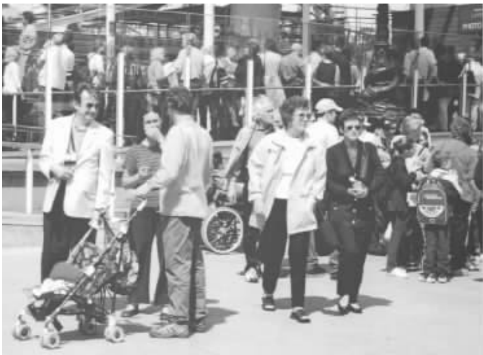
图 1-1 人们排队等候进入“伦敦眼”。数以百万计的游客到这里参观，他们当中有老人有小孩，有健全人有残疾人，有男有女，都可能上厕所。最近的厕所要下一段台阶，这样许多人就不能顷刻间到达那里