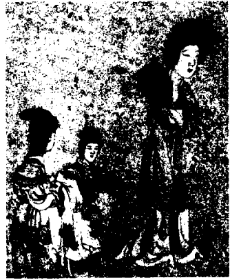
图 1 - 35