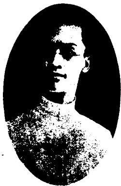
图 1 - 39

清末，大批青年出国留学，受到外国进步思想的影响，掀起剪辫、易服的风潮，还有一部分人对清王朝的统治强烈不满，所以在推翻清朝政府后，纷纷剪掉辫子，留成短发式样，有平顶式（图1-39），圆顶式，分头式（图1-40）。自光绪末年至民国初年，曾经时尚的妇女发式有：螺髻、包髻、连环髻、朝天髻、元宝髻、空心髻、盘辫髻、面包髻、一字髻、东洋髻、舞凤髻、蝴蝶髻等。年龄较轻的除了梳髻外，还留一绺头发盖在额上，俗称“刘海”，样式有最早流行的“一字式”，长达二寸，一般盖在眉间；继而流行“垂丝式”，将前发剪成圆角，梳成垂丝状（图1-41）；以后又将额发分成两绺，剪成尖角，形如燕尾，时称“燕尾式”，如传世图照（图1-42）；到民国初年，风行一种极短的刘海，远远看去若有若无，名叫“满天星”，如传世图照（图1-43）。烫发大约在20世纪30年代传到中国。曙光著《女人截发考》中记载，在1933年以前就已经有烫发了