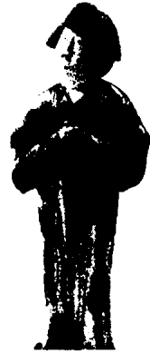
图 1 - 19