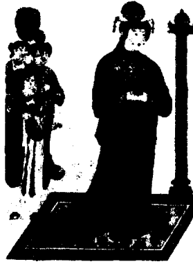
图 1 - 18