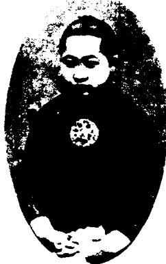
图 1 - 43