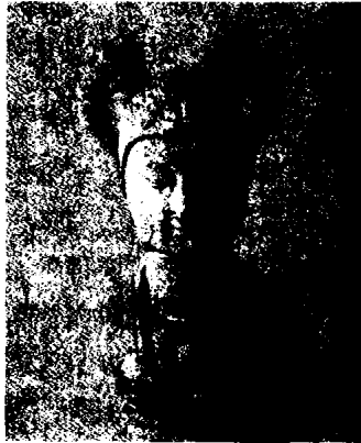
图 1 - 21