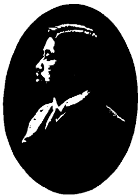
图 1 - 40