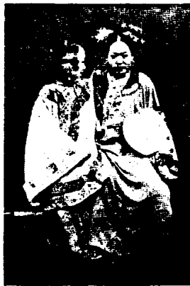
图 1 - 37