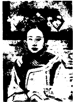
图 1 - 38