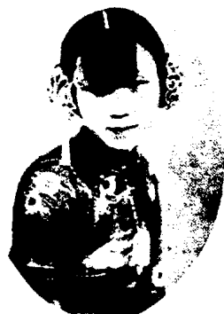
图 1 - 41