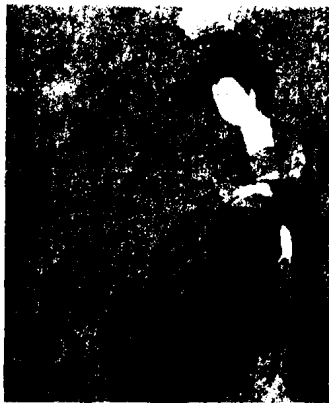
图 1 - 20