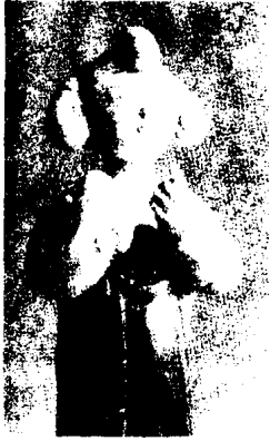
图 1 - 17