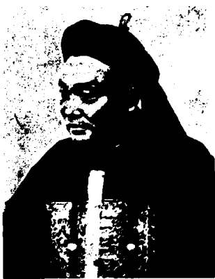
图 1 - 36

清朝从入关的第一个皇帝顺治起，就强令全国都按满族传统穿着打扮。男人们一律剃去四周的头发，留后发编为辫子（图 1 - 36）；由于人们无法自己剃发，于是以剃发、刮脸为业的人日益增多，最初是挑担流动服务，逐渐发展成有固定的门面，雇用一些专业剃发人员。从事男子剃发、刮脸和从事女子梳理、整容为业的两部分人员结合，理发行业就正式形成了。当时妇女的发式，分为满汉二式。《阅世编》记汉族女髻：“崇祯之间，始为松鬟扁髻，发际高卷，虚朗可数，临风栩栩，以为雅丽顺治初，见满装妇女辫发，于额前中分，向后缠头，如汉装抱头之制，而加饰于上。京师效之，外省则未也。”清朝中叶，汉族妇女模仿满族宫女发式，以高髻为尚，把头发平分两把，俗称“两把头”或“叉子头”，又在额头垂下一缕头发，剪成两个尖角，名谓“燕尾”。以后又流行“平髻”，北方人称“平三套”又称“苏州撅”（图 1 - 37）。“圆头”：即圆髻或盘头髻，有如意缕、盘心髻、散心髻等。康乾以后，受汉族的如意缕的影响，把发髻梳成一字形，俗称“一字头”。后越来越高，变成“高如牌楼”的固定装饰，用时套在头上，再插上一些花朵，即成“大拉翅”，直到清末仍为满族妇女的主要发式（图 1 - 38）。