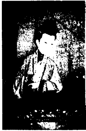
图 1 - 34