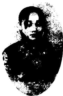
图 1 - 42