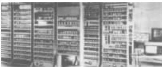
摇摇第一台存储程序的计算机“爱达赛克”

有人做过试验，在“埃尼亚克”上计算一个级数的前七项，手工准备工作至少需要 15 分钟，而机器计算只需 1 秒钟。这里，人工干预与计算机计算所