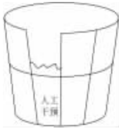
摇摇只能装半桶水的木桶

的“埃德瓦克”要比“埃尼亚克”快四倍;国际商用机器(IBM)公司在1954年推出的IBM 701源计算机,平均每秒执行浮点运算一万次;菲尔克公司在1956年制成的第一台大型通用晶体管计算机的运算速度达到每秒几十万次。为了提高计算机速度,科学家、工程师和技术人员耗费了多少心血!但是,在计算机速度上好不容易取得的成果,在实际算题中却打了很大的折扣,不少情况下几乎无法体现出来。因为在这些计算机上,仍然需要大量的人工干预,而人工干预的速度难以提高,经常出现操作人员手忙脚乱而计算机却空闲等待的极不相称的情形。这种人工干预的慢速度与计算机运行的高速度之间的严重不协调,常被简称为人机矛盾。随着计算机速度的迅速提高,人工干预与计算机计算所花时间之比也迅速增大,人机矛盾日益尖锐化。