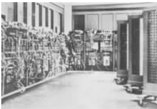
“埃尼亚克”的一部分

“埃尼亚克”(ENIAC, 电子数字积分自动计算机)在美国的宾夕法尼亚大学正式投入运行。“埃尼亚克”是个庞然大物,它占地约1500平方米,高达2.7米,重有30吨。“埃尼亚克”的运算速度达每秒5000次,这在当时真是激动人心的高速度。“埃尼亚克”除