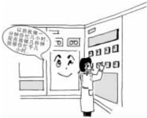
人机矛盾日趋尖锐化摇摇摇