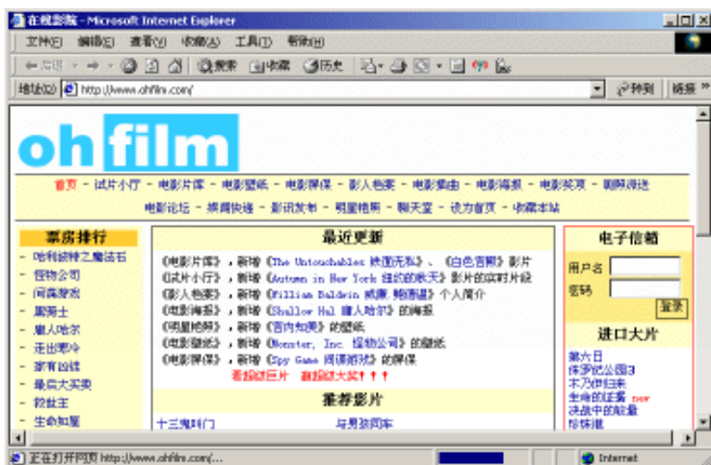
图 1-2 一个典型的宽带万维网站

传送。万维网有一个简单而吸引人的图形用户界面，并且只需要使用一个鼠标和不多的文字录入。图 1-2 所示的是一个典型的宽带万维网站。