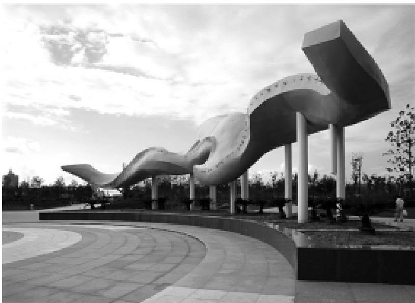
图 1-6 雕塑给人一种悠远凝重的美感