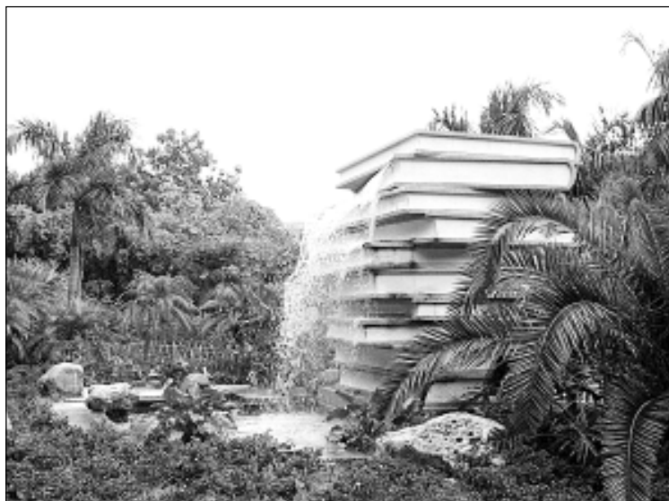
图1-5 “书本”构筑的落水塑造了一种充满书香气息的宁静氛围

优秀的景观设计对于生活在其中的人们起着陶冶情操、净化心灵的作用,也为人与人之间的交流提供了丰富多样的场所。景观空间组织体现了一个地区的文化渊源和人文精神,能够满足人的精神需求(图1-6)。