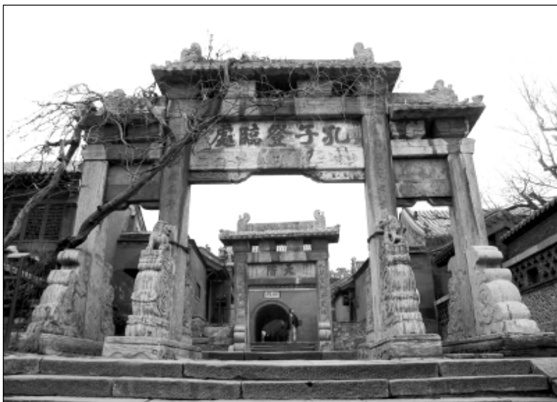
图 1-1 泰山孔子登临处

复合景观是自然景观与人造景观经过有机融合,组成浑然一体的新景观。复合景观中的人造景观除了以具体的形式与自然景观相融合以外,还