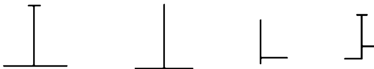
图 1-1-1 铝合金吊顶龙骨及零配件示意

铝合金吊顶龙骨一般常用的多为 T 型,根据其罩面板安装方式的不同,分龙骨底面外露和不外露两种。T 型铝合金吊顶龙骨属于罩面板安装后龙骨底面外露的一种。其龙骨及零配件如图 1-1-1 所示。