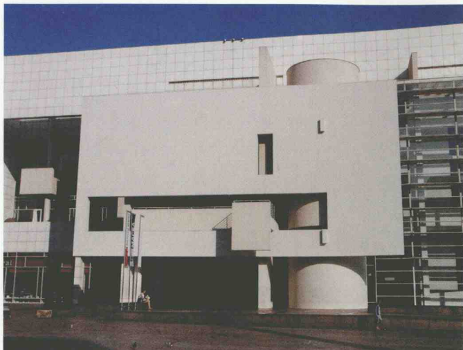
图1-2 典型的迈耶风格 (西班牙巴塞罗那现代艺术博物馆)

从图1-2、图1-4、图1-6与图1-3、图1-5、图1-7的对比我们就可以简单地看出现代建筑设计的趋势，虽然相对传统的