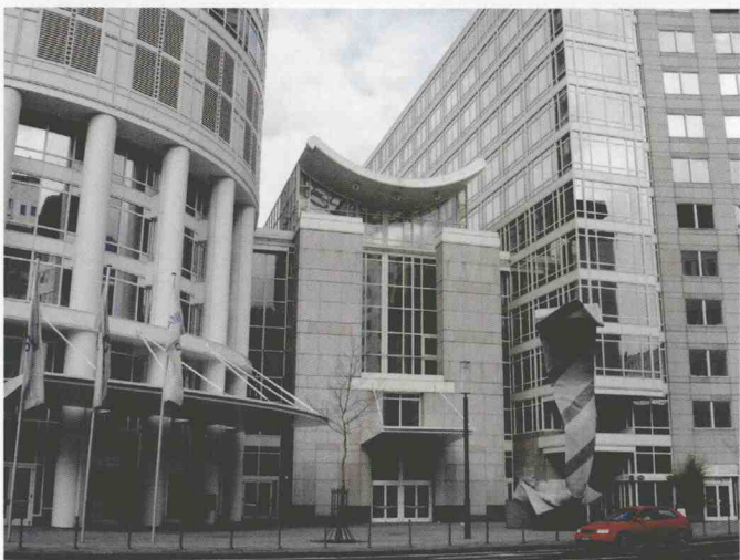
图1-6 典型的KPF风格 (德国法兰克福DG银行)