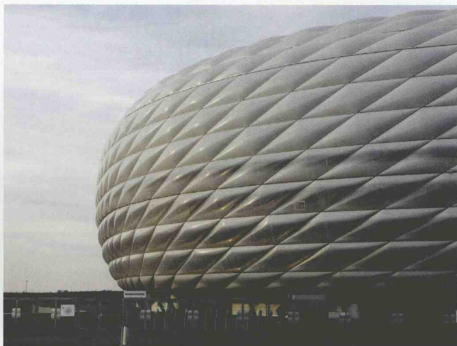
图1-5 德国慕尼黑黑安联足球场