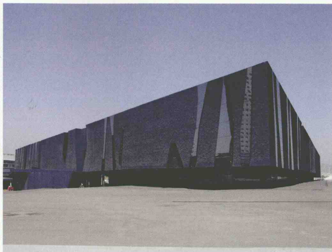
图1-3 西班牙巴塞罗那2004论坛建筑