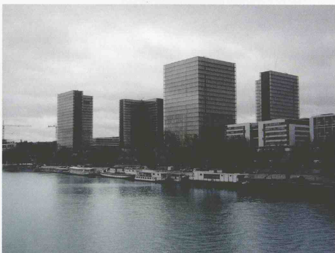
图1-7 法国国家图书馆