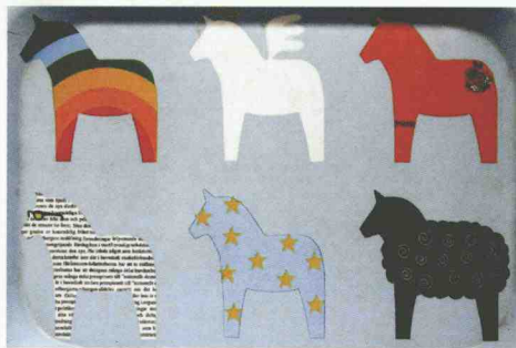
图1-8 宜家 (IKEA) 马年销售的餐盘, 基本同样的外形, 不同的图案形式。