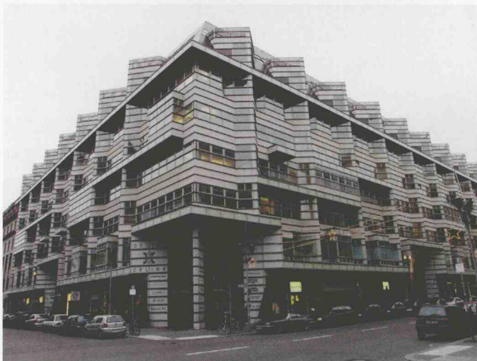
图1-4 典型的贝聿铭事务所风格 (德国柏林某建筑)