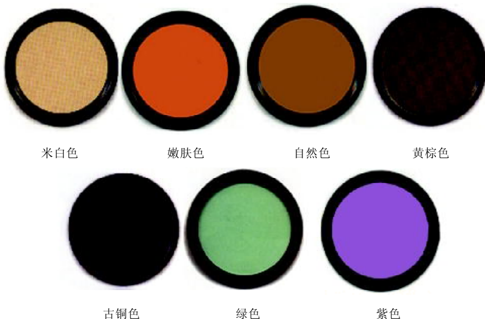
图1.6 不同粉底的使用