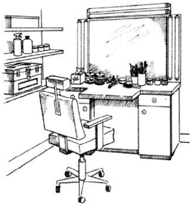
图1.1 基本的化妆场所