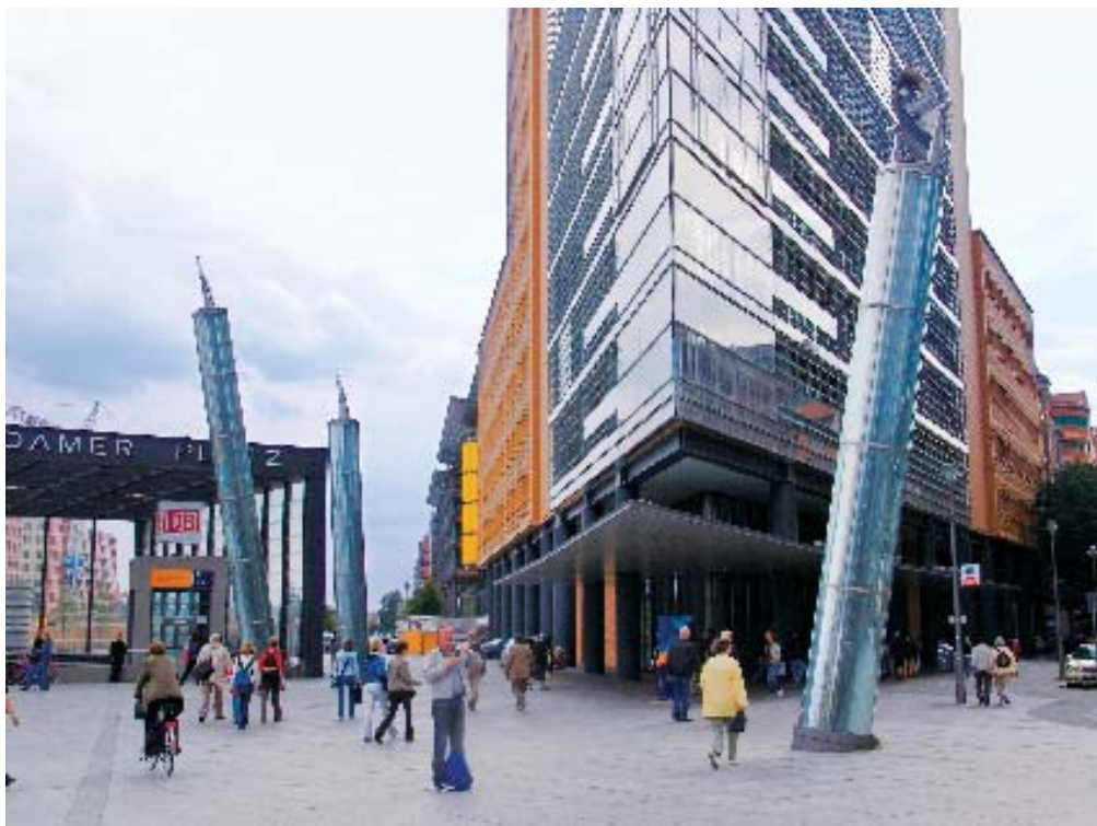
柏林波斯坦中心的城市场景

面对这些问题，可以想见，我国的“公共艺术”必将经历一系列创造性革命，新时期城市环境需求将带来全新的城市文化需求，城市自身开始将艺术和美作为目标。艺术营造