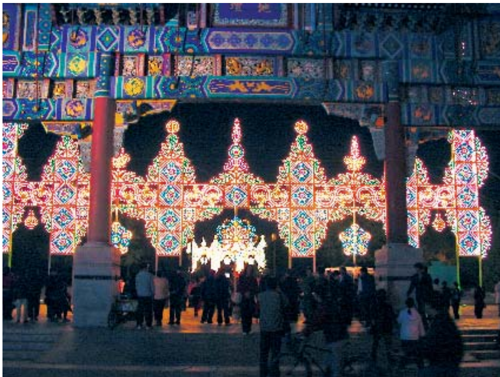
2000年春节北京地坛庙会上意大利艺术家的光雕作品成为节日文化的一部分

城市公共艺术建设的最终目的是为了满足城市人群的行为需求,给人们心目中留下一个城市文化的意象。依靠公共艺术可以使城市成为更加多元、立体、个性化和艺术化的综合构成体。