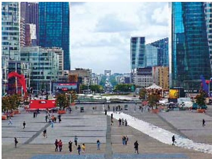
巴黎拉德芳斯新区坐落在凯旋门星形广场的轴线延长线上，连接着城市的历史与未来。

如果说工业化建设的核心目标是“经济”的话，未来建设的核心目标就可以说是“文化”。那么未来的城市文化将如何体现呢？在物质文明高度发达的今天，艺术与人们的生活越来越密切，艺术已全面进入日常社会