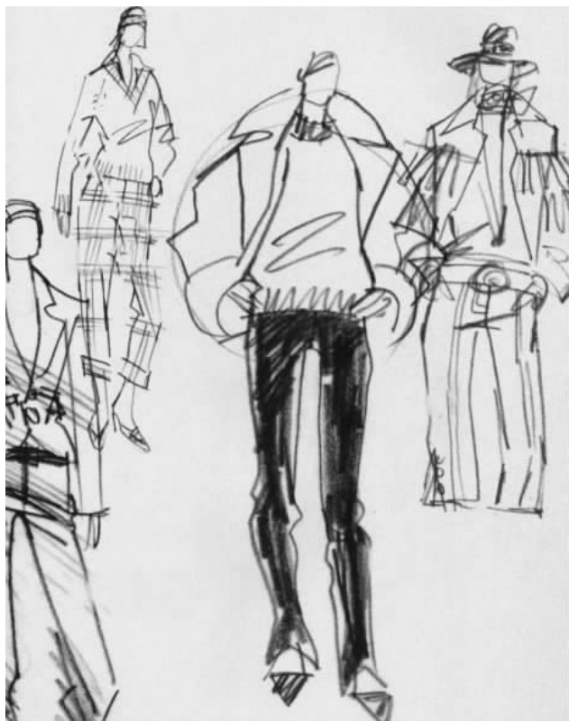
图 1-1 设计草图

①设计草图：任何设计作品的诞生都是由人的最初设计意图转变而来的，设计师表达这个意图的工具就是以飞快的速度，抓住瞬间灵感的设计草图(图 1-1)。他们通常选择速写的形式，只用寥寥数笔就把设计的原始想法表现了出来。