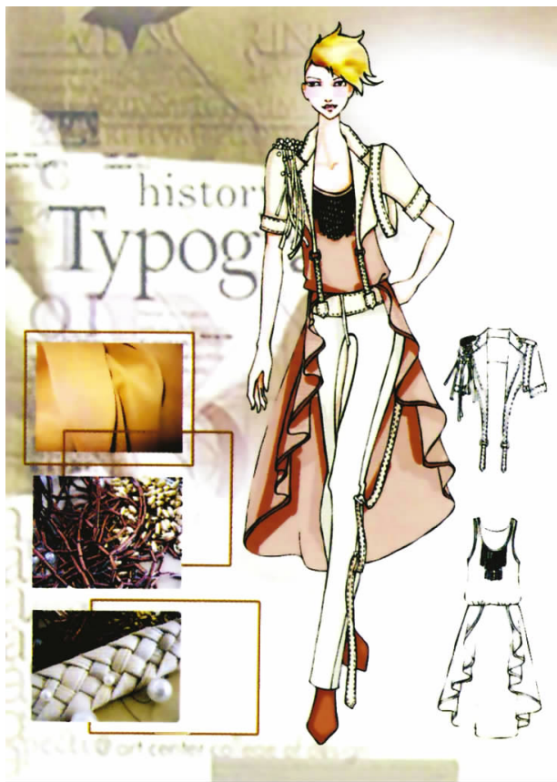
图 员原圆 设计效果图

②服装效果图:服装效果图是对设计草图的明确化和具体化(图 1-2)。用于产品设计的服装效果图有别于时装画,它不必像时装画那样对人体进行过分的夸张和变形,采用正常人体比例或者 8 头高的人体比例已足够。它不仅要通过色、形、质的表达来体现设计师的设计意图,还要通过对附件、结构、细节的明确表达和某些局部设计的深入细化等起到指导实物制作的效果。