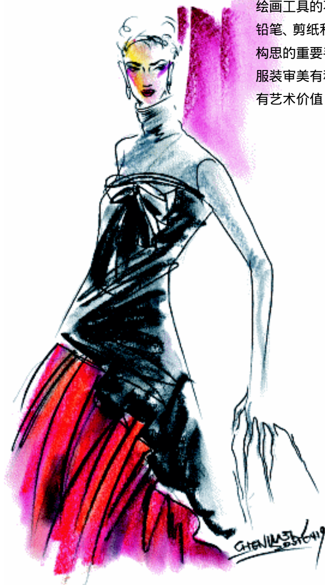
图1-1 既有艺术价值,又有实用功能的时装画

时装画是将服装设计构思以写实或夸张的手法表达出来的一种绘画形式。线条、造型、色彩、光线和面料肌理是时装画的基本要素。其种类因消费目标和绘画工具的不同而千变万化,有水彩、水粉、钢笔、铅笔、剪纸和计算机绘制等。时装画是表达服装设计构思的重要手段,是传递时尚信息的一种媒介,其对服装审美有积极的推动作用。在当今社会,时装画既有艺术价值,又有实用价值。