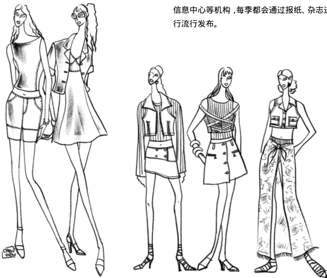
图1-2 时装画在商业运行中有传媒作用

流行时装画(popular fashion illustration)常见于时装拓展机构的流行发布读物中,它并不是可以直接用于服装生产的时装画,而是按一定的流行趋势,浓缩了时尚概念所具有的指导意义的时装画。一般在每季到来之前半年的时间,由一些权威性机构或组织根据时装发展的趋势策划出来的流行发布。每季的流行时装画都会推出不同的主题,并反映在色彩、款式、面料这三大要素上,将流行时尚的信息与概念用夸张的手法表现出来。如国际羊毛局、中国服装设计师协会、香港贸易发展局、中国纺织信息中心等机构,每季都会通过报纸、杂志进行流行发布。