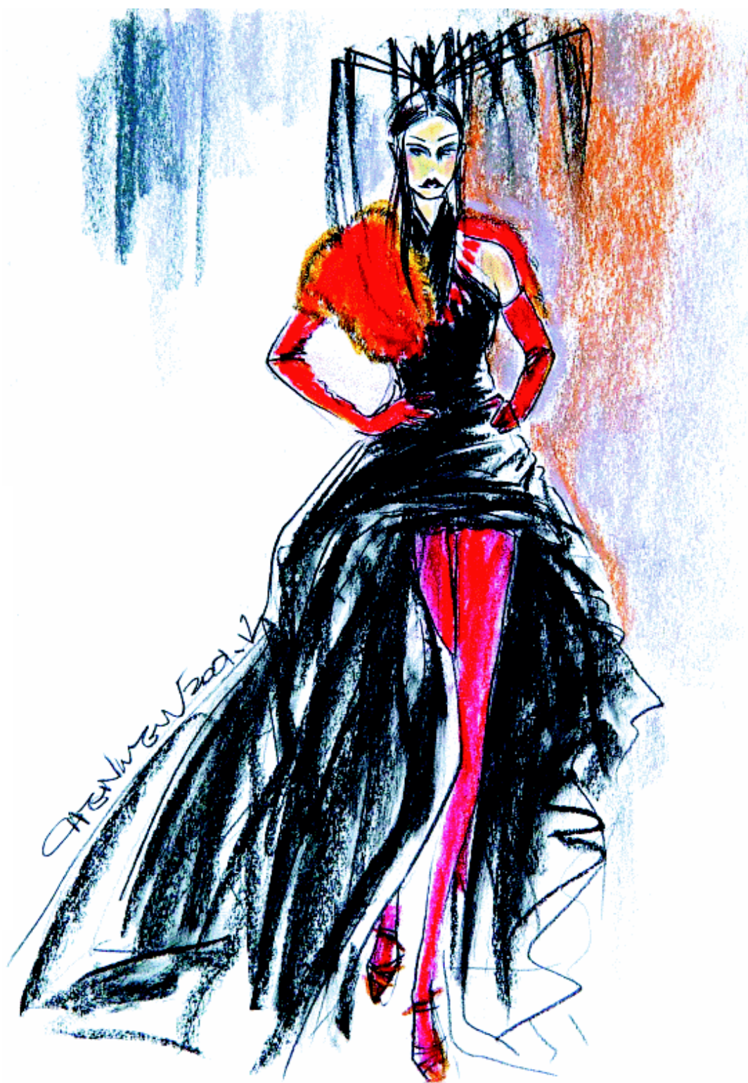
图1-5 设计师中也有时装画家