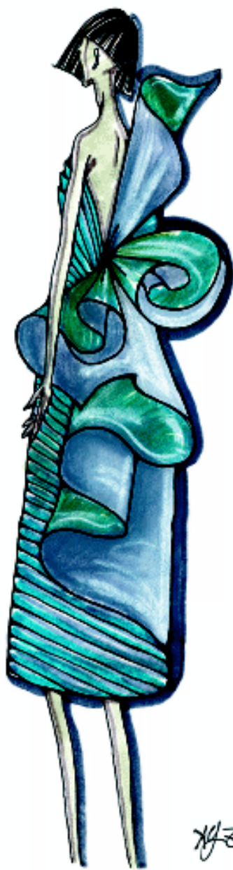
图1-4 时装画将时尚的元素艺术性地传达给读者或消费者

时装效果图是服装设计的第一步。良好的时装设计效果图是准确有效地进行打板和制作的关键。它将设计师的构思完整、形象地展示出来,在服装与人体的关系上给人以直观的效果,是设计语言的形象化表达。国内外的服装设计比赛通常要求参赛的服装设计师先通过画出时装画,表达出设计理念和构思,经筛选入围后,再做成样衣。设计师作品入围与否,在很大程度上就取决于其时装画表达的优劣。时装画家萧本龙曾说:“学画时装画不仅能学到一种本领,更能在学习过程中使审美能力提高。”设计师不仅在工作中需要不断记录形象资料,勾画造图,同时在这些不经意的笔触中领悟到一种审美情趣,也是服装设计的组成部分,一种表现方法。