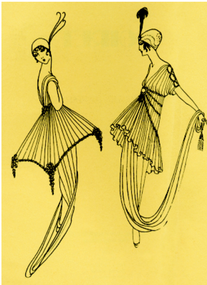
图2-1 20世纪初保罗·伊瑞布(Paul Irible) 纯线条形式的时装版画

时装画起源于版画。16世纪的欧洲在制作艺术和创造上是一个繁荣时期。当时的学术气氛浓厚以及