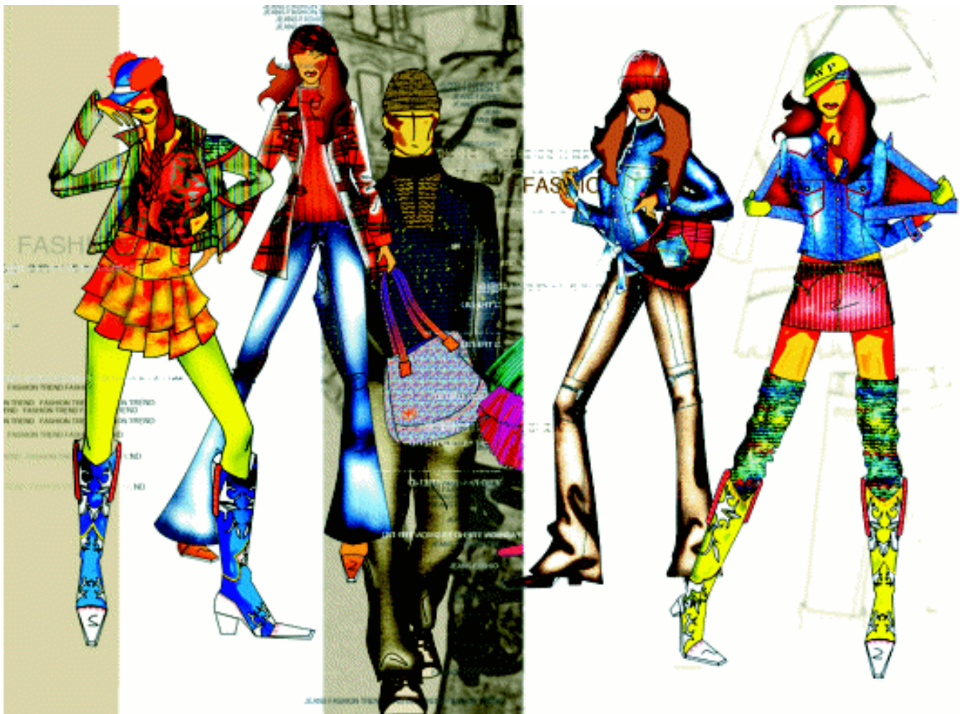
图1-3 传递最新资讯的流行趋势插画

时装插画(fashion illustration) 是一种根据文章内容或编辑风格的需要、用于活跃版面视觉效果时装画插图形式。它可以不具体表现时装款式、色彩、面料的细节,只希望画面能吸引读者,多配在时装报纸或杂志中,也常用于时装海报、POP广告、产品样本中。时装插画以简洁夸张的形式、富有魅力的形象引人注目,以达到加强视觉印象的目的。