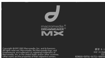
图 1-2 Dreamweaver MX 中文版的启动画面