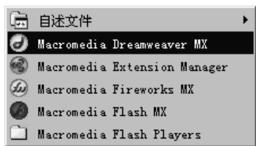
图 1-1 Dreamweaver MX 中文版的启动选择