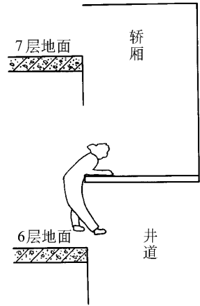
图 8-2 乘客坠入井道示意图

5. 管理不善是造成女司机坠落死亡的间接责任。一是没有按照国家的有关电梯安全标准对电梯缺陷进行及时地改进；二是对操作者没有按有关安全操作规程去要求、监督和管