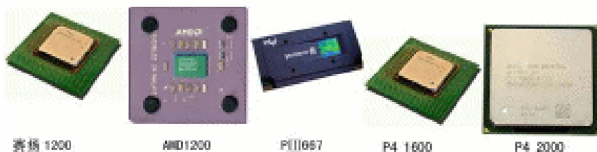
图 1-2 常见 CPU

CPU 又叫中央处理器，是计算机的主要运算、控制器件。386、486、586 就是以 CPU 的型号来命名的，现在常说的 P 800MHz、赛扬 1GHz 的计算机，其中的 800MHz、1GHz 表示的就是 CPU 的频率，常见的 CPU 如图 1-2 所示。