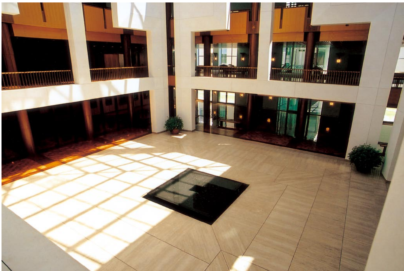
上图为采光井空间底层的空间环境，洒下的日光如同时钟，地面中间的黑色方锥体就像时钟不变的刻度，时空在这里得到最好的诠释。下图为国会大厦中心集散大厅空间环境，中间部分就是采光井空间