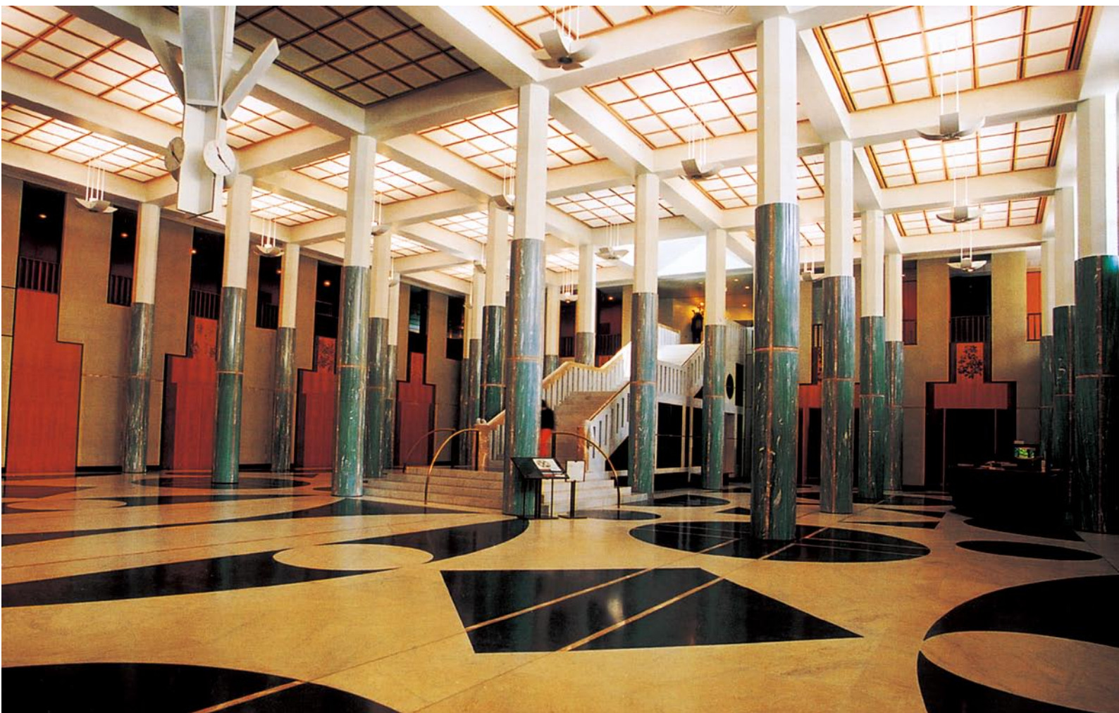
从厦门厅一角看到的室内空间环境效果

然而，正是这种“只要我们确定一种势，我们便是在描述一种‘稳定曲界’，在其中，设计只属于一种静态观念。空间似乎只是封装在房间里的呆滞实体，几乎是完全静止的”的静态空间观念，与现代科学对世界新的认识和新时代的设计观格格不入。从爱因斯坦的相对论到毕加索立体主义绘画，都表达出对运动性的认识，一个动态时间化的概念正在改变人们以往对空间的认识。三度的建筑空间必须加上时间要素而成为四度空间的时空环境，而传统理念中的空间正在成为一种束缚，必须去创造新型的、充满创意的、运动的空间。由此我们应该受到这样的启发：空间和时空的概念不会一成不变，随着人类对世界认识的不断深入，未来空间的要素和层次还会变化，由四度提升到五度或六度。