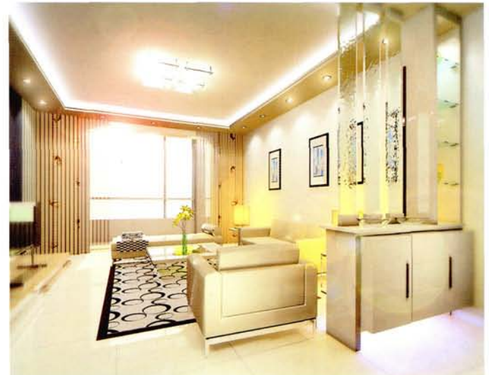
设计：北京龙发装饰集团沈阳公司