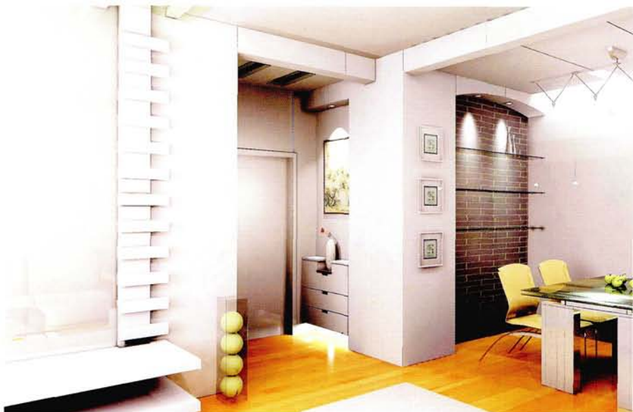
设计：北京龙发装饰集团沈阳公司