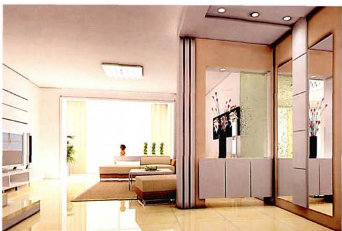
设计: 刘 健