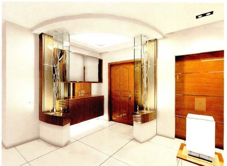
设计：北京龙发装饰集团沈阳公司