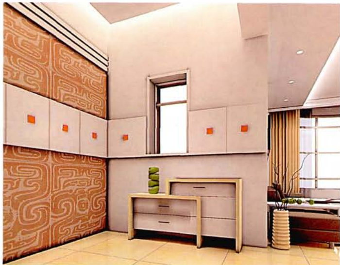
设计: 于 军