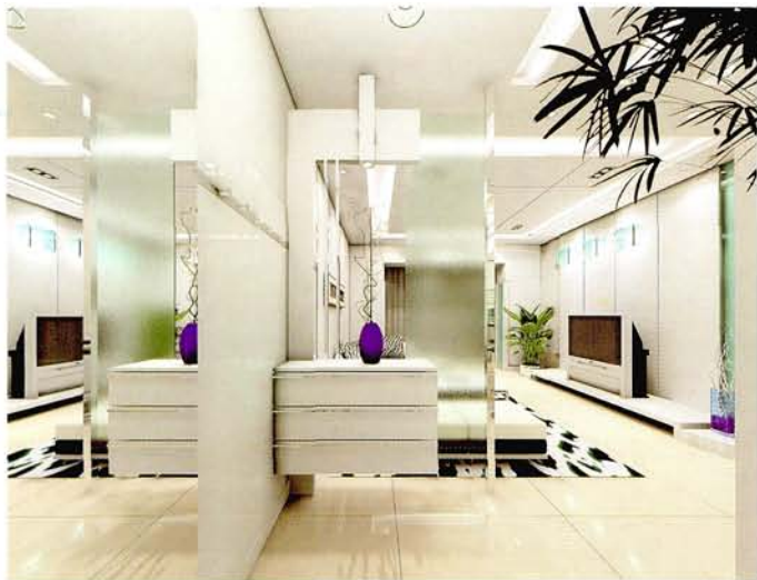
设计：北京龙发装饰集团沈阳公司