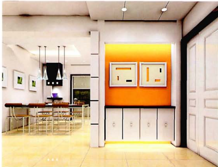
设计: 于 军