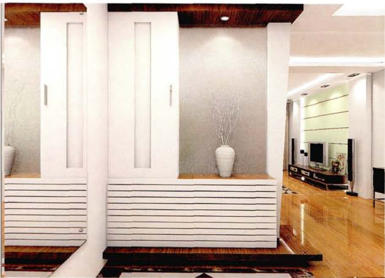
设计：北京龙发装饰集团沈阳公司