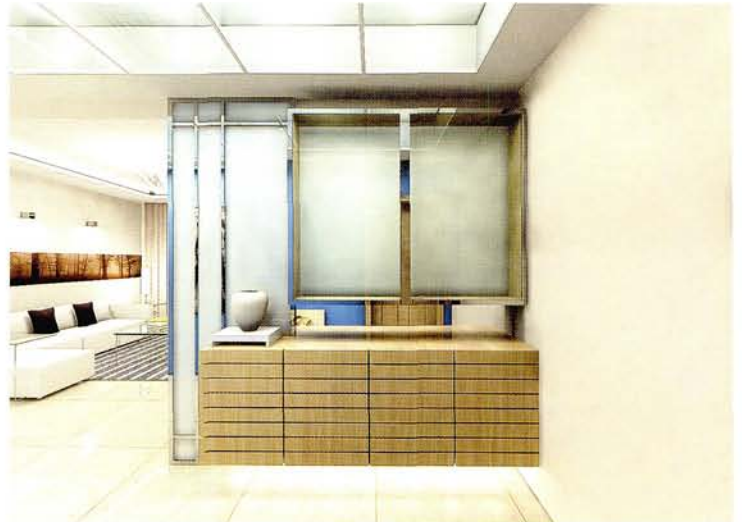
设计：北京龙发装饰集团沈阳公司