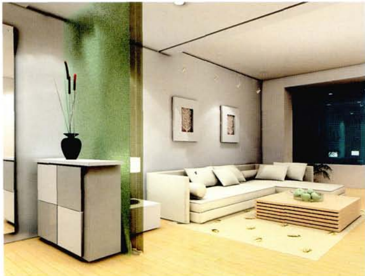
设计：北京龙发装饰集团沈阳公司