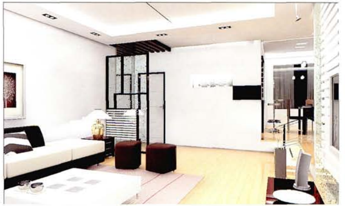
设计：北京龙发装饰集团沈阳公司