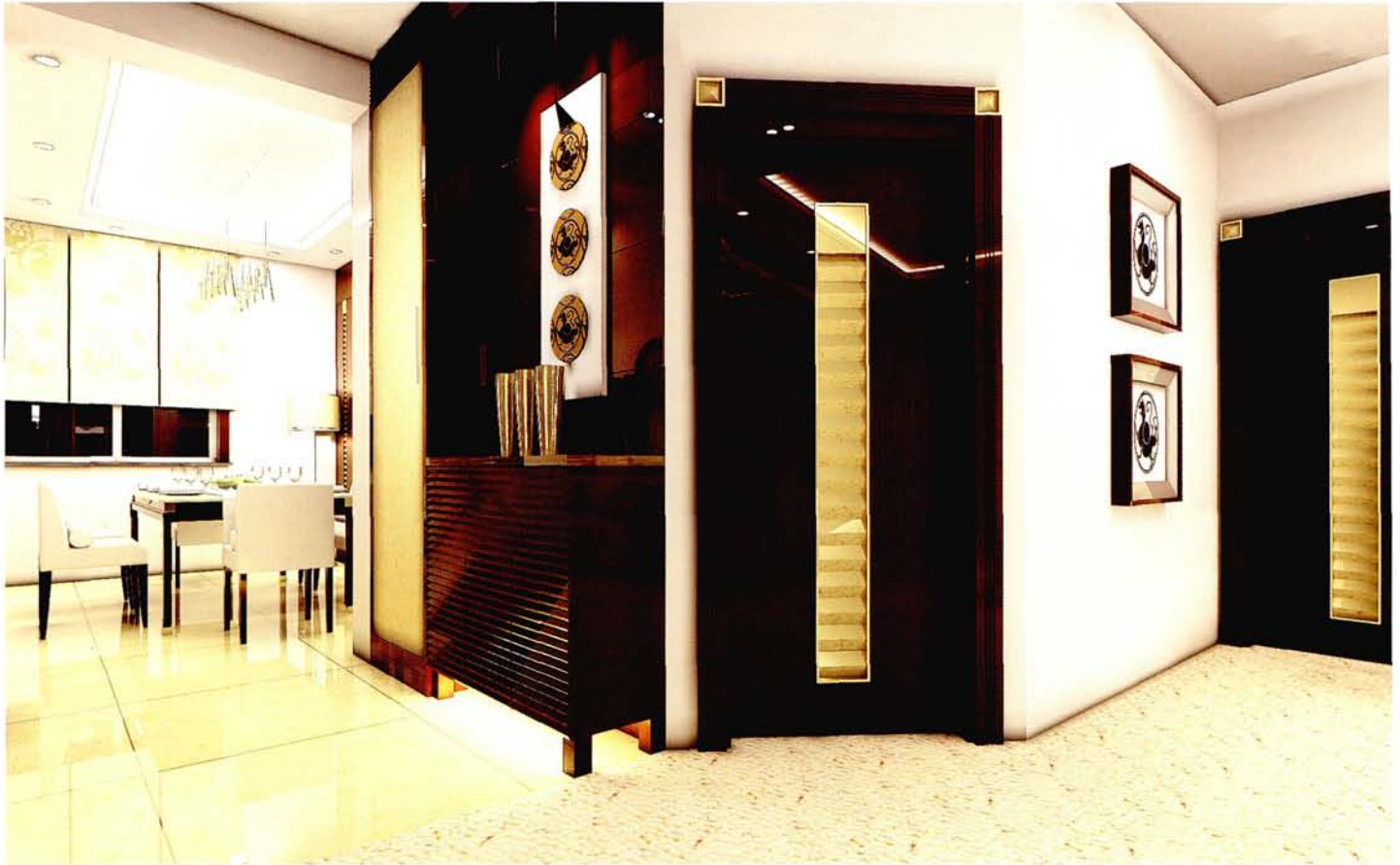
设计：北京龙发装饰集团沈阳公司