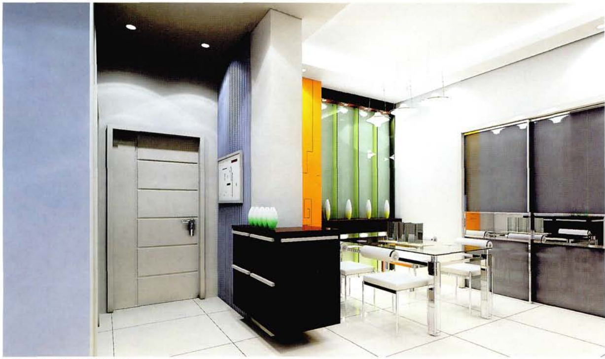
设计：北京龙发装饰集团沈阳公司