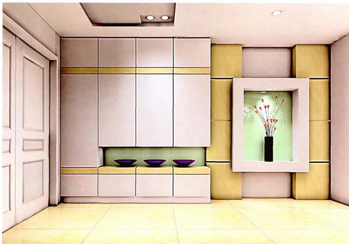
设计: 韩 巍