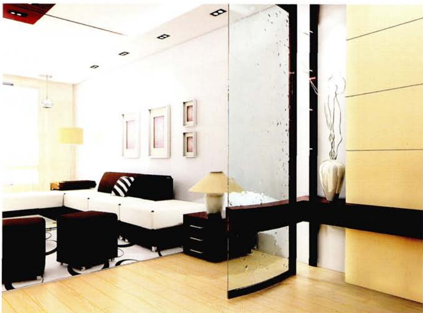
设计：北京龙发装饰集团沈阳公司