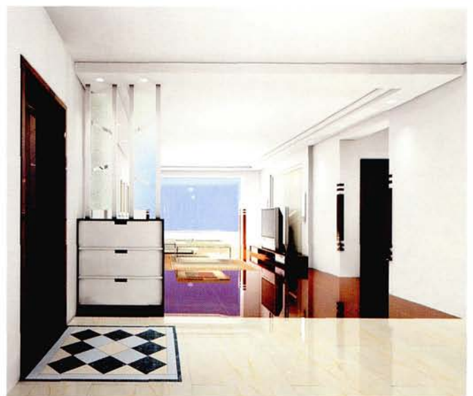
设计：北京龙发装饰集团沈阳公司