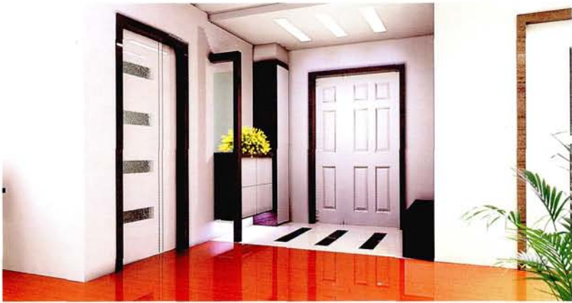
设计: 北京龙发装饰集团沈阳公司