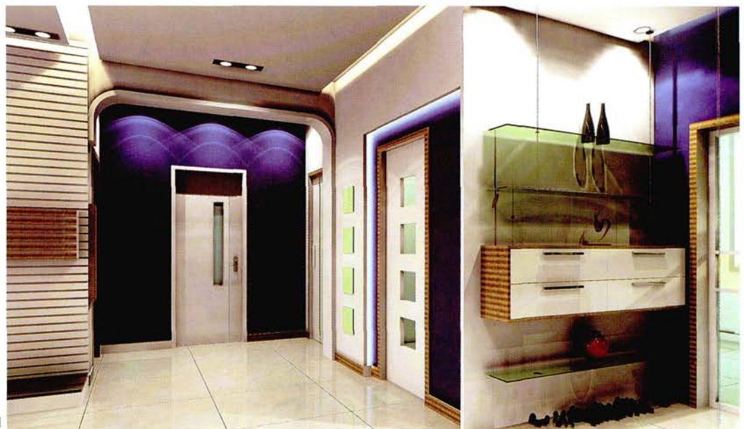
设计：北京龙发装饰集团沈阳公司