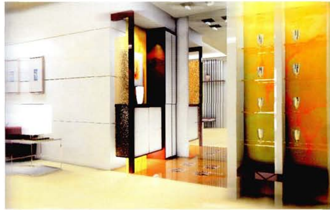
设计: 北京龙发装饰集团沈阳公司