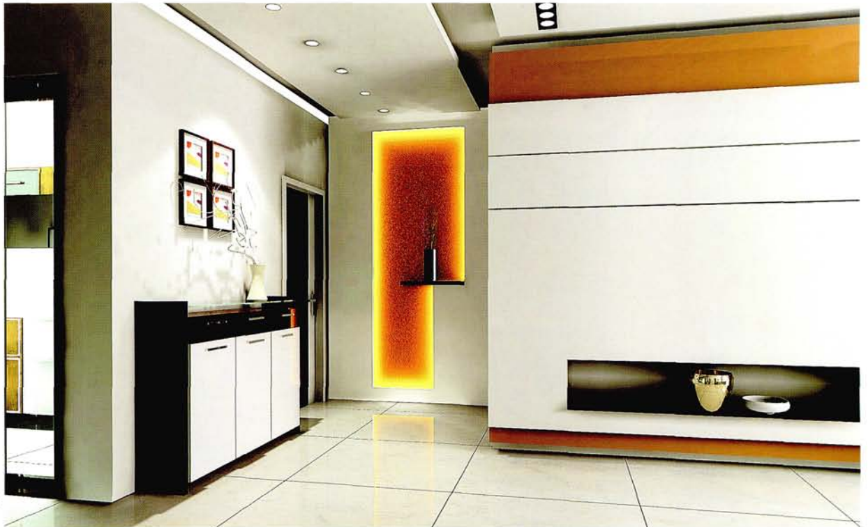
设计: 北京龙发装饰集团 沈阳公司