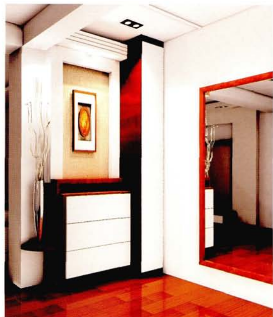
设计：北京龙发装饰集团沈阳公司