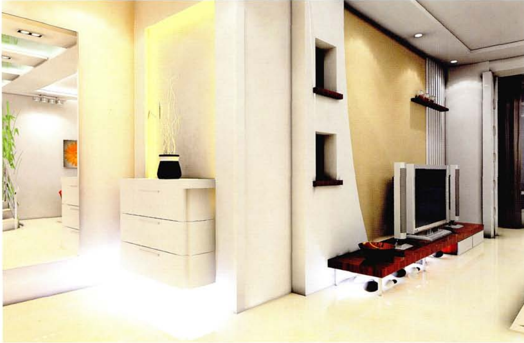
设计: 北京龙发装饰集团沈阳公司