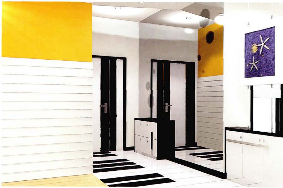
设计：北京龙发装饰集团 沈阳公司