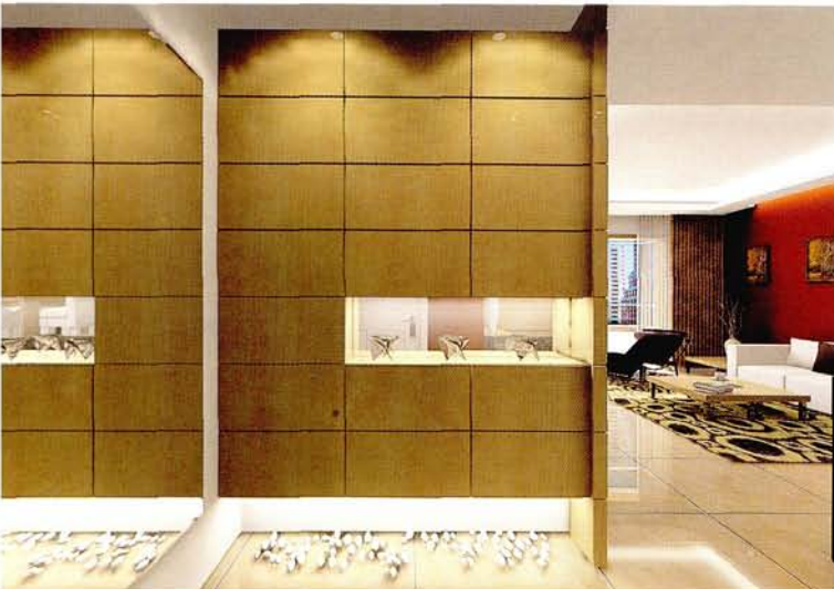
设计：北京龙发装饰集团沈阳公司