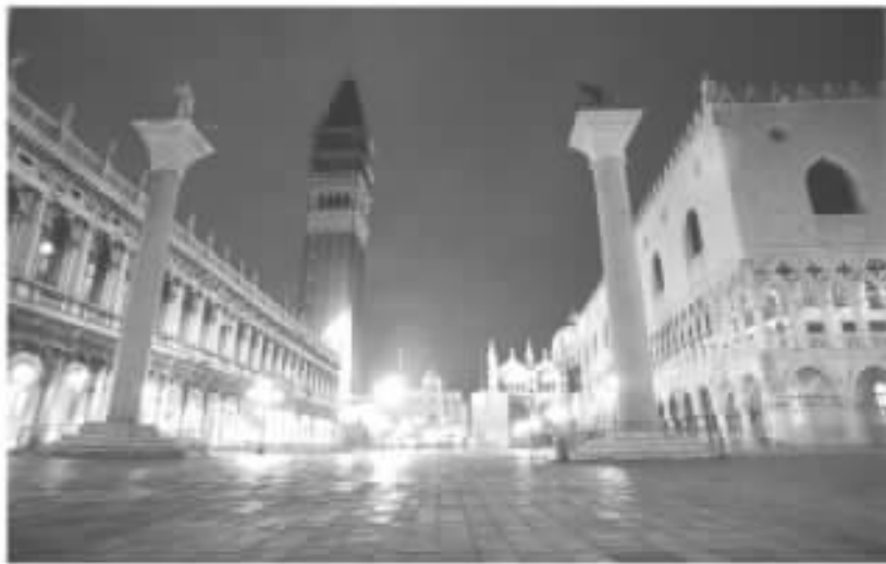
图 威尼斯圣马可广场

历史表明,许多有魅力的城市,不仅因为它们拥有许多优美的建筑,还因为它们拥有许多吸引人的外部空间。 ① 例如,意大利历史名城威尼斯、佛罗伦萨,小城锡耶纳,法国的巴黎;中国的北京、水城苏州、云南丽江古城。公共活动空间,在现代的城市环境、生活中也起着极其重要的作用。它为城市健康生活提供了不同于户内私密空间的开放的空间环境,同时,它也是创造宜人都市环境、体现城市风貌的重要场所,是“城市的橱窗”。(参见图 图)