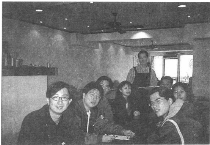
图 1-1 菜单是餐厅介绍自身产品的最佳代言人