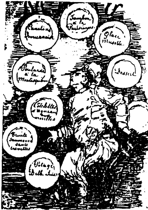
图 1-2 法国印象派大师雷诺阿画的插画

此画是由法国名印象大师雷诺阿（Renoir）为 Parisian 餐厅画的插画，藉以换取免费的餐饮。此画的内容描述一位厨师忙于穿梭在一日的菜单中。资料来源：高秋英，《餐饮服务》 p.73.