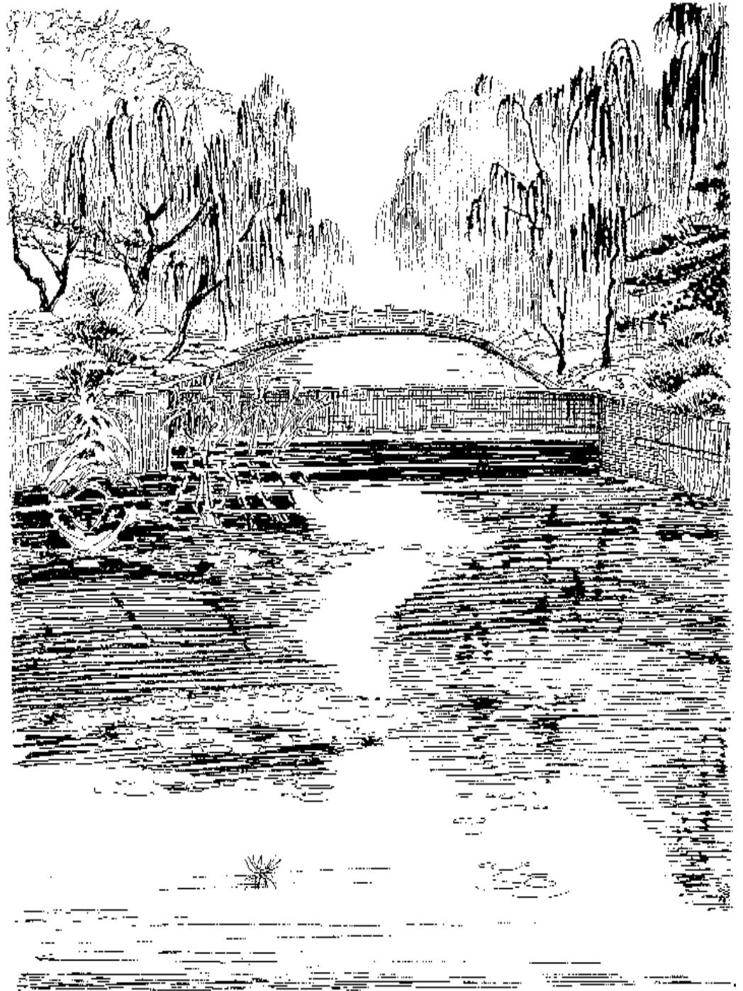
秀色满园——菖蒲河绿地

交通四个功能，并使其协调发展。随着社会的发展，国际上城市规划者认为今天的城市仍然应满足这四种功能。并且提出现代城市应该提供“有足够标准的绿地”，“在规模位置和质量上都属高标准的文娱和教育设施”。 (4)