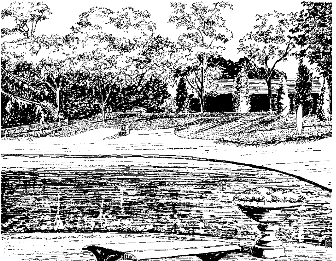
回清倒影——南馆公园一角

有些公园绿地为了近期的景观效果，把乔灌木种植得很密。这是个实际问题，北京在20世纪50年代末60年代初曾搞过“密植”，也称合理密植。在英国18世纪中期正是布朗式造园的全盛时期，也曾出现过在自然式的园林中按永久距离栽植树木的情况。钱伯森(Willidm Chamber)批评这种园林“空洞无物”，是“过度强调了自然”， (15) 他说：“……一位生客走进了园中，往往茫然若失，不知道究竟他是在草野中还是在园林中行走，而这个园林却用了巨大的资金来建造并维护。他看不到任何使他生动起来的东西，任何使他惊异的东西或任何使他注目的东西……”解决上述的问题各国、各地都有自己的实践经验，关键是首先必须对这个问题引起重视，其次是要树立一种观念：不能牺牲长远的景观，以换取近期的效果。也就是说，不能只顾眼前，不管长