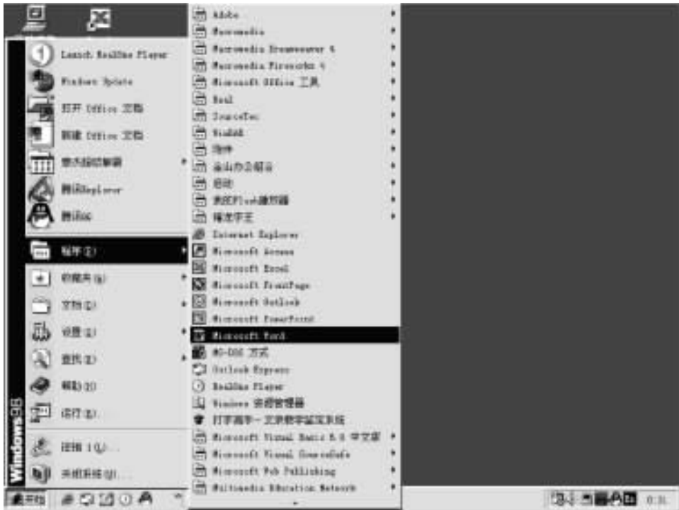
图 1.1 利用“开始”菜单启动 Word 2000