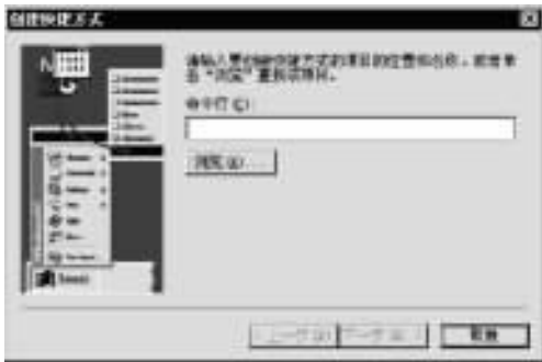
图 1.3 “创建快捷方式”对话框

(3) 单击“新建”子菜单中的“快捷方式”命令，打开“创建快捷方式”对话框，如图 1.3 所示。