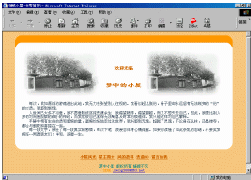
图 1.1 使用图形的 Web 页面

在 Web 的发展中存在着一种不容怀疑的趋势，那就是图形 Web 页面的爆炸性发展。现在，我们在网上畅游时可以注意到图形在 Web 上得到了广泛的使用，这也包括大量的使用了动态图形 (动画)，使图形 Web 充满网络的各个角落。如图 1.1 所示，就是使用了图形的 Web 页面。