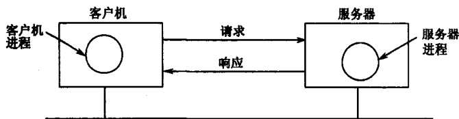
图 1-1 客户机/服务器模型

从本质上讲，Web 是基于客户机/服务器的一种体系结构，如图 1-1 所示。客户机向服务器发送请求，要求执行某项任务，而服务器执行此项任务，并向客户机返回响应。Web 客户程序叫做浏览器（Browser），而浏览器程序基本上都是标准化的。因此，Web 体系结构可以称为浏览器/服务器结构。