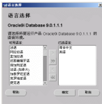
图 1-6 语言选择窗口