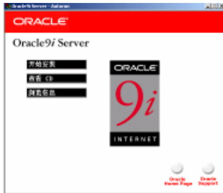
图 1-1 Oracle9i Server 安装系统封面窗口