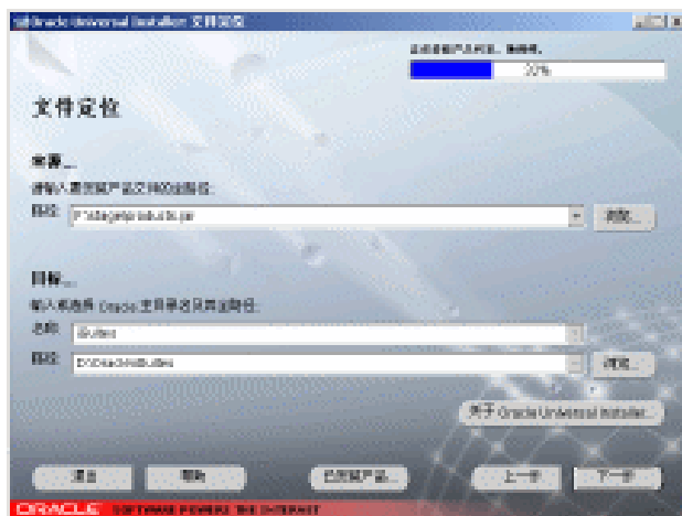
图 1-4 带进度条的文件定位窗口

单击“下一步”按钮显示如图1-4所示的带“正在装载产品列表”进度条的“文件定位”窗口。该窗口就是在图1-3“文件定位”窗口的右上角出现一个正在装载产品列表的进度显示条窗口。