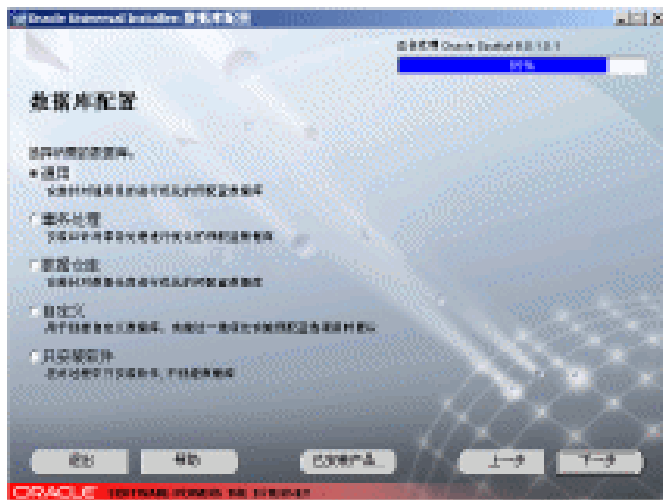
图 1-10 带“正在设置”进度条的数据库配置窗口