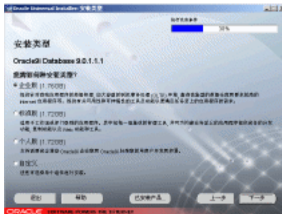
图 1-8 带执行先决条件进度条的安装类型窗口

可以根据需要选择安装类型，如果有充足的磁盘空间，建议选择“企业版”，一般可选择“标准版”，如果不是对Oracle9i非常了解的话，最好不要选择“自定义”。这里选择“企业版”，单击“下一步”按钮，出现“执行先决条件”进度条，如图1-8所示。