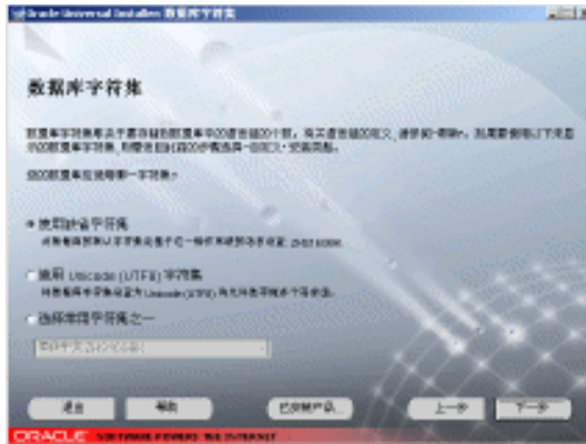
图 1-13 数据库字符集窗口

选定数据库文件目录后，单击“下一步”按钮，显示如图1-13所示的“数据库字符集”窗口，选择数据库使用的字符集。如果要使用数据库字符集窗口中未显示的数据库字符集，必须在图1-9中选择自定义安装。