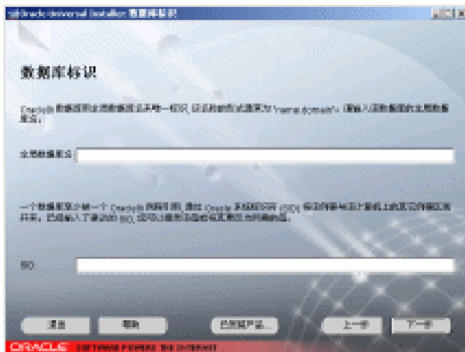
图 1-11 数据库标识窗口

装载完成后，单击“下一步”按钮，显示如图1-11所示的“数据库标识”窗口，要求输入全局数据库名和Oracle9i系统标识符SID。