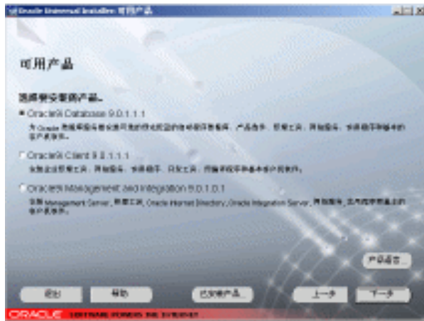
图 1-5 可用产品选择窗口