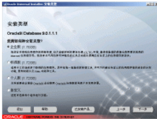
图 1-7 安装类型窗口