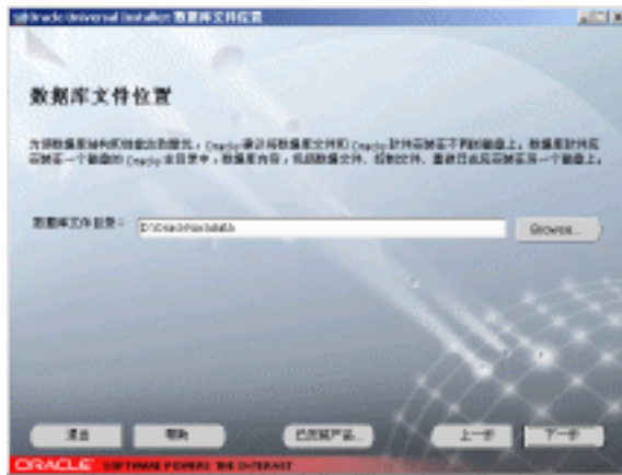
图 1-12 数据库文件位置窗口