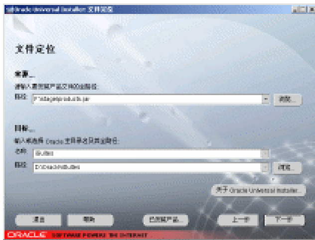
图 1-3 文件定位窗口