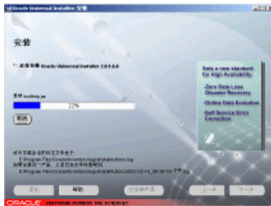
图 1-15 安装窗口