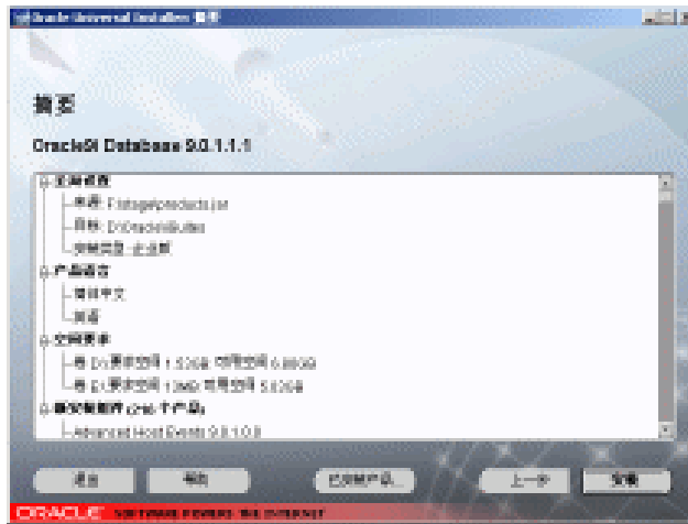
图 1-14 摘要窗口