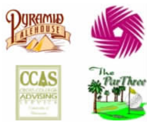
图 1-4 网站 Logo

网站 Logo 也称为网站标志,网站标志是一个站点的象征,也是一个站点是否正规的标志之一。网站的标志应体现该网站的特色、内容及其内在的文化内涵和理念。成功的网站标志有着独特的形象标识,在网站的推广和宣传中将起到事半功倍的效果。网站标志一般放在网站的左上角,访问者一眼就能看到它。网站标志通常有3种尺寸:88×31像素、120×60像素和120×9像素。如图1-4所示为一些网站的Logo。