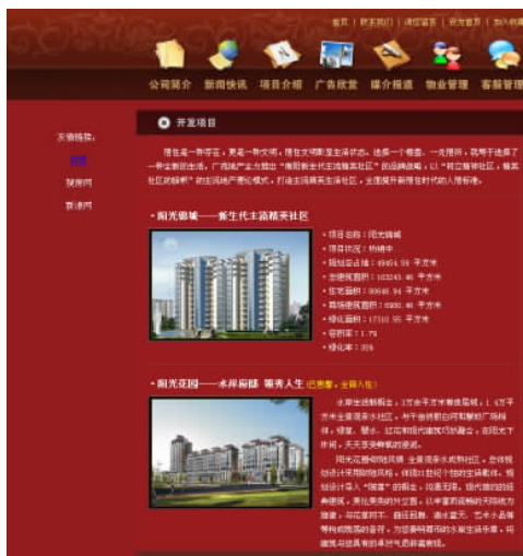
图 1-8 在网页中使用图片

图像在网页中具有提供信息、展示形象、装饰网页、表达个人情趣和风格的作用。图像是文本的说明和解释，在网页适当位置放置一些图像，不仅可以使文本清晰易读，而且使得网页更加有吸引力。现在几乎所有的网站都使用图像来增加网页的吸引力。可以在网页中使用 GIF、JPEG 和 PNG 等多种图像格式，其中使用得最广泛的是 GIF 和 JPEG 两种格式。如图 1-8 所示的网页中插入的楼盘图片生动形象地展示了楼盘信息。