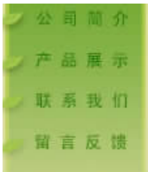
图 1-6 网站的左侧导航栏

一般来说，网站中的导航位置在各个页面中出现的位置是比较固定的，而且风格也较为一致。导航的位置一般有 4 种：在页面的左侧、右侧、顶部和底部。有时候在同一个页面中运用了多种导航。当然并不是导航在页面中出现的次数越多越好，而是要合理地运用，达到页面总体的协调一致。如图 1-6 所示为网站的左侧导航栏。