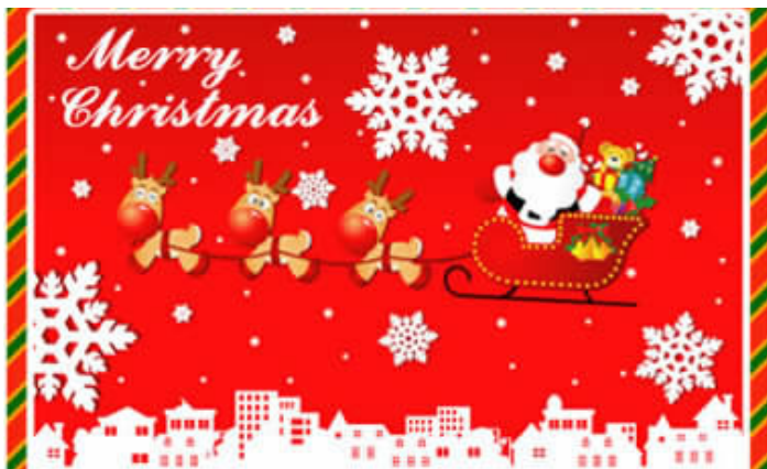
图 1-9 Flash 动画制作的页面

Flash 动画具有简单易学、灵活多变的特点，所以受到很多网页制作人员的喜爱。它可以生成亮丽夺目的图形界面，而文件的体积一般只有 5~50KB。随着 ActionScript 动态脚本编程语言的发展，Flash 已经不再局限于制作简单的交互动画程序，通过复杂的动态脚本编程可以制作出各种各样有趣、精彩的 Flash 动画。由于 Flash 动画具有很强的视觉冲击力和听觉冲击力，因此一些公司网站往往会采用 Flash 制作相关的页面，借助 Flash 的精彩效果吸引客户的注意力，从而达到比以往静态页面更好的宣传效果。图 1-9 所示为使用 Flash 动画制作的页面。