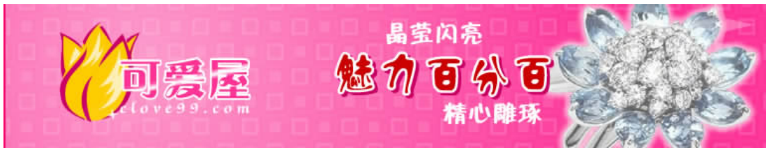
图 1-5 网站 Banner

网站 Banner 首先要美观，这个小的区域如果设计得非常漂亮，让人看上去很舒服，那么即使 Banner 不是浏览者所要看的内容，或者是一些他们可看可不看的东西，他们也会很有趣地去看看，点击就是顺理成章的事情了。网站 Banner 还要与整个网页协调，同时又要突出、醒目，用色要同页面的主色相搭配，如主色是浅黄，广告条的用色就可以用一些浅的其他颜色，切忌用一些对比色。如图 1-5 所示为设计的网站 Banner。