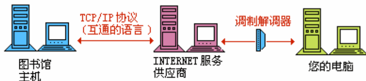
图 1-1 Internet 示意图

Internet 是一个全球性的计算机互联网络，中文名称为“国际互联网”或“因特网”，它集现代通信技术和现代计算机技术于一体，是计算机之间进行国际信息交流和实现资源共享的良好手段。Internet 将各种各样的物理网络联接起来，构成一个整体，而不论这些网络类型的异同、规模的大小和地理位置的差异，如图 1-1 所示。