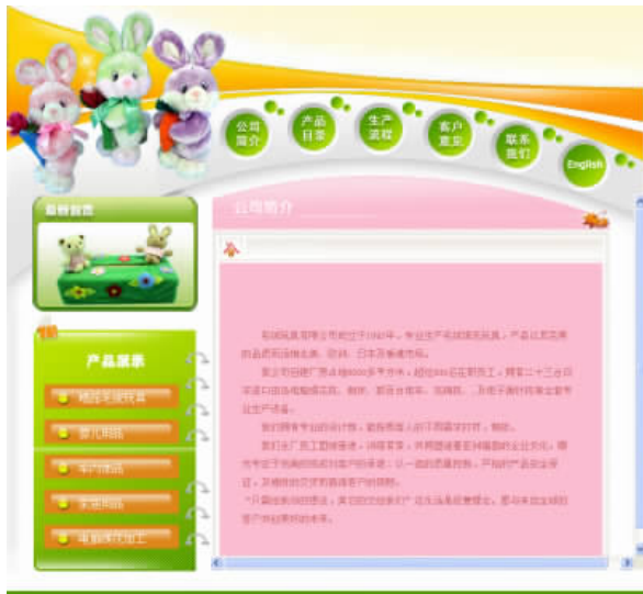
图 1-7 网页运用了大量文本

页，激发读者的兴趣。为了克服文字固有的缺点，人们赋予了文本更多的属性，如字体、字号、颜色等，通过不同格式的区别，突出显示重要的内容。此外，还可以在网页中设置各种各样的文字列表来明确表达一系列的项目。这些功能给网页中的文本增加了新的生命力。如图 1-7 所示的网页右侧的公司简介部分就运用了大量文本。