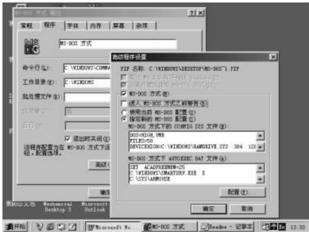
图 1.1 WIN 9X 下为 CAXA - CPD 设置 DOS 环境

CAXA - CPD 6. X 版是在 DOS 平台上运行的软件包,对于安装 WIN 95 或 WIN 98 的电脑要对 DOS 环境进行特定准备,以保证 CAXA - CPD 软件得以正常运行。在 WIN 9X 操作系统下有多种方式进入 DOS 环境,其中有些方式的兼容性较差,这里只介绍比较可靠的一种:首先在桌面上建“MS - DOS 方式”的快捷方式(方法参看 WINDOWS 9X 的书或请教行家),用鼠标指向该快捷方式右击弹出菜单,选“属性”→“程序”→“高级”进入高级程序设置对话框,如图 1.1 所示。