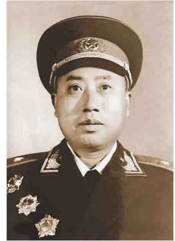
中国人民解放军原济南 军区副司令员成少甫