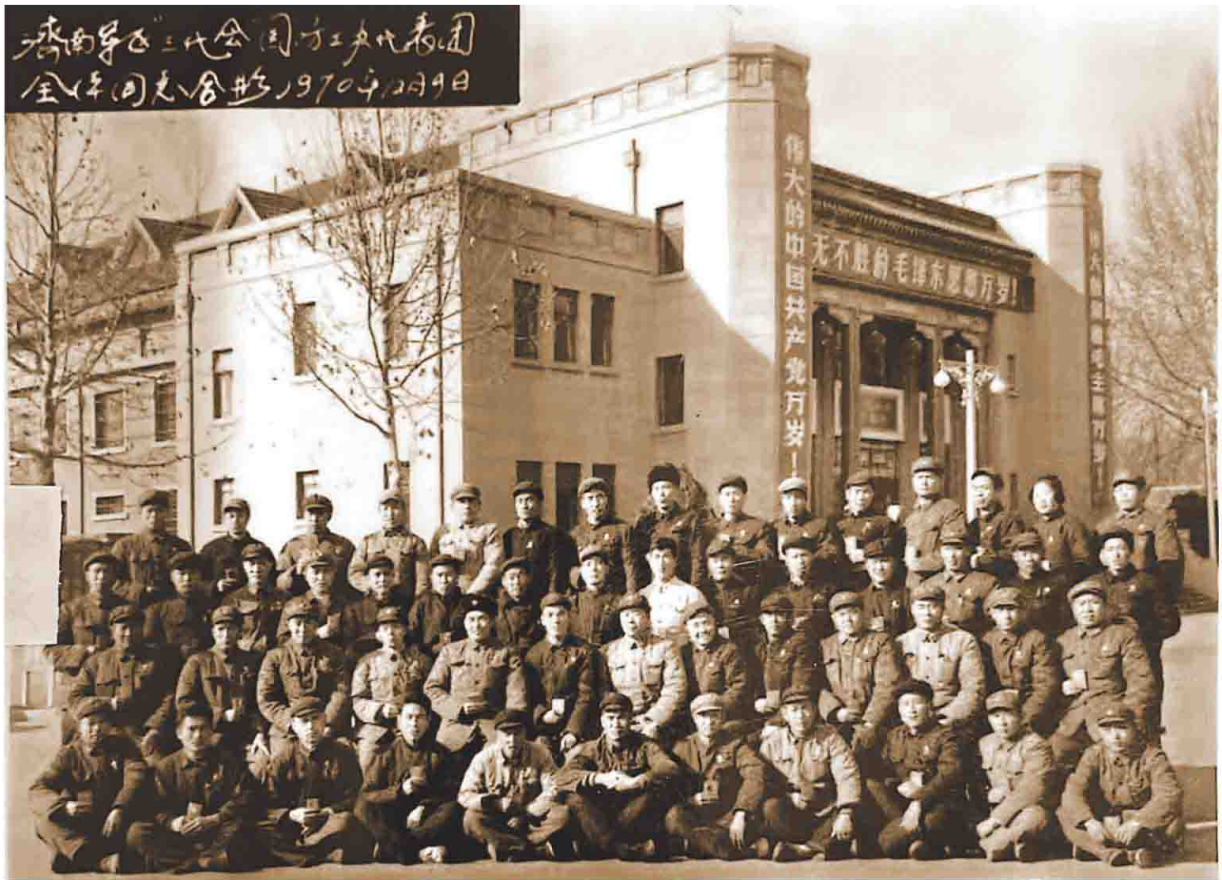
1970年12月9日，中国人民解放军济南军区“三代会”国防工业代表团全体同志合影