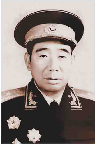
中国人民解放军原济南 军区副司令员杨国夫