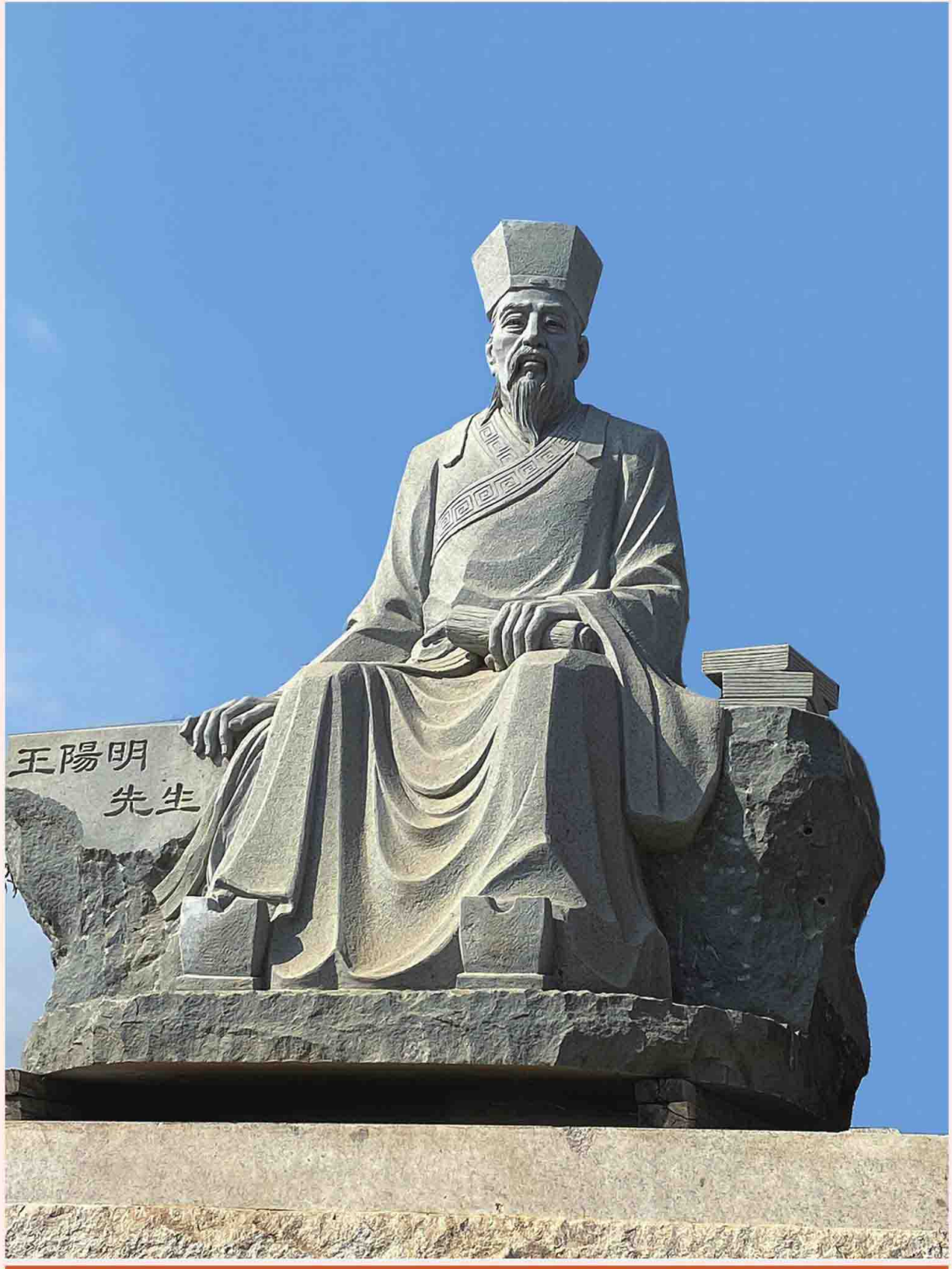
阳明先生石雕像