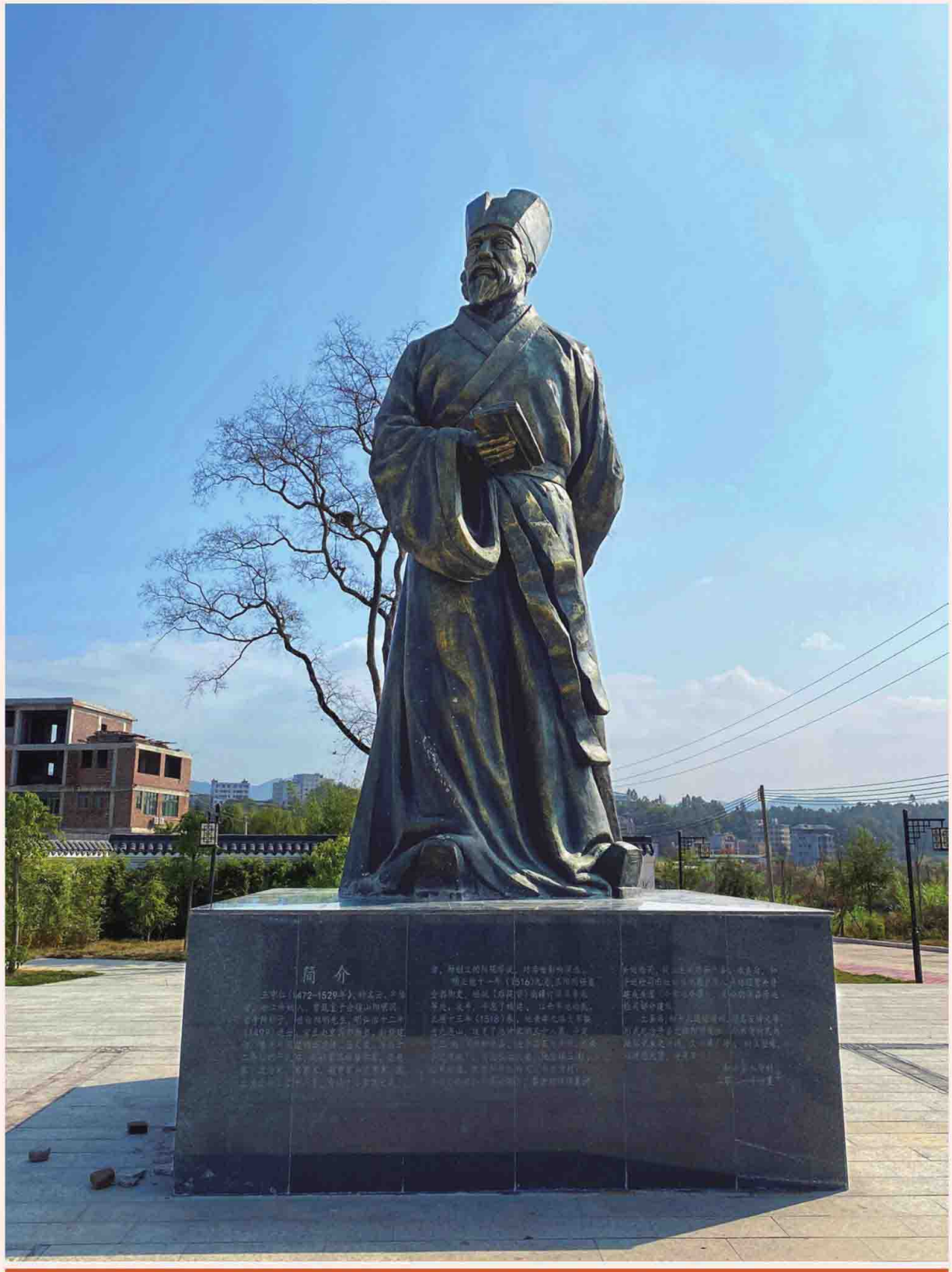
阳明先生塑像（和平县水背村阳明广场）