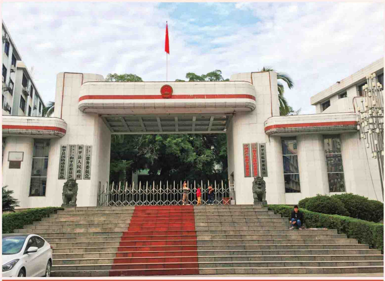
和平县人民政府旧址正门（老衙门）

和平县人民政府旧址已有 500 多年历史，是王阳明在全国提议设县中使用最久的县衙。和平县始于正德十三年五月初一日（1518 年 6 月 8 日）王阳明奏设县治，朝廷于八月十一日（9 月 15 日）批准设立，隶属惠州府。2019 年 12 月 25 日，中共和平县委、县人民政府及下属各部门全部搬迁至和平大道的九子岗办公。