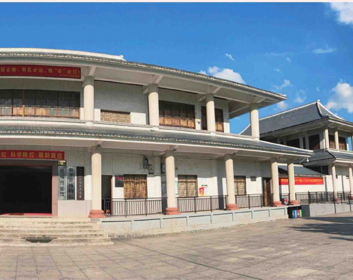
和平县阳明博物馆（全景 杨廷强 摄）