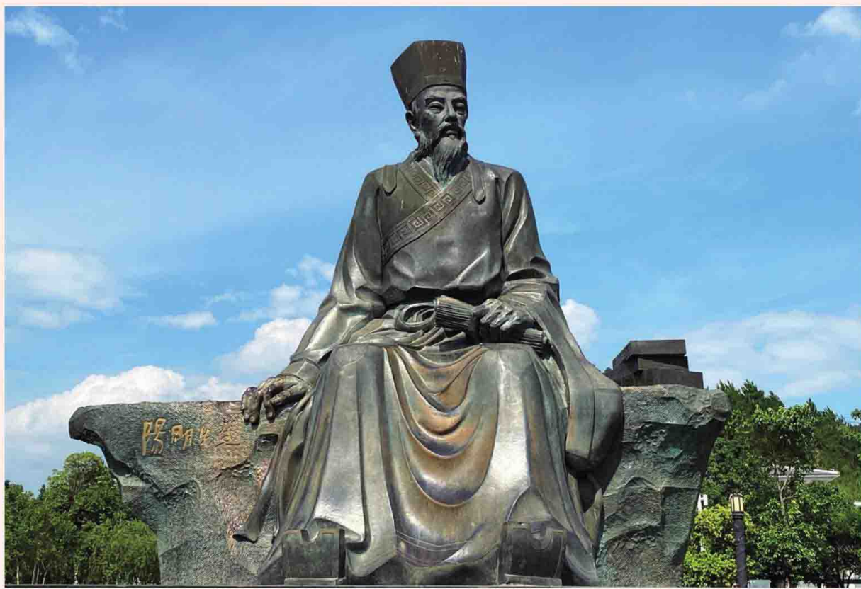
阳明先生大铜像（阳明公园内）