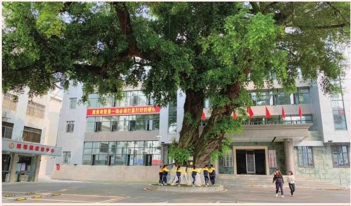
传说中的王阳明手植树（和平县人民政府旧址广场）