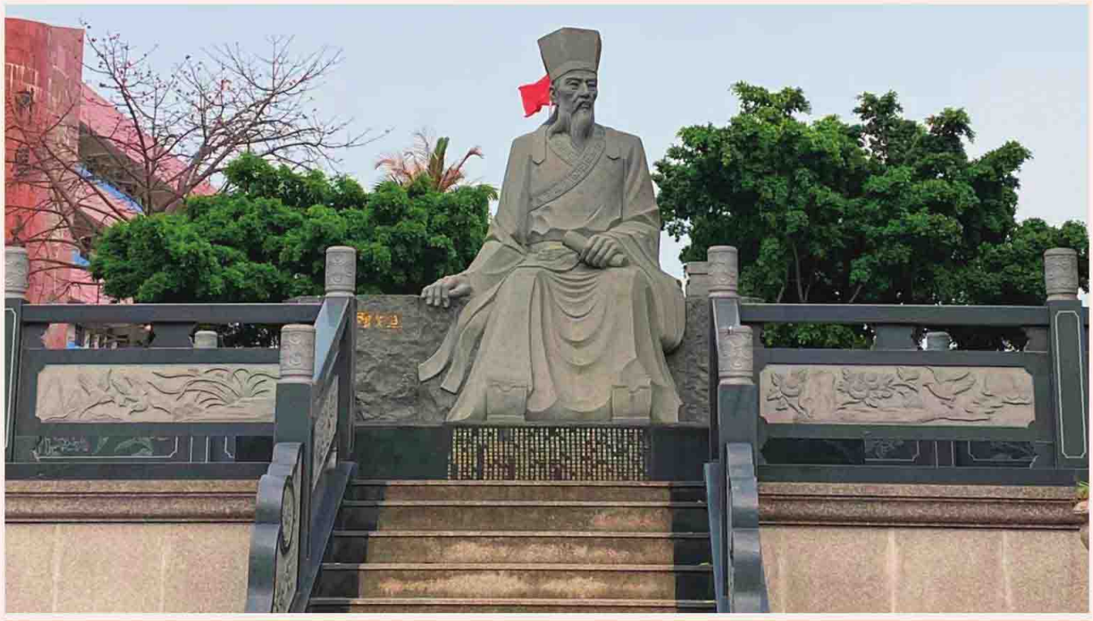
阳明先生石雕像（和平县阳明中学校内）