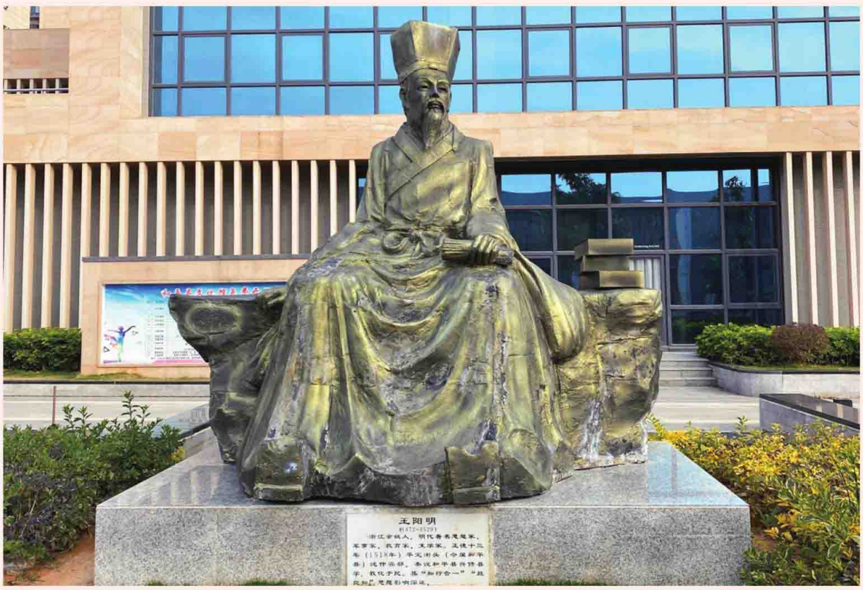
阳明先生塑像（和平县文化馆广场）