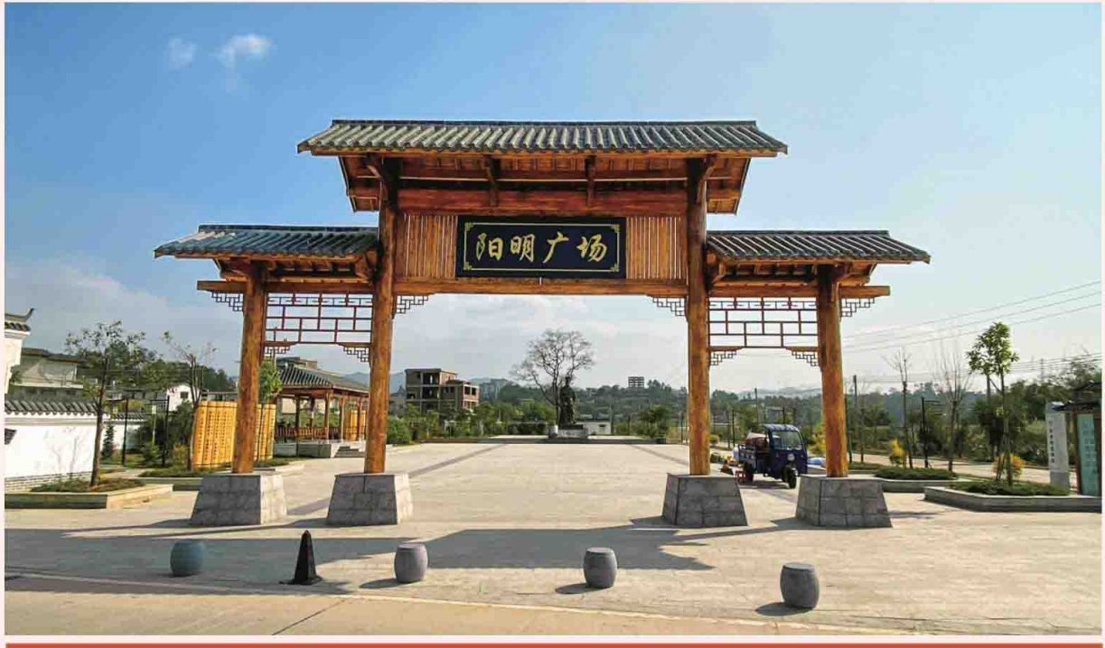
和平县水背村阳明广场