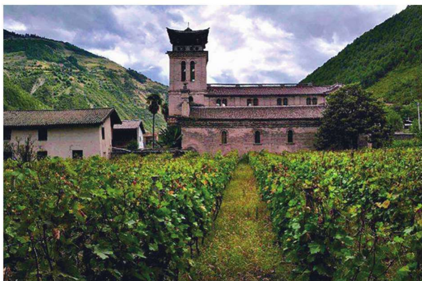
澜沧江右岸的茨中天主教堂

在茨中村子附近的梯田里种满了玫瑰蜜,这种在法国本土已经绝迹的葡萄却在中国偏僻的深山里生长良好。这里的老百姓从传教士那里学会了栽种葡萄和酿酒的技术,村里的家家户户都有制作葡萄酒的器具。当然,我的茨中之行不属梅里雪山外转经和内转经的路线。《指南经》中的《内圣地广志》里指明了内转线路上的各种圣迹,内转路途总长约一百公里:由白转经