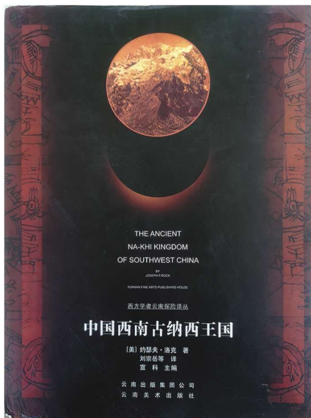
《中国西南古纳西王国》, [美] 约瑟夫·洛克 著、刘宗岳等译 云南美术出版社 1999 年版

来到纽约,洛克的第一份工作是洗盘子,在后来的日子里他历尽艰辛。1907年,洛克不顾大海潮湿的空气会加重他的结核病,依旧乘船到了夏威夷。在那里,他展现出了令人吃惊的才能,已经掌握了包括汉语与阿拉伯语在内的十种语言。洛克在一所中学找到了一份教授拉丁语和自然史的工作。出于对其所教自然史的责任心,洛克曾去调查夏威夷的动植物群落。有一天,他根据一个信息大摇大摆地走进美国国家农业部林业处的办公室,声称