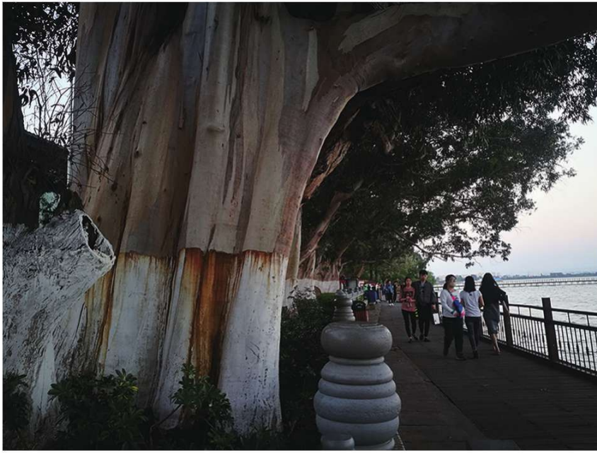
昆明滇池边巨大的蓝桉