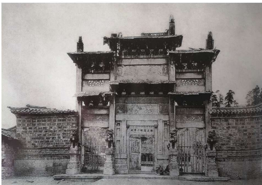
丽江木氏土司衙门大门石牌坊。约瑟夫·洛克摄,1922年 图片来源:哈佛大学燕京图书馆

1923年的某一天,洛克目睹了纳西族的东巴使用驱魔的方式给一个病妇治病的过程,对纳西族的人文历史产生了兴趣,开始研究纳西族和土司的历史以及东巴文化和象形文字,并取得非凡的成就,这就是后来人们称他为人类学家和语言学家的缘由。从1935年至1945年,他历时十年完成了研究纳西族历史的书稿,出版了几本关于东巴教仪式的书,并将研究成果一起编