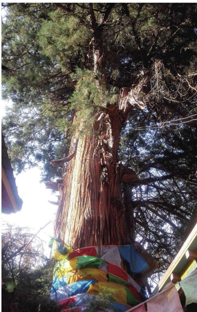
澜沧江边柏树庙前巨大的柏树，据说是卡瓦格博曾经使用过的手杖