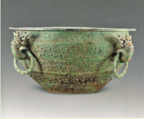
铜孟（沂水县纪王崮春秋墓出土）