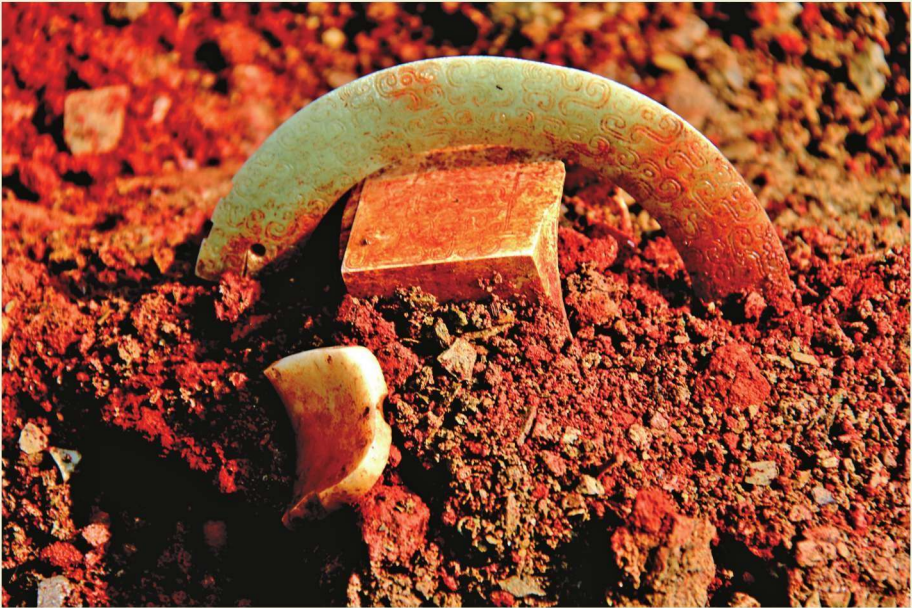
纪王崮春秋墓M1 棺玉器出土时