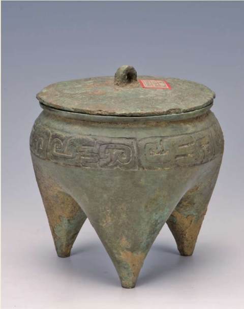
铜鬲（沂水县刘家店子春秋墓出土）