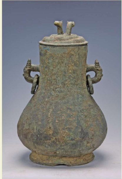
公铸壶（沂水县刘家店子春秋墓出土）