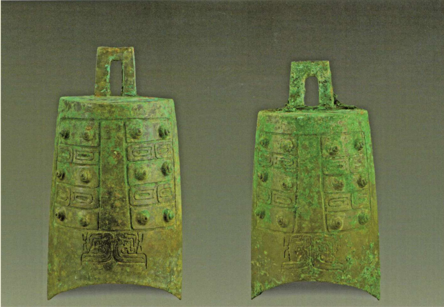
钮钟（沂水县纪王崮春秋墓出土）