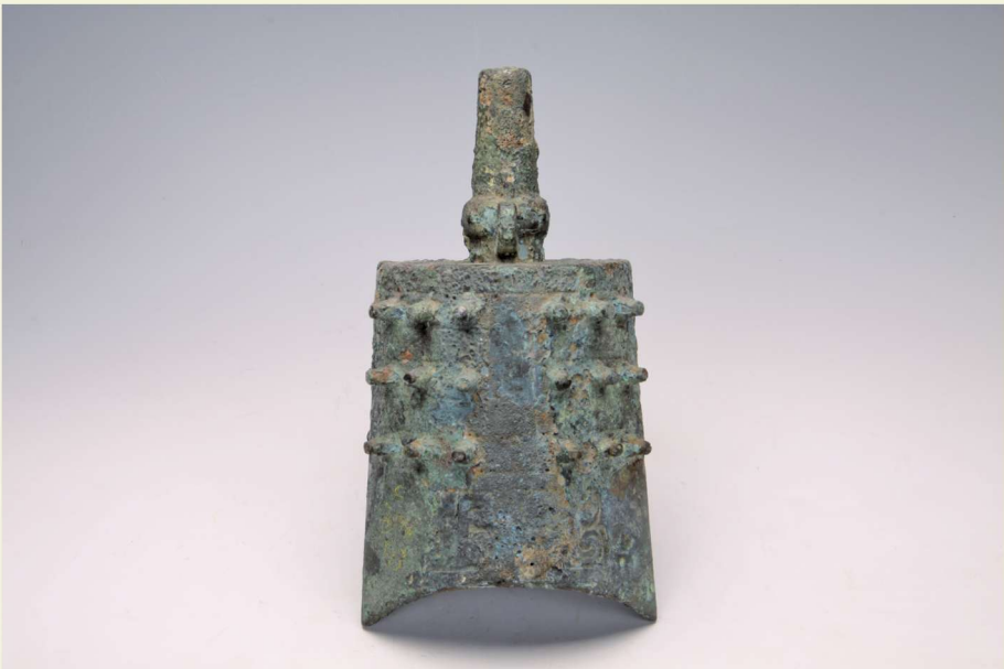
编钟（沂水县刘家店子春秋墓出土）