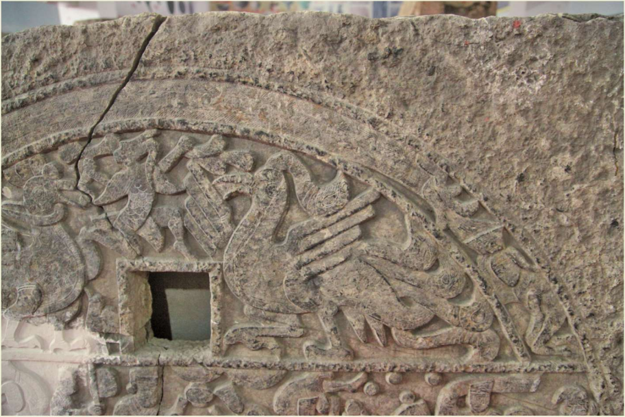
汉凤舞百戏画像石