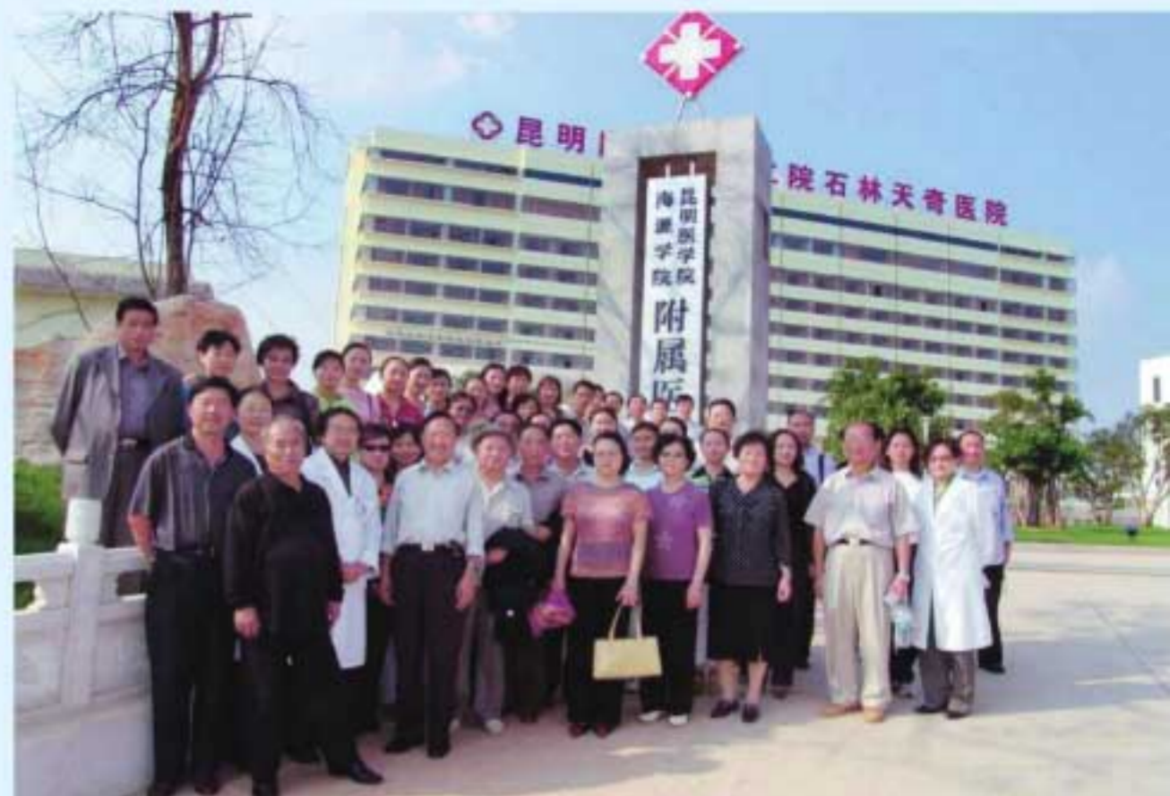
图7 2003年，学院建设的第一所非直属附属医院——石林天奇医院