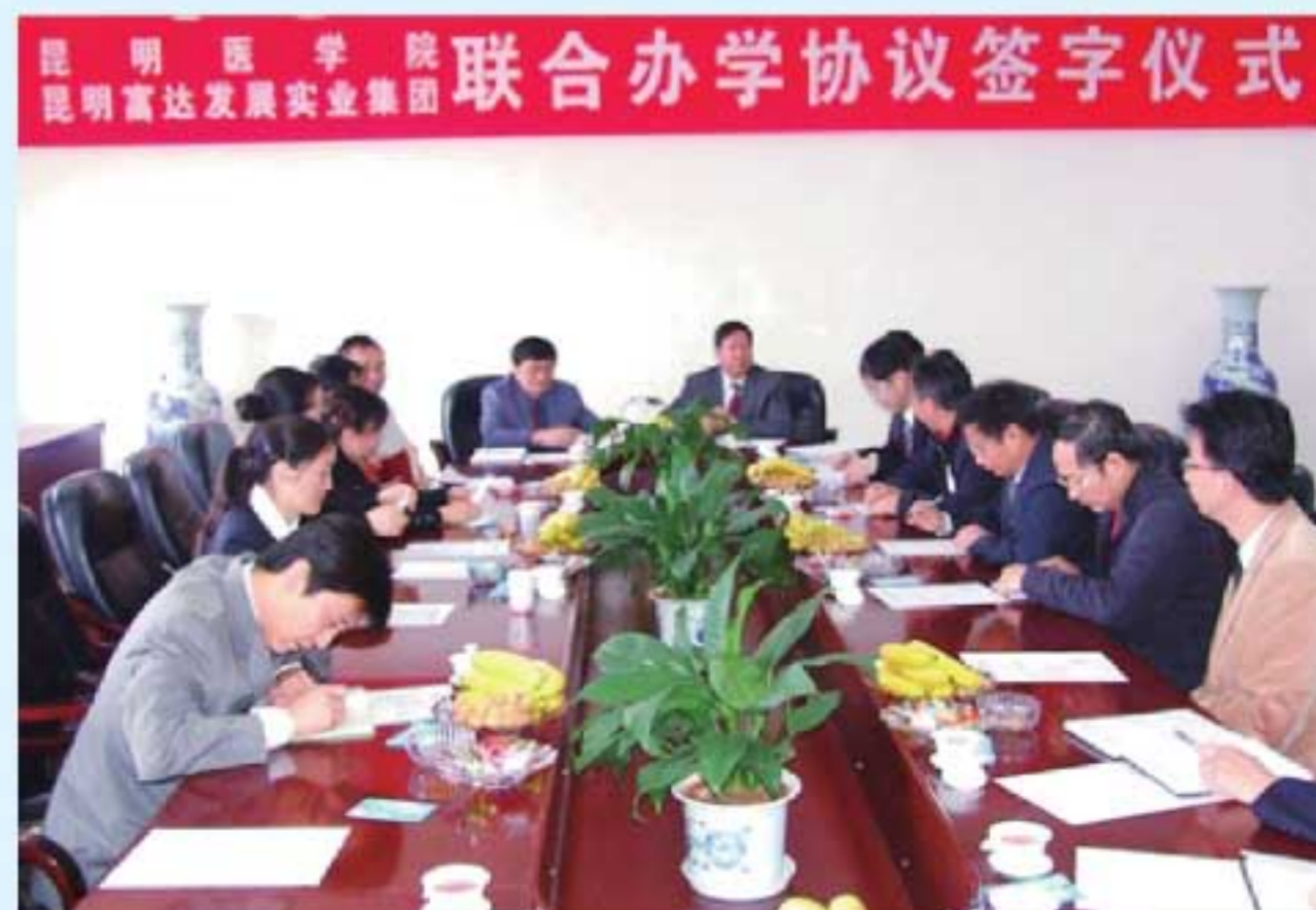
图9 2009年学院转制完成后举行联合办学签字仪式