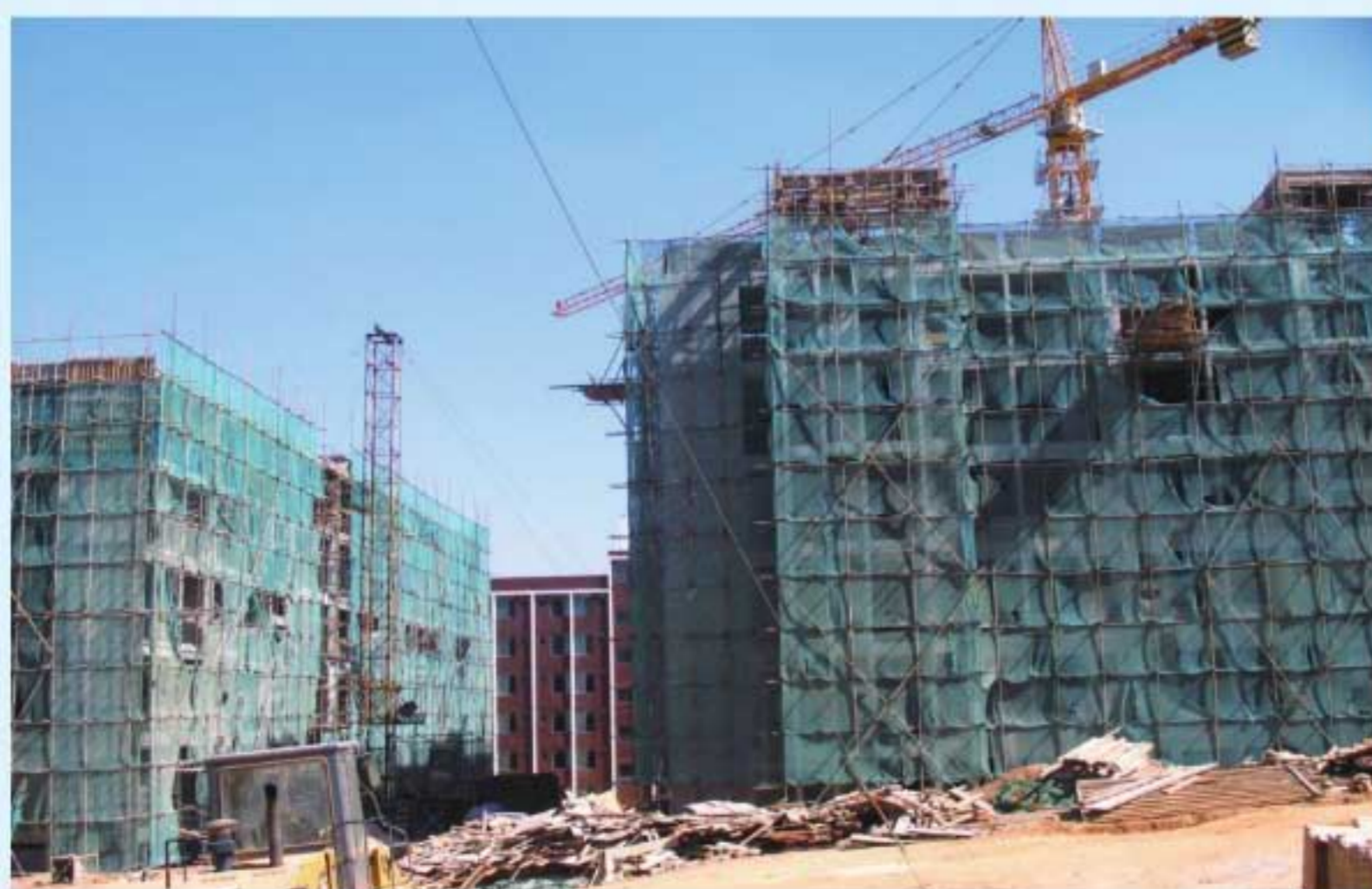
图11 建设中的海源学院杨林校区