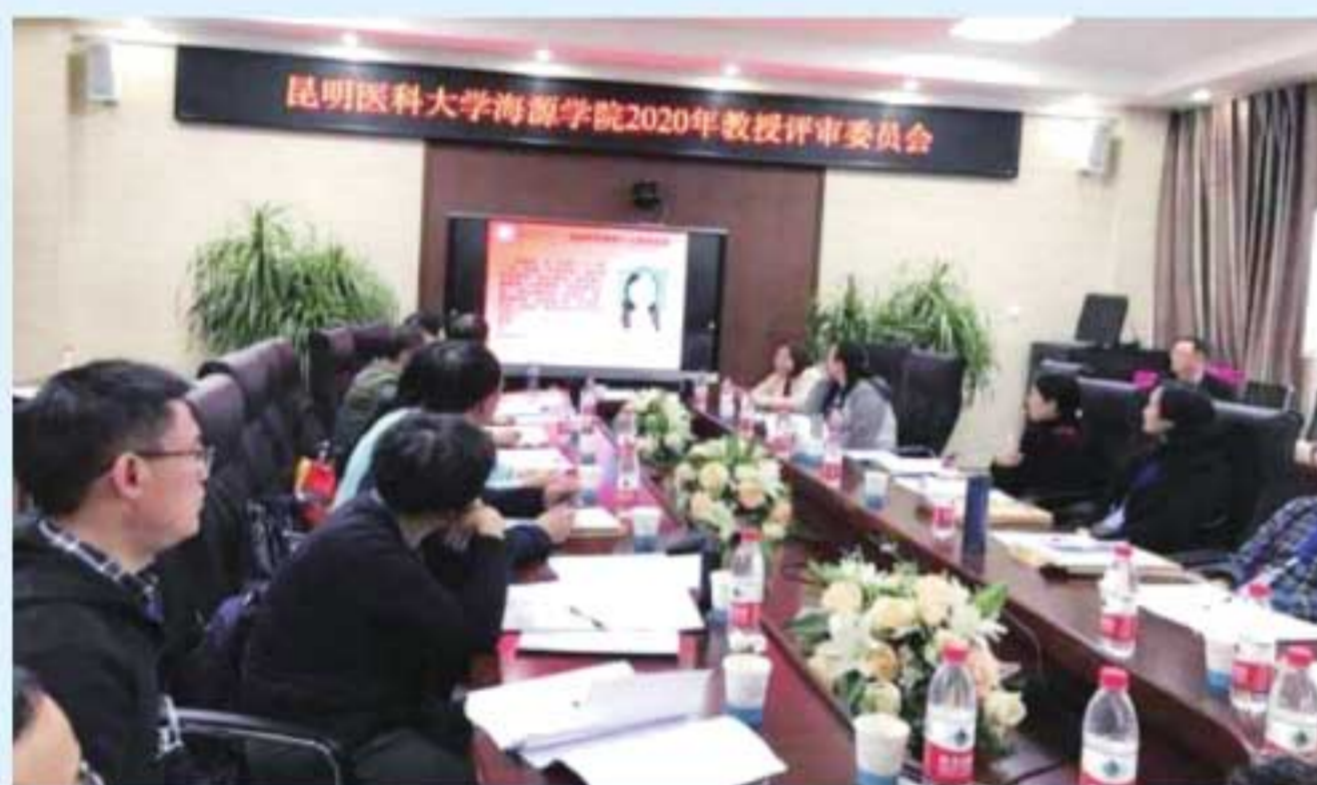
图16 2020年，举行首次正高级职称评审会