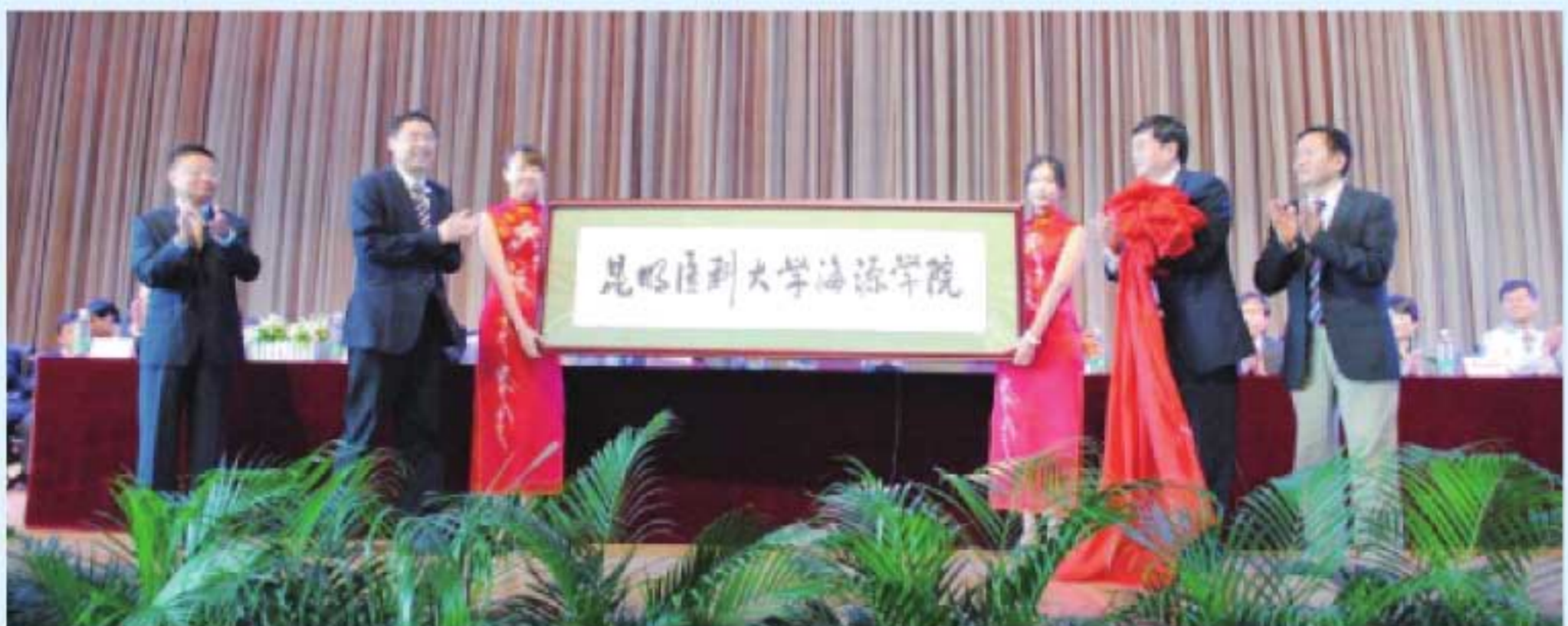
图14 2013年，昆明医科大学海源学院举行更名仪式