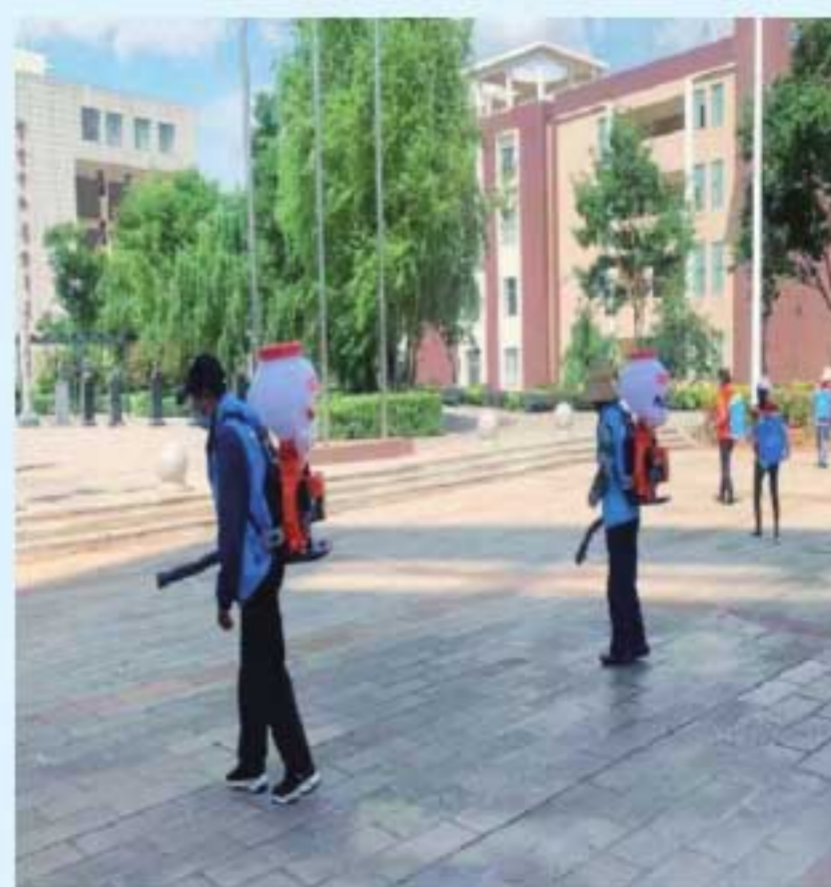
图18 疫情防控期间坚持开展校园消杀工作