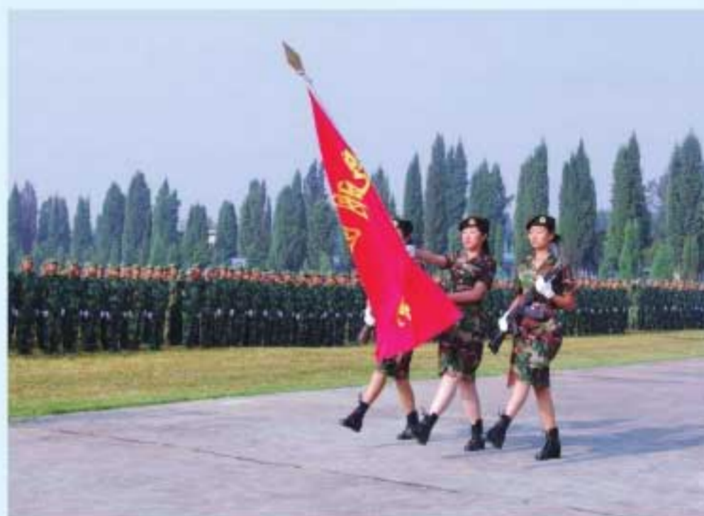
图28 2003年，学生参加云南省高校大学生军训演展获一等奖