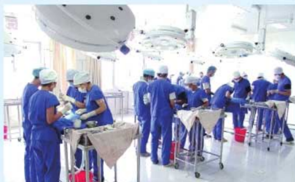
图23 学院建成省级实验教学示范中心——临床技术实验中心并投入开展教学