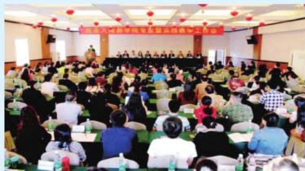
图25 学院举行2016年专业暨实践教学基地教学工作会