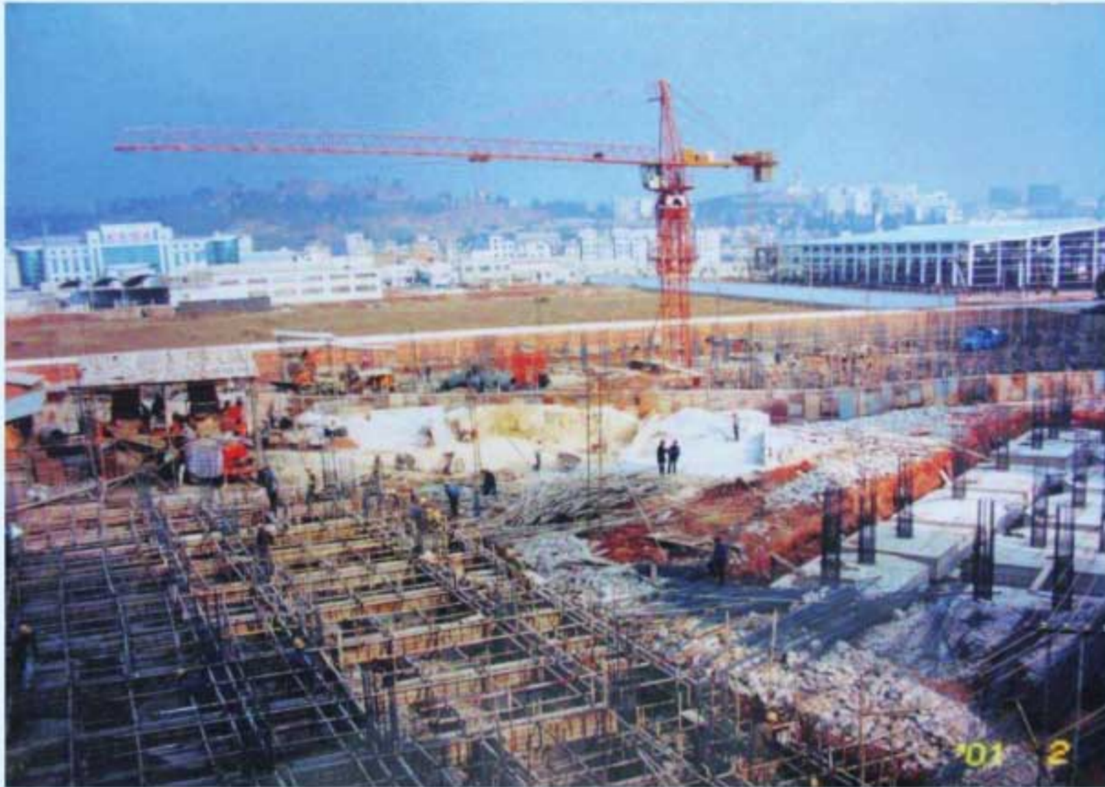
图1 建设中的海源学院高新校区