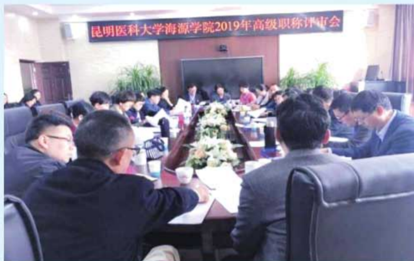
图15 2019年，学院举行首次副高级职称评审会