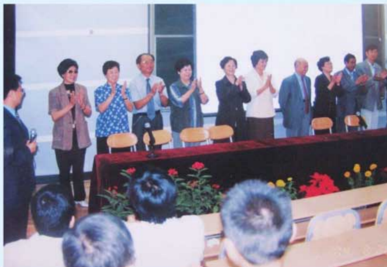
图5 昆明医学院及社会各界专家教授受聘仪式