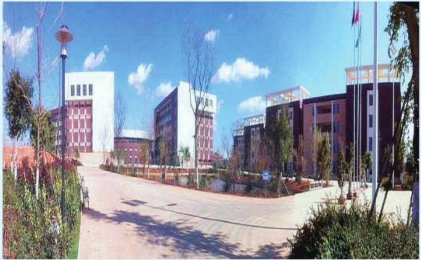
图12 建设落成的杨林校区