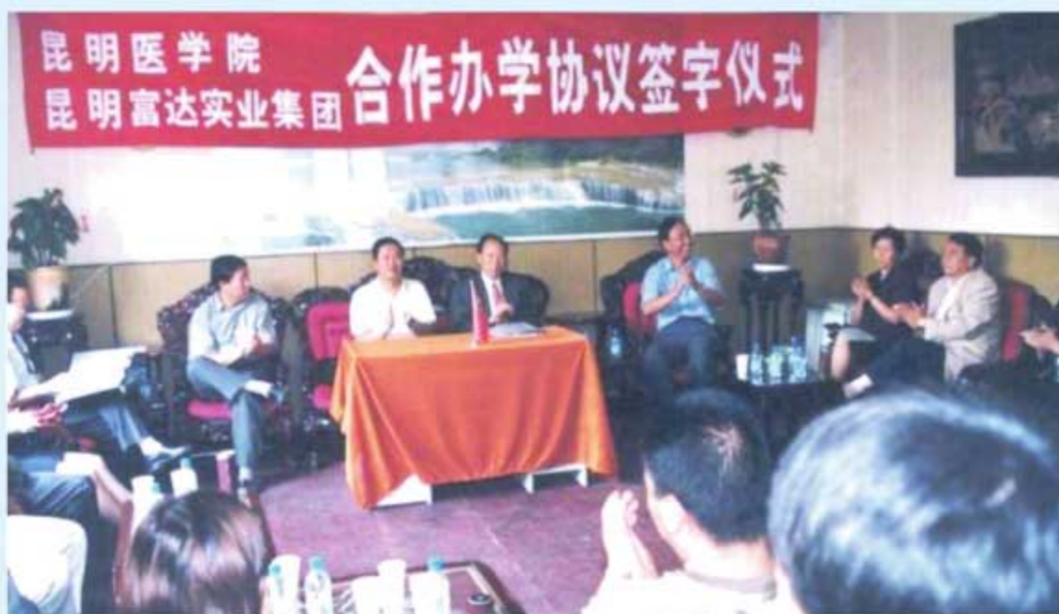
图3 2001年8月，昆明医学院与昆明富达实业集团举行合作办学协议签字仪式