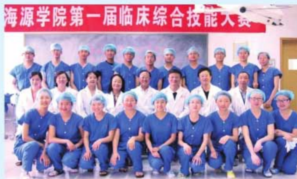
图24 学院举办第一届临床综合技能大赛