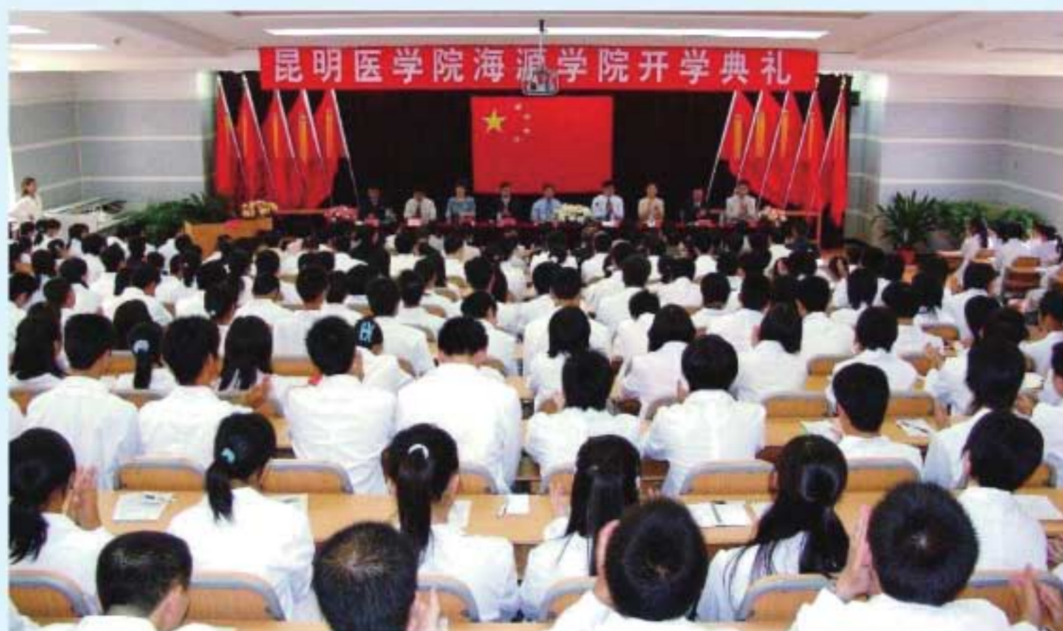
图22 建院初期的开学典礼