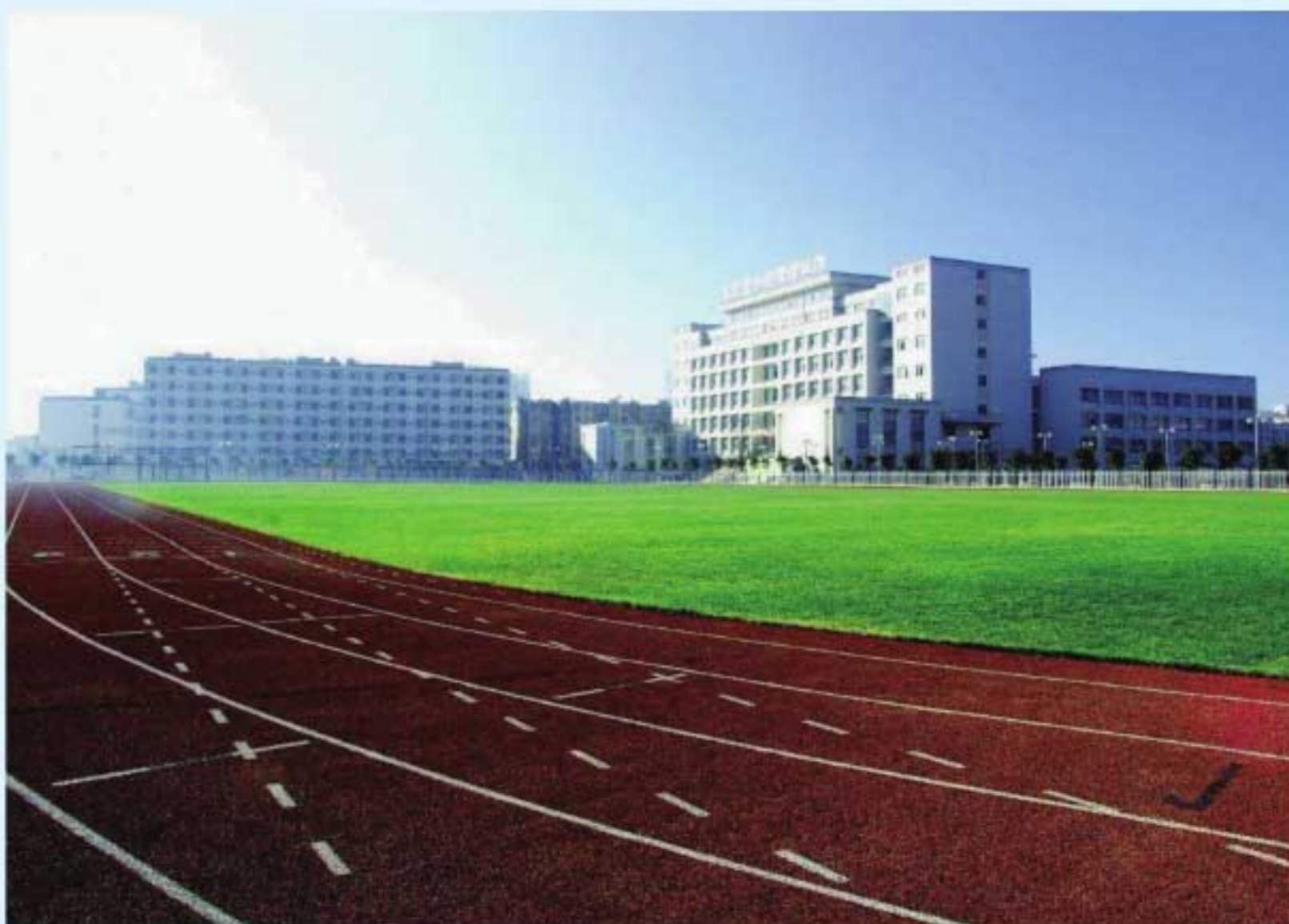
图2 建设落成的高新校区