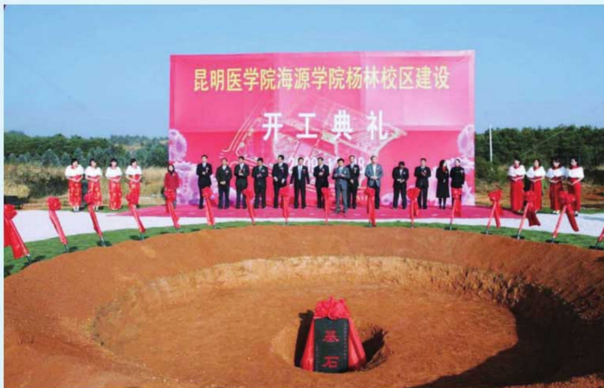
图10 2009年，学院杨林校区建设开工典礼