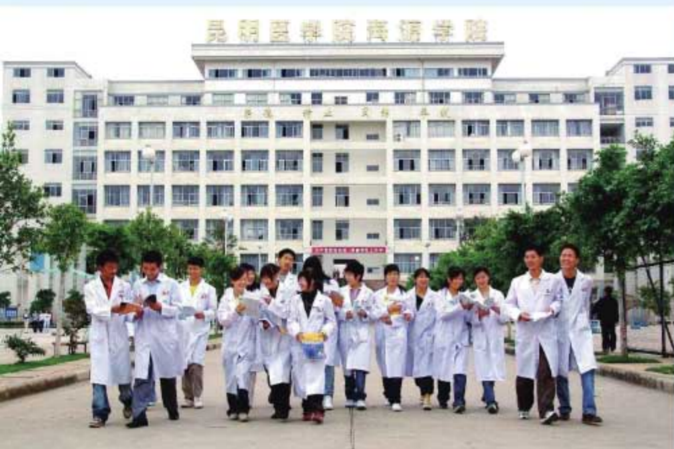
图6 朝气蓬勃的海源学院学子