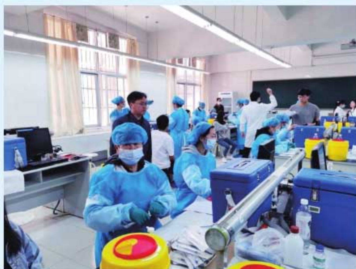
图17 学院规范设立新冠疫苗接种点，确保做到全院师生员工应接尽接、能接尽接