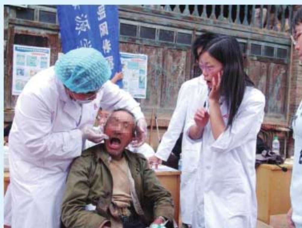
图29 学生到基层开展社会实践和健康医疗服务