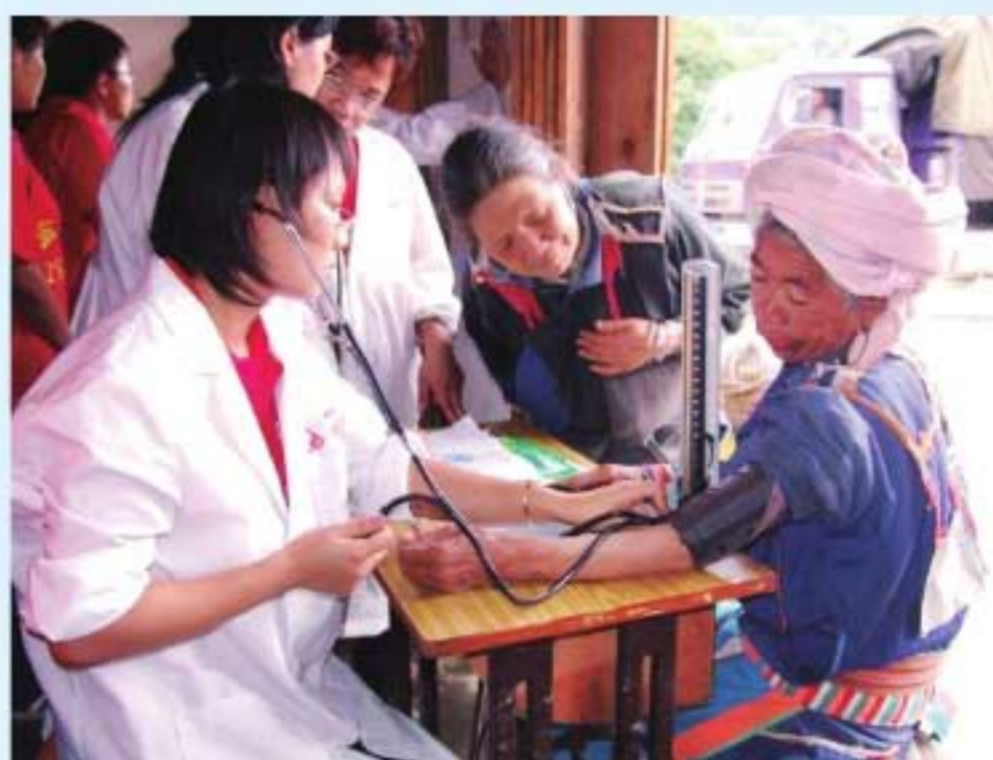
图30 学生深入山区为少数民族群众开展诊疗服务