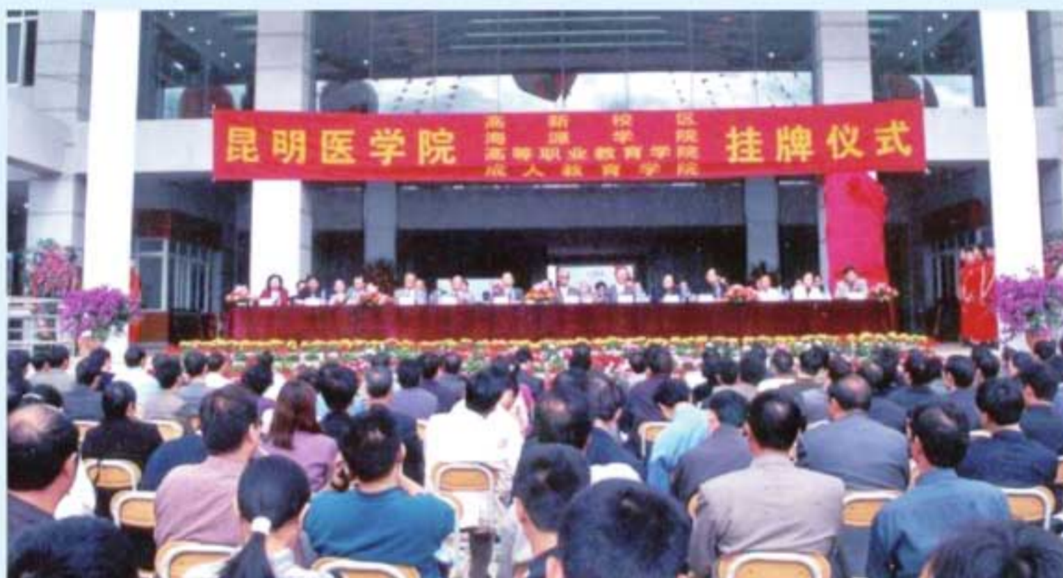
图4 2001年10月，昆明医学院高新校区挂牌仪式举行