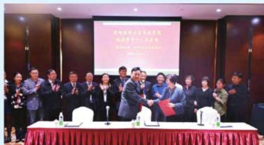
图26 2018年，学院与昆医大附属昭通医院签署“医教协同”合作协议