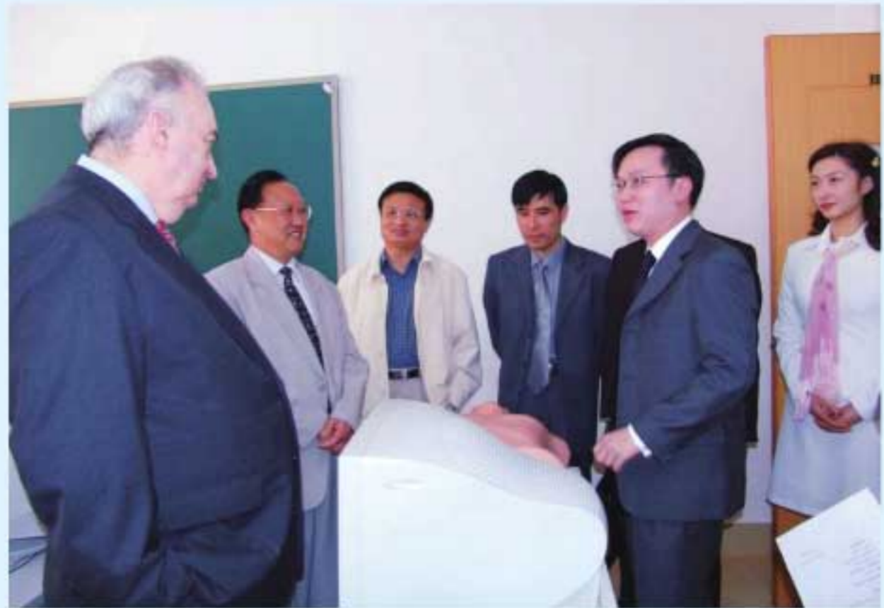
图19 2006年，澳大利亚詹姆斯·库克大学代表团来我院访问