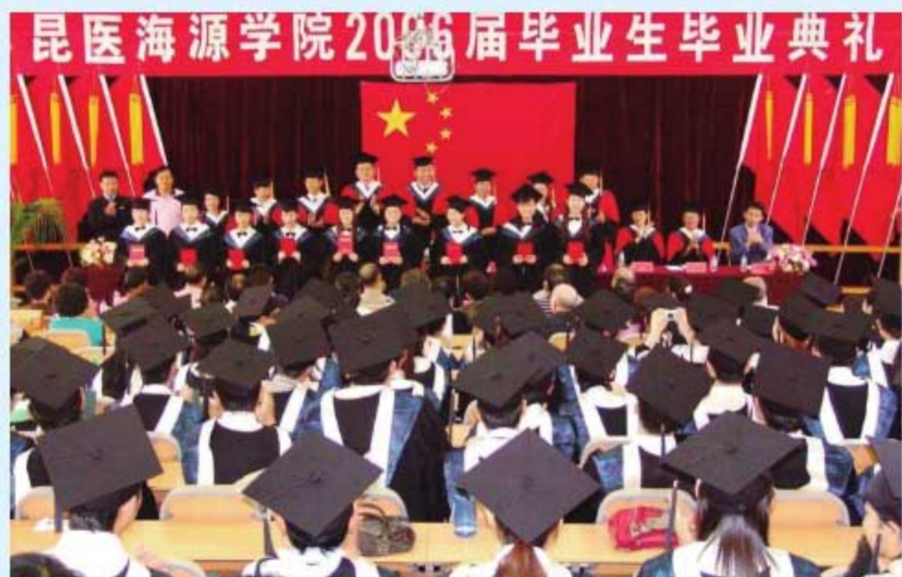
图8 2006年7月，学院首届毕业生毕业典礼