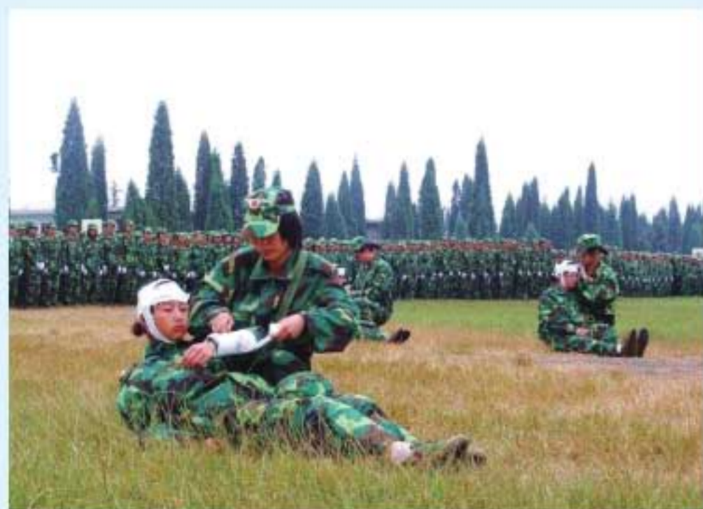
图27 体现医学办学特色的学生军训