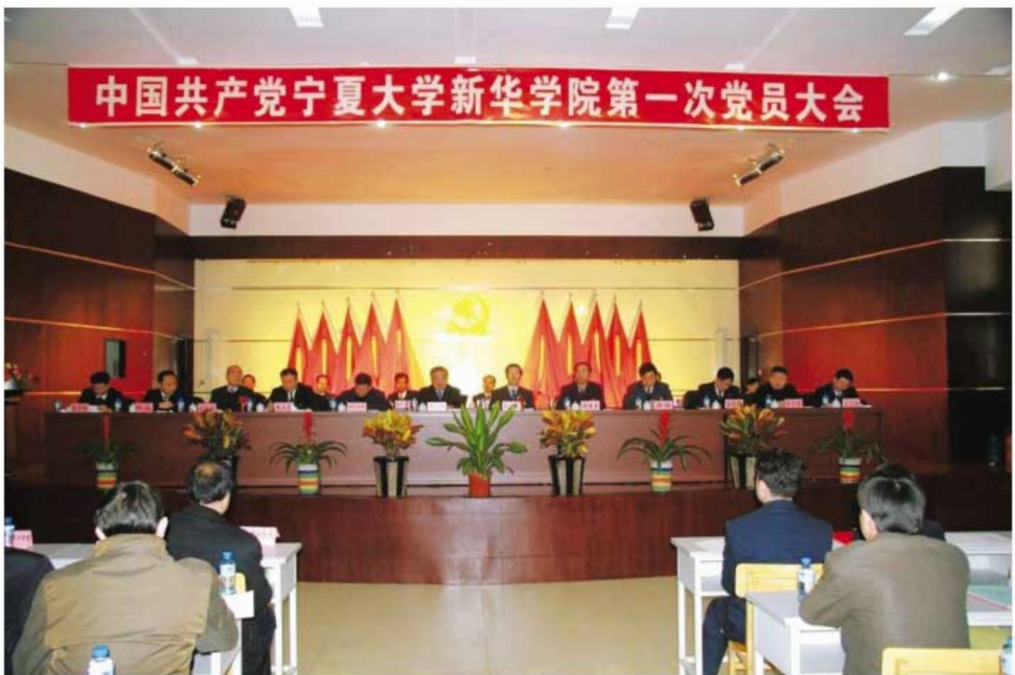
中国共产党宁夏大学新华学院第一次党员大会