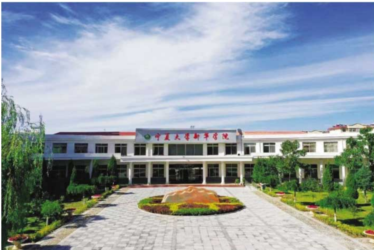
宁夏大学新华学院南区