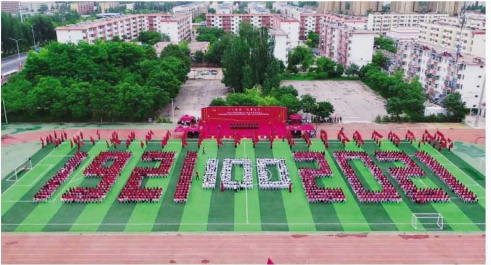
2021 届毕业生毕业典礼暨庆祝中国共产党成立 100 周年千人唱响《没有共产党就没有新中国》活动