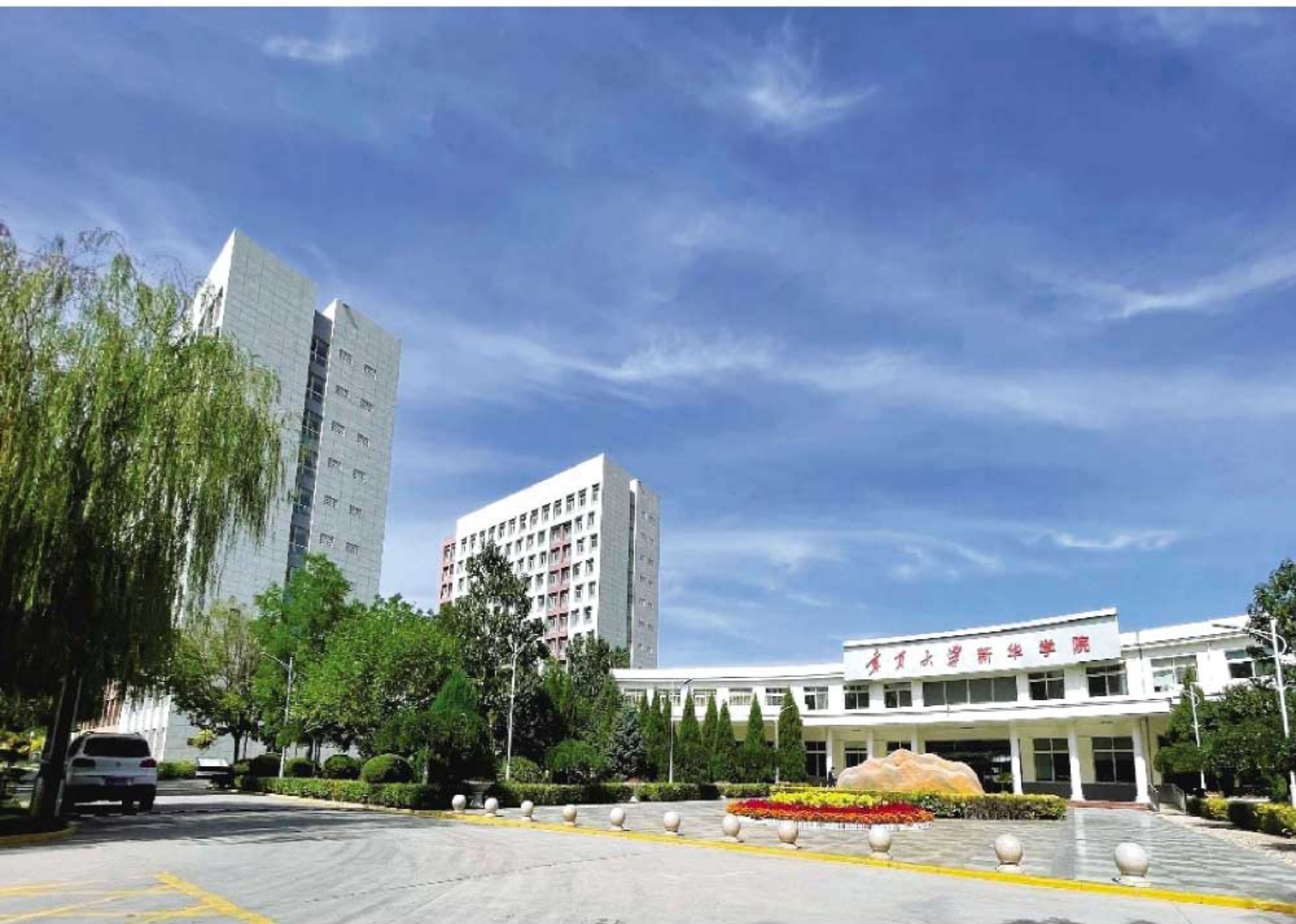
宁夏大学新华学院