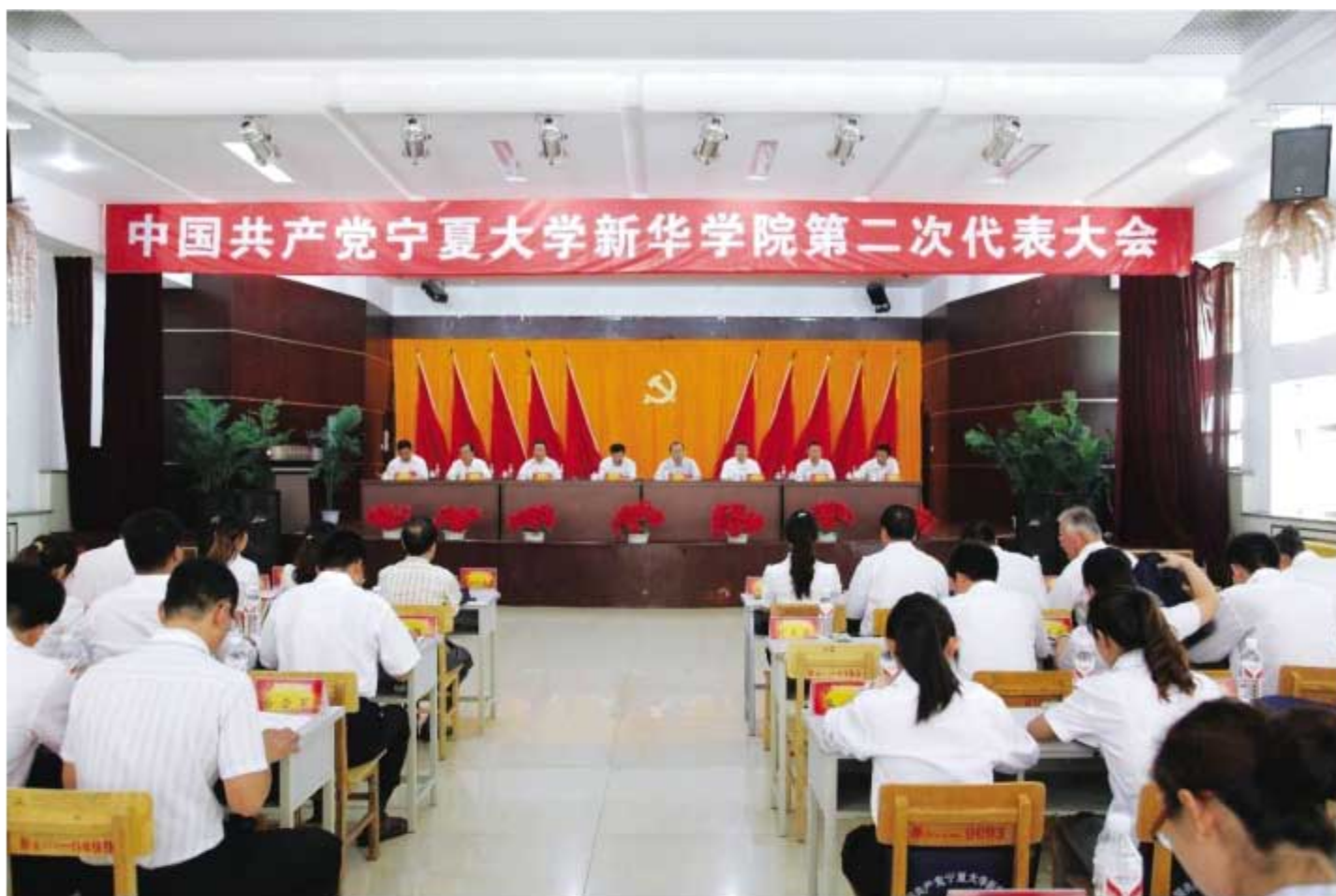
中国共产党宁夏大学新华学院第二次代表大会