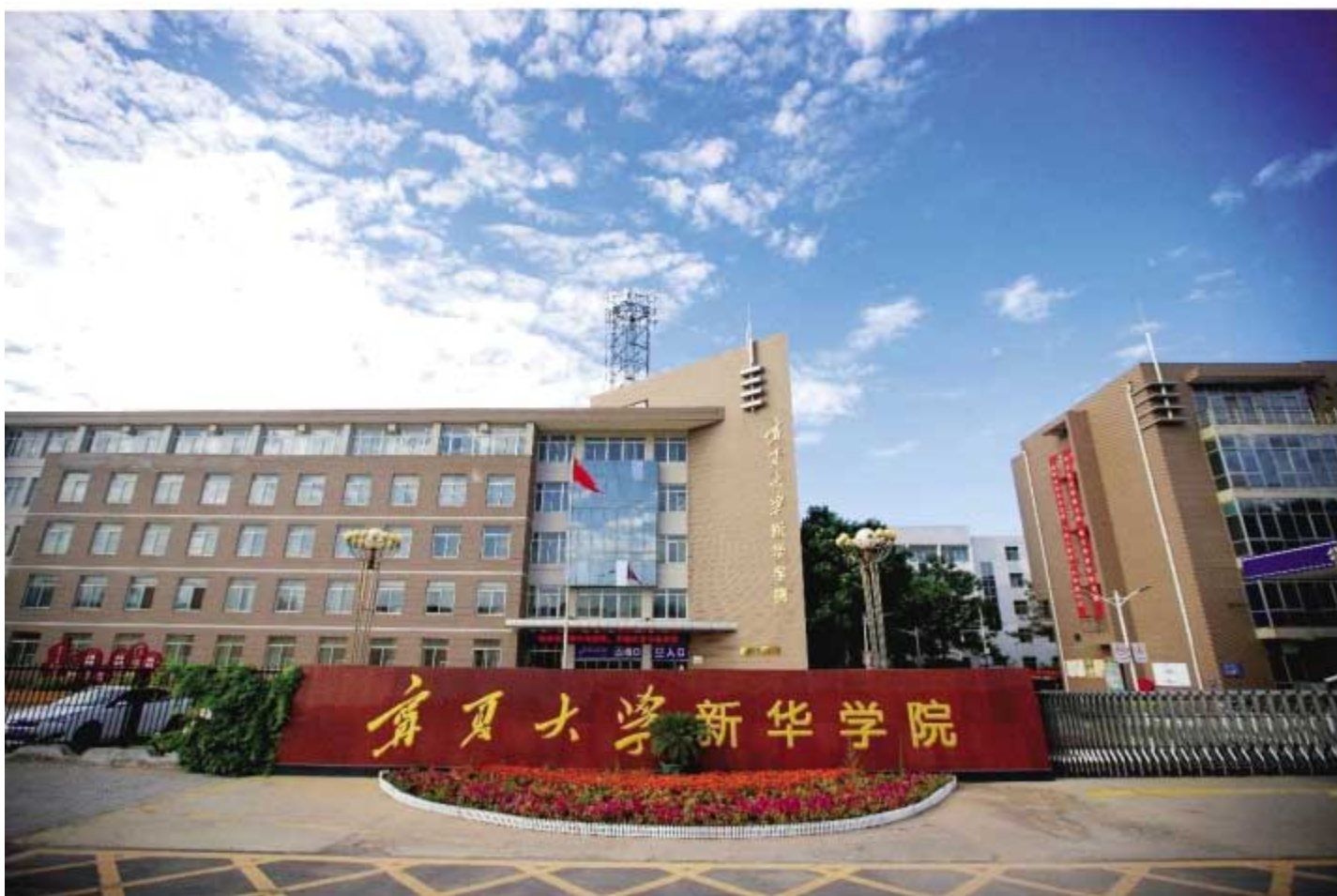
宁夏大学新华学院中心区