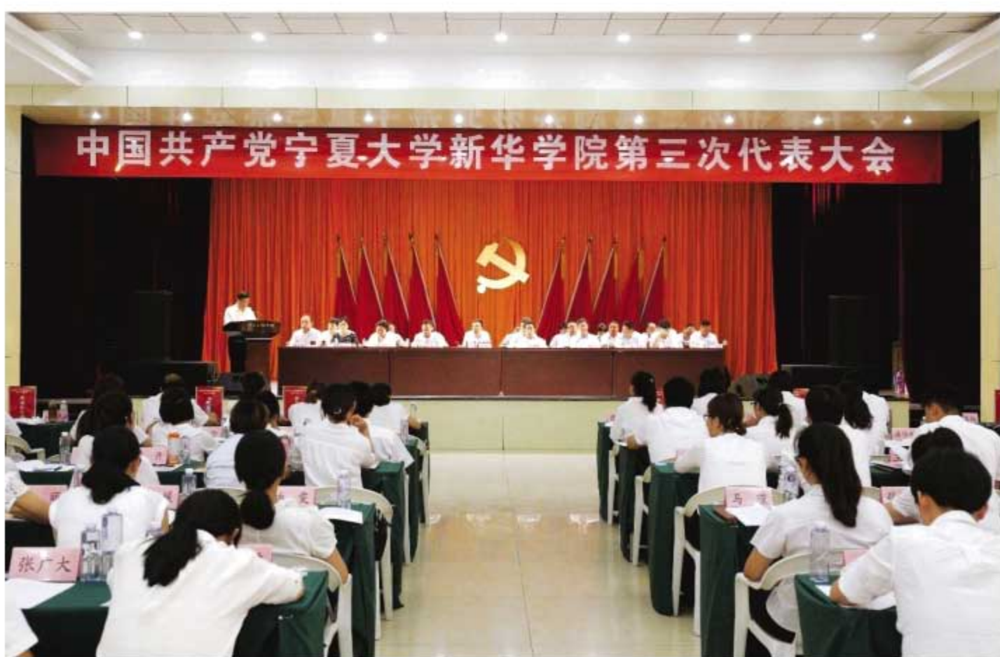
中国共产党宁夏大学新华学院第三次代表大会