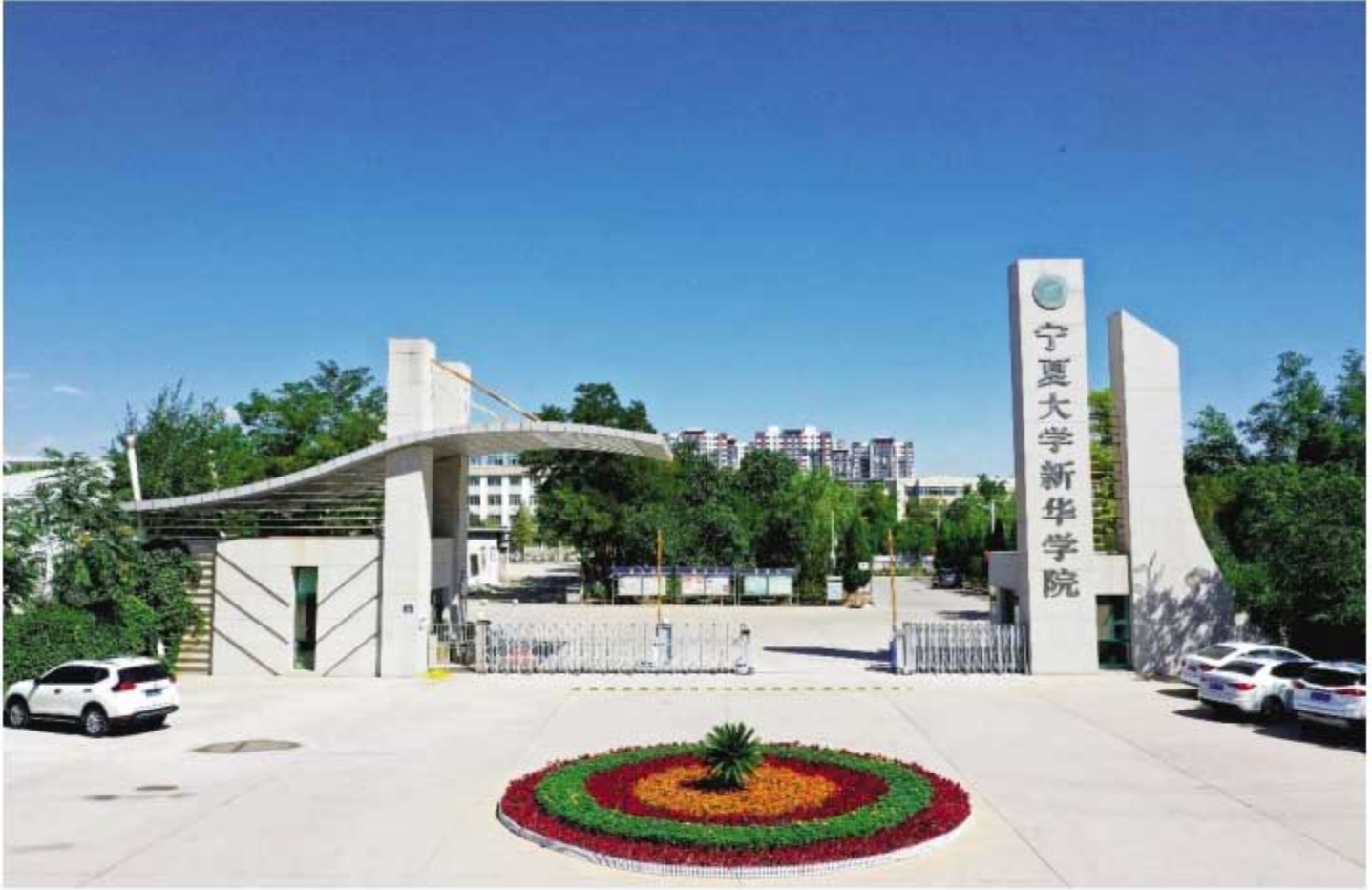
宁夏大学新华学院北区