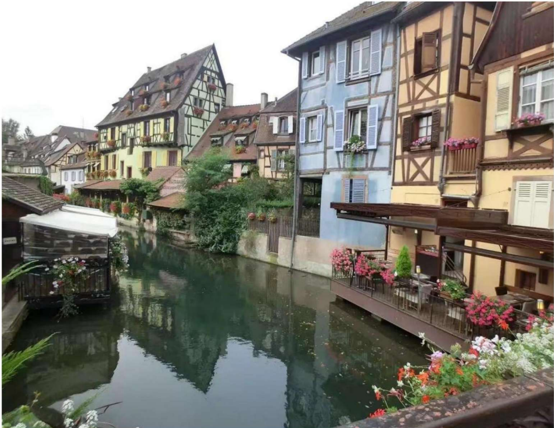
Une belle vue à Colmar