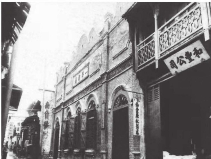
20 世纪初的九江 一等邮局

江西近代邮政业于 1894 年开始出现。由于外国资本涌入九江，邮电业在九江兴起。同年 6 月，九江商埠邮局发行第一枚邮票。在这之前，英国在九江领事馆设立邮局，随后日本也在九江开办邮政代办局。1896 年，江西邮务由九江海关税务司兼办，划为“九江邮界”，下设分局 21 个。1907 年，江西全省有电报局、所 14 个。因此，江西的邮电业在很长一段时间聚焦于九江。