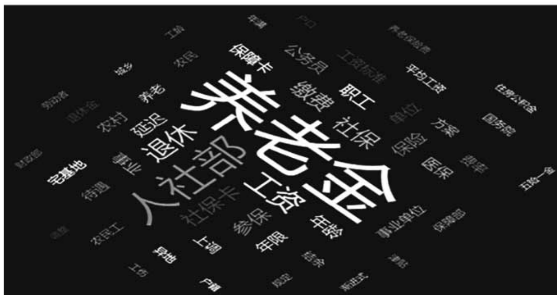
图 1-1 “社会保障”热点关键词词云图

资料来源：王堃、朱明刚《大数据看十八大以来成就：“社会保障”篇》，人民网—舆情频道，2017年9月30日。