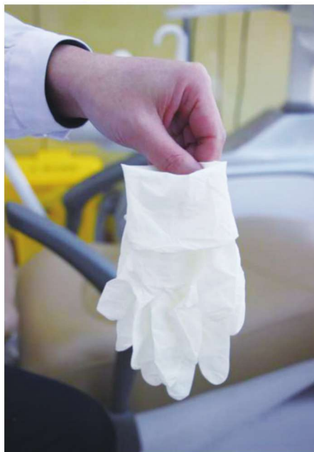
图 1-2-1 戴医用无菌手套之第一步