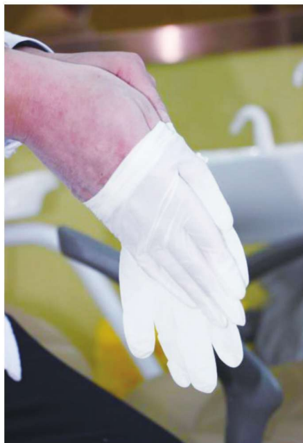
图 1-2-2 戴医用无菌手套之第二步