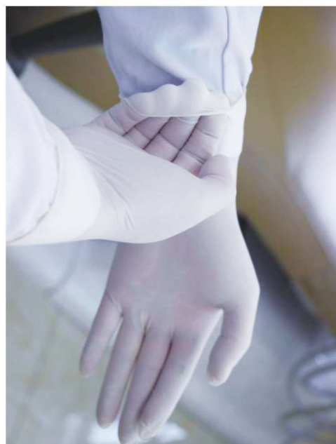
图 1-2-4 戴医用无菌手套之第四步