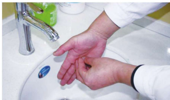
图 1-1-6 六步洗手法之第六步