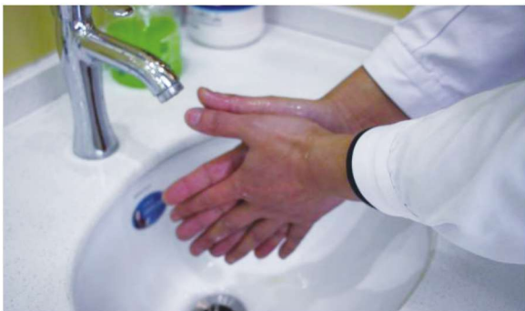
图 1-1-3 六步洗手法之第三步