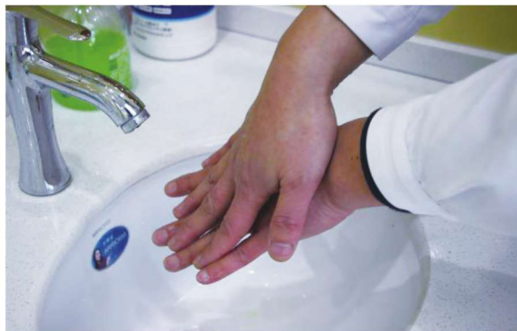
图 1-1-2 六步洗手法之第二步