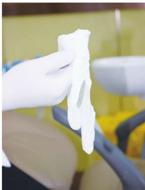
图 1-2-3 戴医用无菌手套之第三步