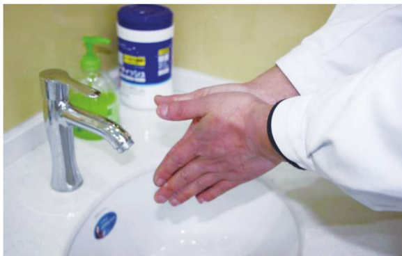
图 1-1-1 六步洗手法之第一步