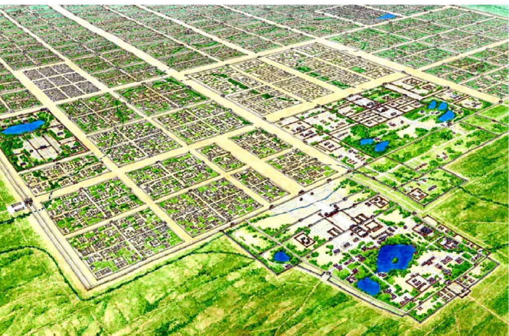
唐长安城复原示意