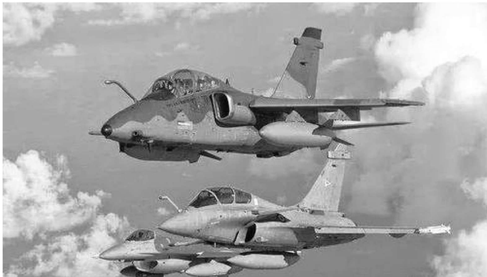
图 1.15 镁合金在航空领域的应用

发动机机滤座、进出水管、空气分配器座、机油泵壳体、水泵壳体、机油热交换器、机油滤清器壳体、气门室罩、呼吸器等车辆零部件，战术防空导弹的支座舱段与副翼蒙皮、壁板、加强框、舵板、隔框等弹箭零部件，歼击机、轰炸机、直升机、运输机、机载雷达、地空导弹、运载火箭、人造卫星等飞船飞行器构件。图 1.15 为镁合金在航空领域的应用。