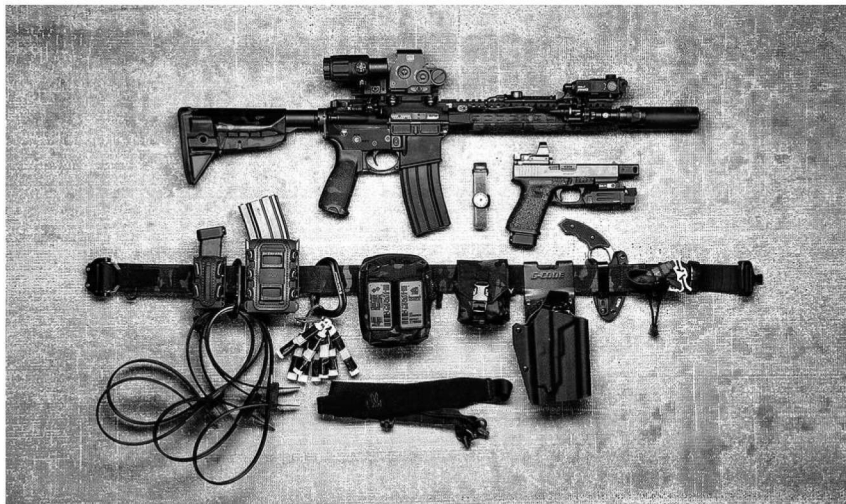
图 1.7 单兵武器