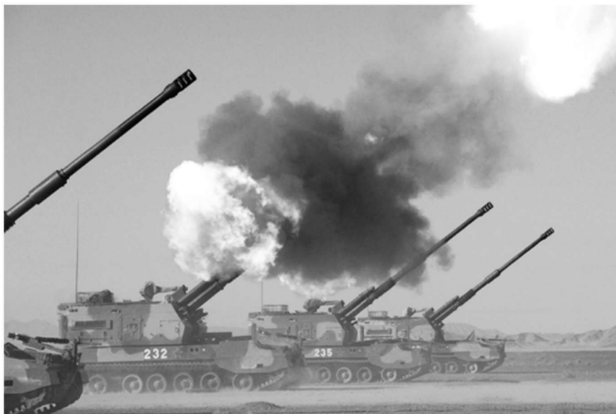
图 1.8 中国 PLZ-05 自行火炮

火炮，发明于中国，是指利用机械能、化学能(火药)、电磁能等能量抛射弹丸，射程超过单兵武器射程，由炮身和炮架两大部分组成，口径不小于 20 mm 的身管射击武器。图 1.8 为中国 PLZ-05 自行火炮。