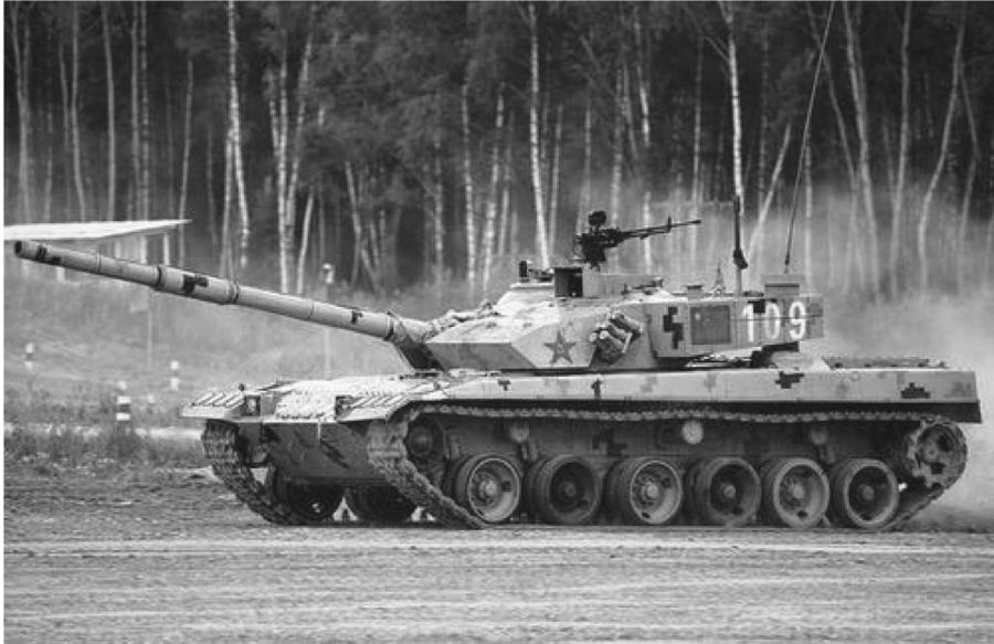
图 1.9 中国 96B 坦克

使用旋转式炮塔，但也有少数使用固定式主炮。坦克主要由武器系统、瞄准系统、动力系统、通信系统、装甲式车体等系统组成。图 1.9 为中国 96B 坦克。