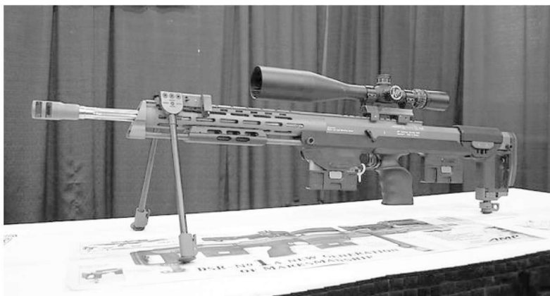
图 1.16 德国 DSR-1 狙击步枪

钛合金具有较高的抗拉强度(441~1 470 MPa)，较低的密度( 4.5 \text{ g/cm}^3 )，优良的抗腐蚀性能，在 300\sim 550\text{ }^\circ\text{C} 温度下有一定的高温持久强度和很好的低温冲击韧性，是一种理想的轻质结构材料。钛合金具有超塑性的功能特点，采用超塑成形-扩散连接技术，可以以很少的能量消耗和材料消耗将合金制成形状复杂和尺寸精密的制品。图 1.16 为德国 DSR-1 狙击步枪，在此枪的设计中使用了大量的钛合金。