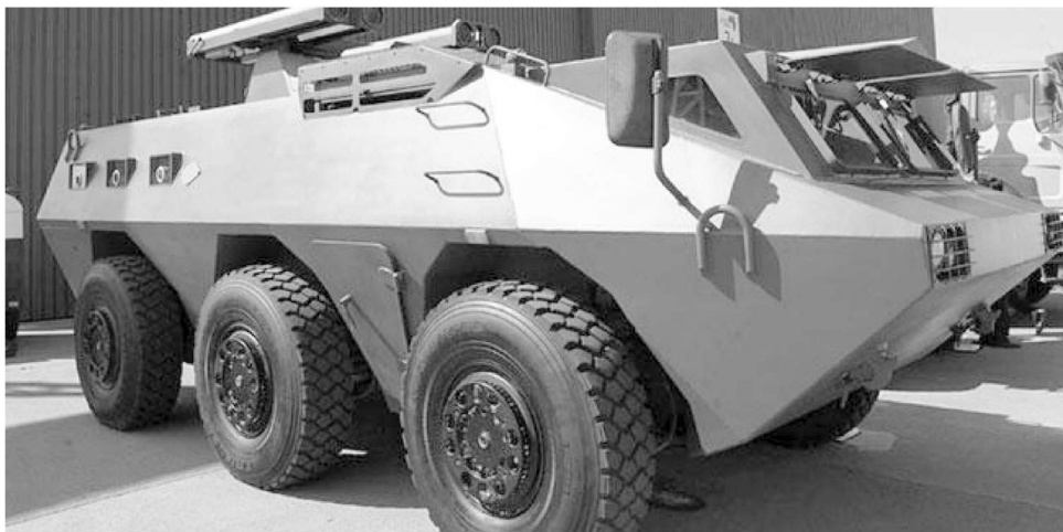
图 1.14 军用铝合金装甲板

铝合金一直是军事工业中应用最广泛的金属结构材料。铝合金具有密度低、强度高、加工性能好等特点，作为结构材料，因其加工性能优良，可制成各种截面的型材、管材、高筋板材等，以充分发挥材料的潜力，提高构件刚度和强度。所以，铝合金是武器轻量化首选的轻质结构材料。图 1.14 为军用铝合金装甲板。