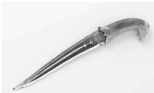
图 1.4 古印度的坎查剑

图 1.4 和图 1.5 分别为古印度的坎查剑和古埃及的各类刀剑，图 1.6 展示的是铁器时代的典型兵器。