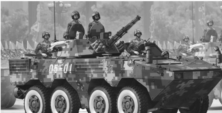
图 1.10 ZBL-09 装甲车

装甲车是具有装甲防护的各种履带或轮式军用车辆，是装有装甲的军用或警用车辆的统称。坦克也是履带式装甲车辆的一种，但是在习惯上通常因作战用途另外独立分类，而装甲车辆多半是指防护力与火力较坦克弱的车种。图 1.10 为 ZBL-09 装甲车。