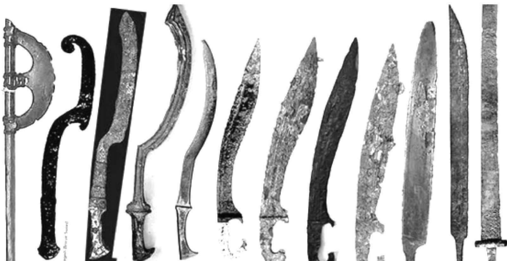
图 1.5 古埃及的各类刀剑