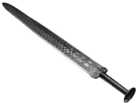
图 1.2 代表古代青铜技艺的越王勾践剑

国外早在公元前 3000 年就已制造出青铜，最早的青铜器出现于 6000 年前的古巴比伦两河流域。苏美尔文明时期雕有狮子形象的大型铜刀是早期青铜器的代表，《荷马史诗》中提到希腊火神赫斐斯塔司把铜、锡、银、金投入熔炉，炼成了英雄阿基里斯所持的盾。图 1.2 和图 1.3 分别是代表古代青铜技艺的越王勾践剑和公元 400 年的凯尔特匕首。