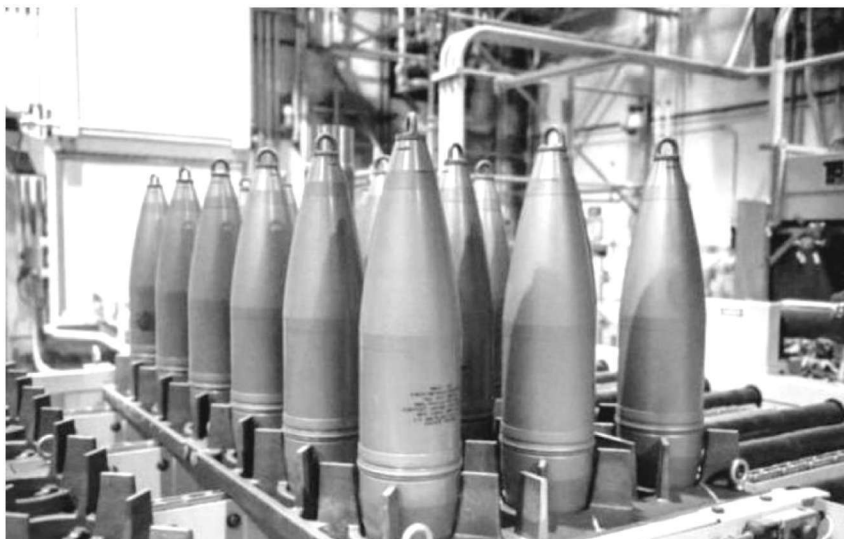
图 1.12 化学武器

化学武器(图 1.12)通过爆炸的方式(如炸弹、核武器、炮弹或导弹)释放有毒化学品(或称化学战剂),通过窒息、神经损伤、血中毒和起水疱等令人恐怖的反应杀伤人类。