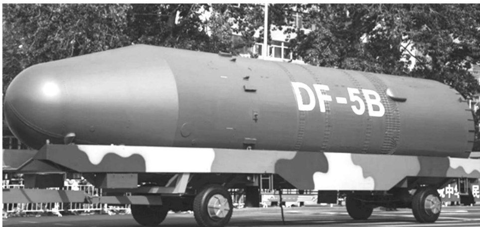
图 1.13 中国 DF-5B 核导弹

热兵器所用材料，按其用途可分为结构材料和功能材料两大类，主要应用于航空航天、兵器和舰船工业。