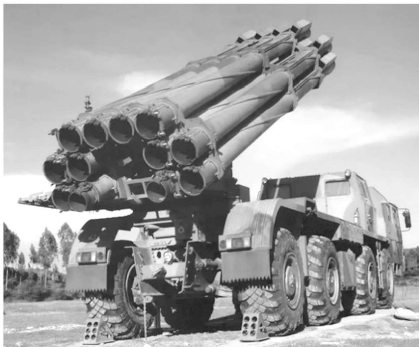
图 1.11 中国 273 mm 1983 式多管火箭炮