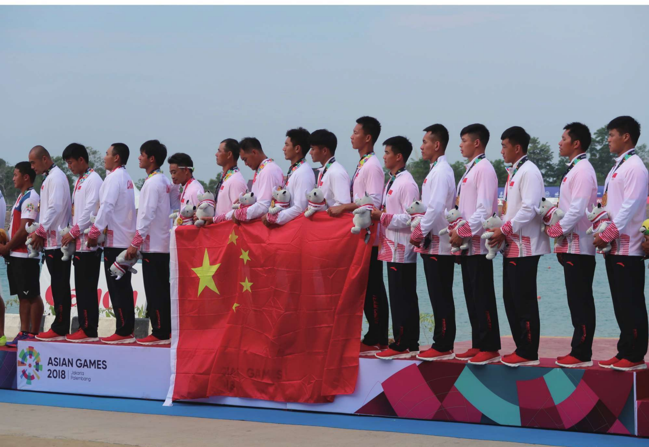
◎ 第十八届亚洲运动会龙舟赛颁奖：升国旗 奏唱国歌

近现代以来，龙舟竞渡逐渐融入娱乐、比赛、竞艳色彩，充满紧张、热烈、喜庆、祥和气氛，成为乡村热闹又欢快的大型活动。