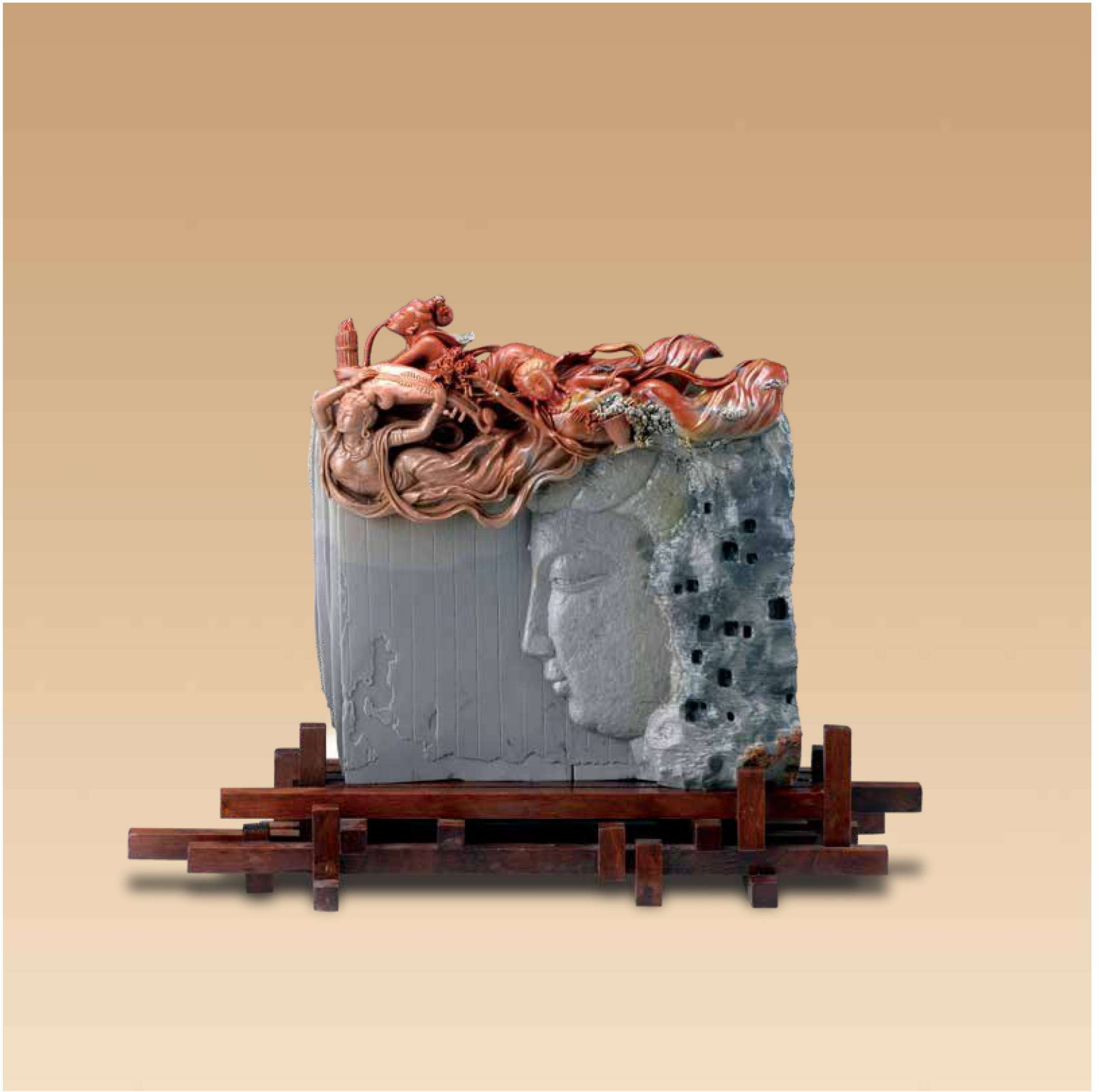
马铭生 《印象敦煌》 56cm×24cm×41cm 寿山石·山秀园石