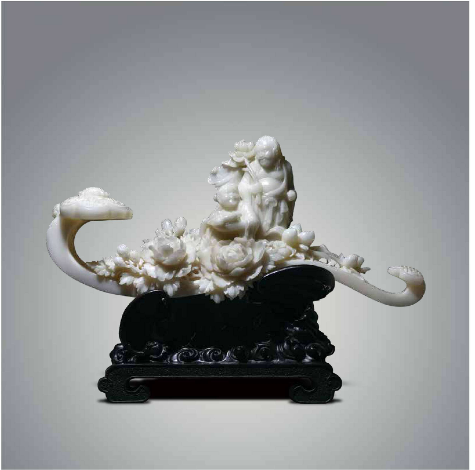
王少卿 《吉祥如意》 68cm×18cm×48cm 汉白玉