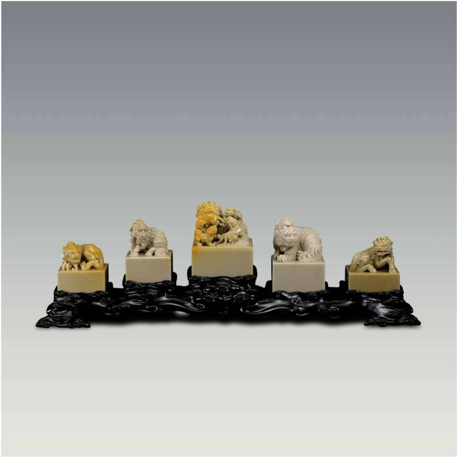
王国桐 《守护》 51.5cm×6.8cm×16cm 老挝石