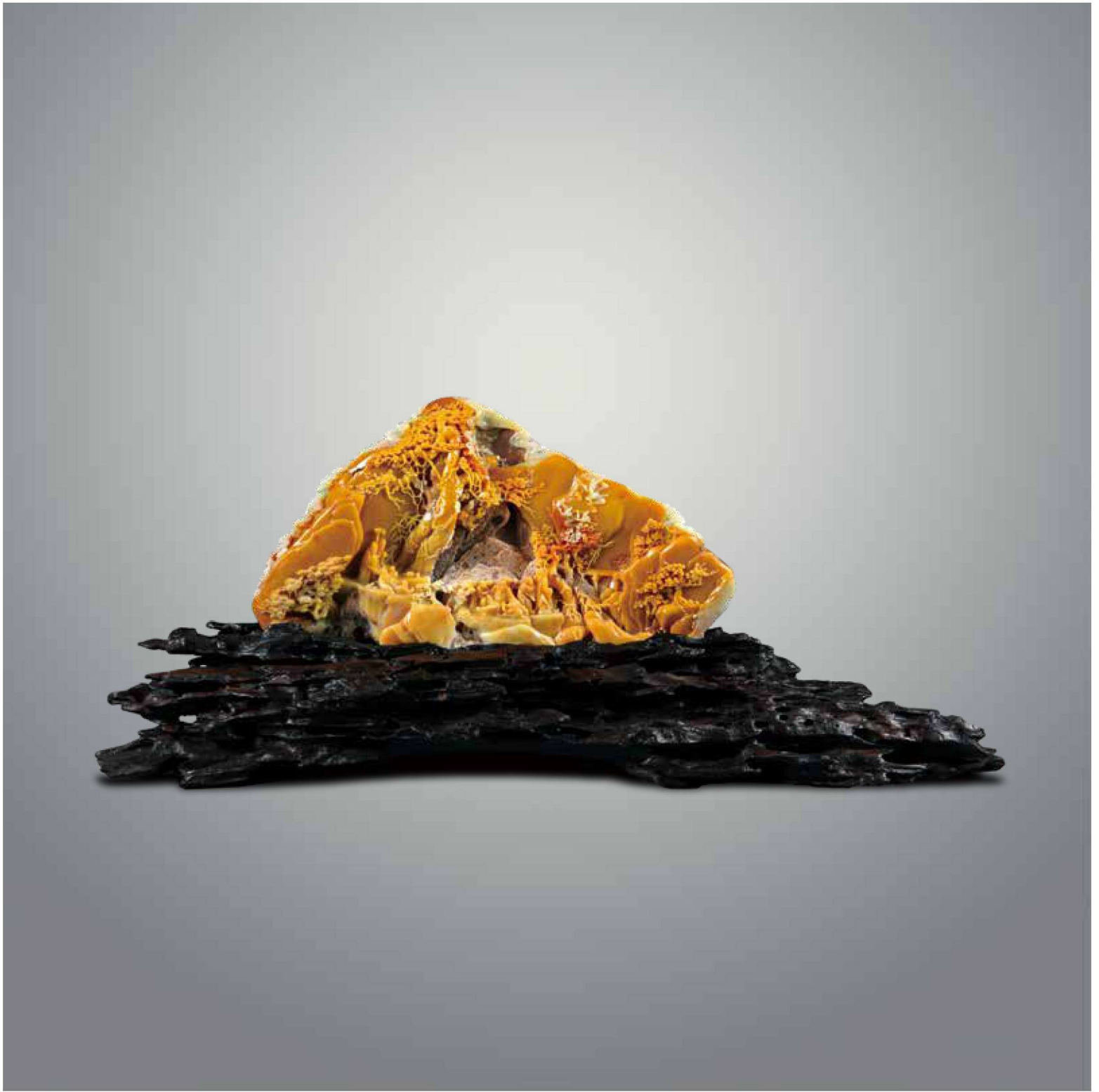
王光平 《松间春色迎客来》 57cm × 15cm × 25.8cm(含座) 寿山石·旗降石