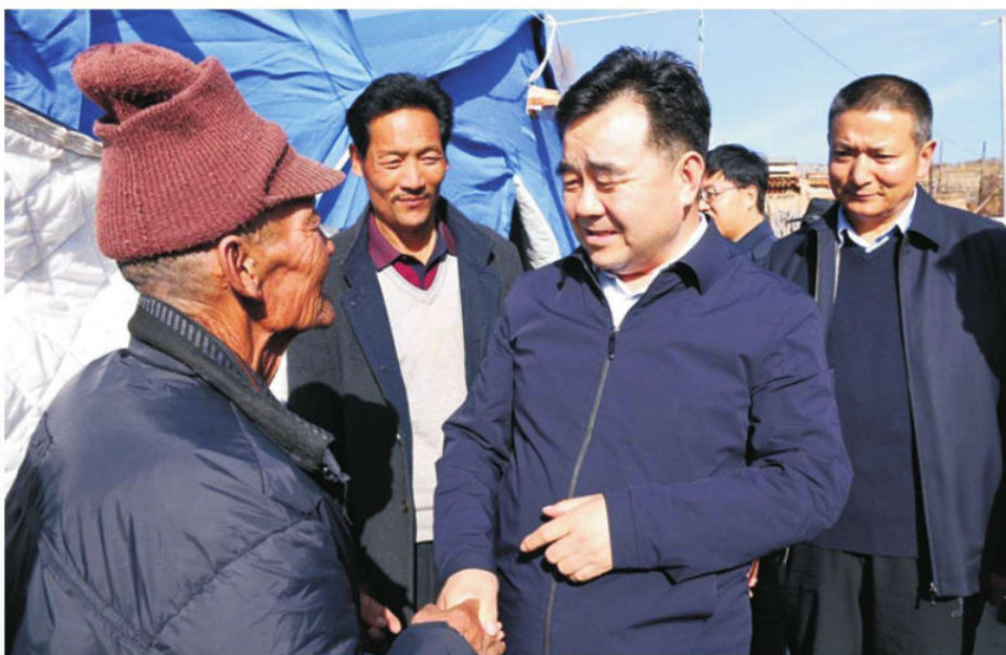
▲ 2019年11月8日，甘肃省应急管理厅党组书记、厅长黄泽元（右二）在夏河县检查指导受灾群众安置工作期间看望受灾群众