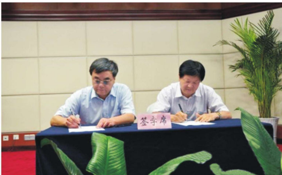
▲ 2011年7月8日，甘肃省安全生产监督管理局党组书记、局长王建中（左一）代表省安监局与重点煤炭企业签订安全生产目标责任书