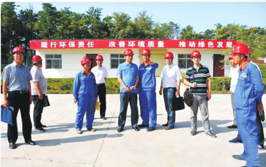
▲ 2016年8月，甘肃省安全生产第三督察组在兰州市部分商砼站检查安全生产工作