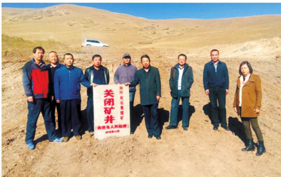
▲2016年10月，张掖市肃南县安监人员现场检查已关闭小煤矿