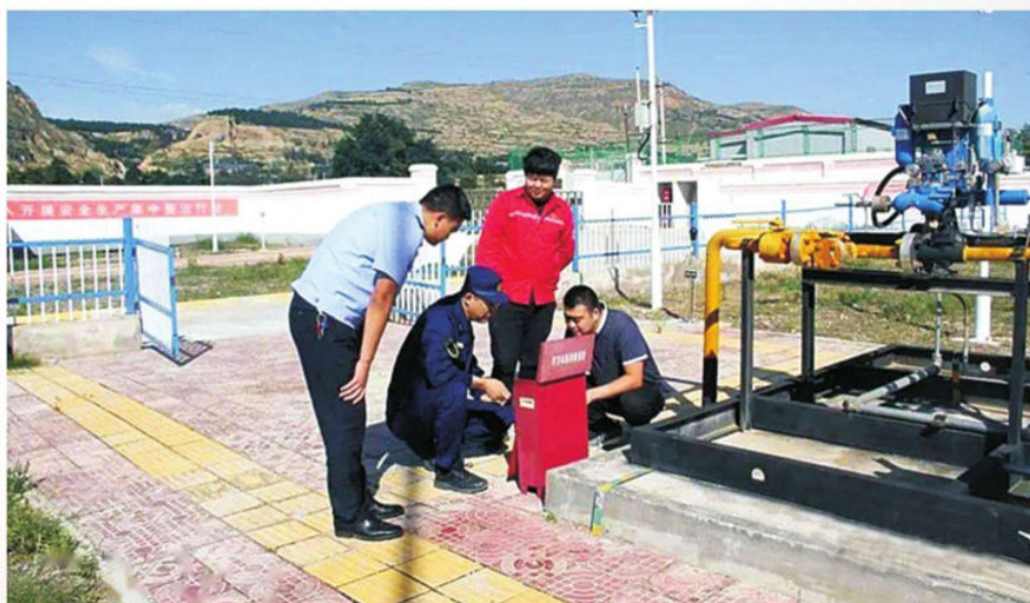
▲ 2015年4月，武山县安监、消防人员对全县化工企业开展安全检查