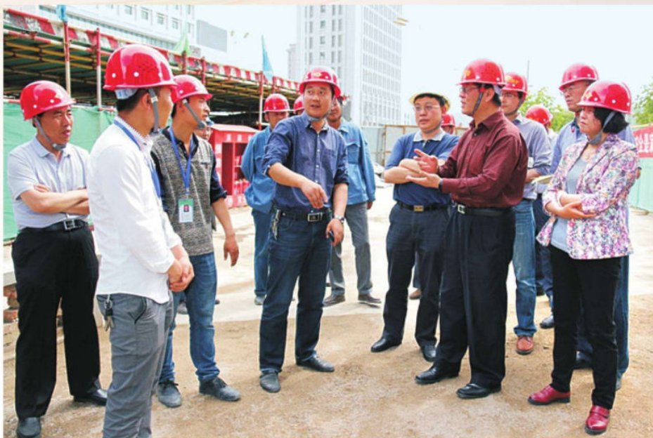
▲ 2016年5月，国家安全生产监督管理总局调研组在定西市调研预防和遏制重特大事故工作并检查建筑工地