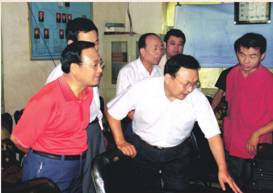
▲ 2007年6月，甘肃省煤炭安全生产监督管理局党组书记、局长刘天明（右二）在华亭煤业集团公司检查指导安全生产工作