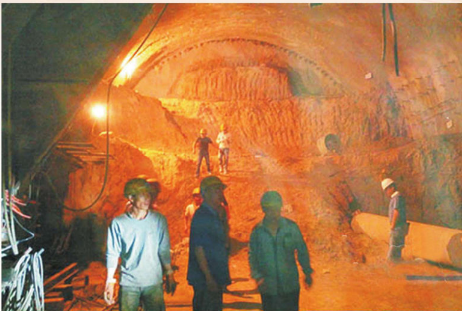
▲2015年6月12日，甘肃省安全生产监督管理局暗查暗访组检查宝兰客专甘肃段施工现场