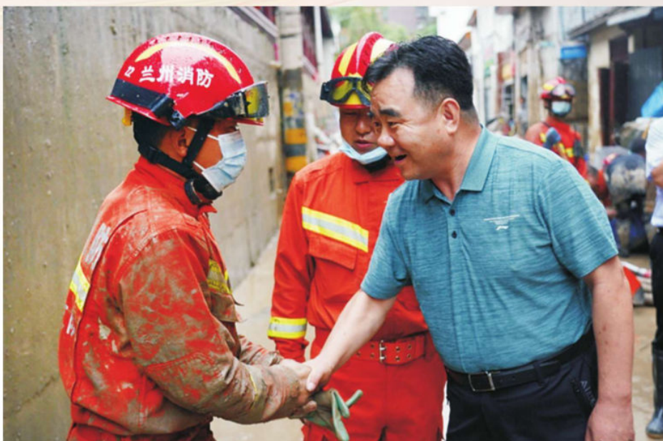
▲ 2020年8月，甘肃省应急管理厅党委书记、厅长黄泽元（右一）在文县指挥抢险救灾期间看望参加抢险救灾指战员