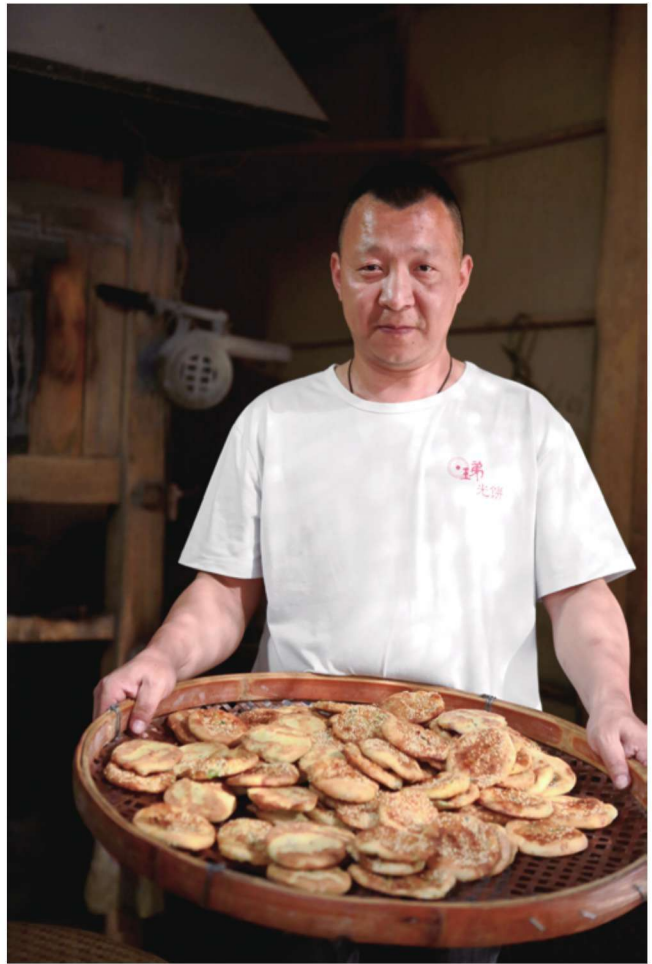
新鲜出炉的芝麻肉馅光饼