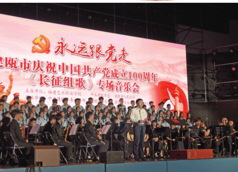
6月24日，建瓯市庆祝中国共产党成立100周年，举办“永远跟党走——《长征组歌》专场音乐会”。