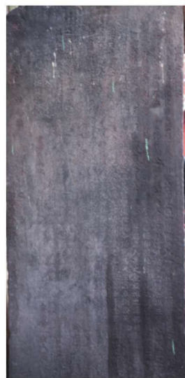
《重修全城祠记》古石碑(正面)