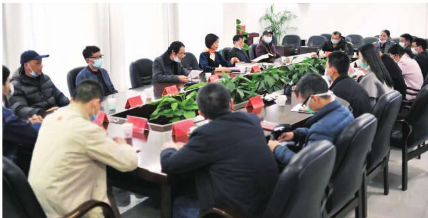
2月2日,《建瓯市志》首发式在市行政中心举行。