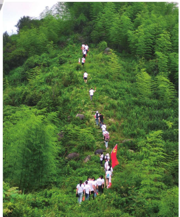
6月26日，龙村乡在擎天岩村开展“徒步革命老区，探寻红色记忆”登山活动。