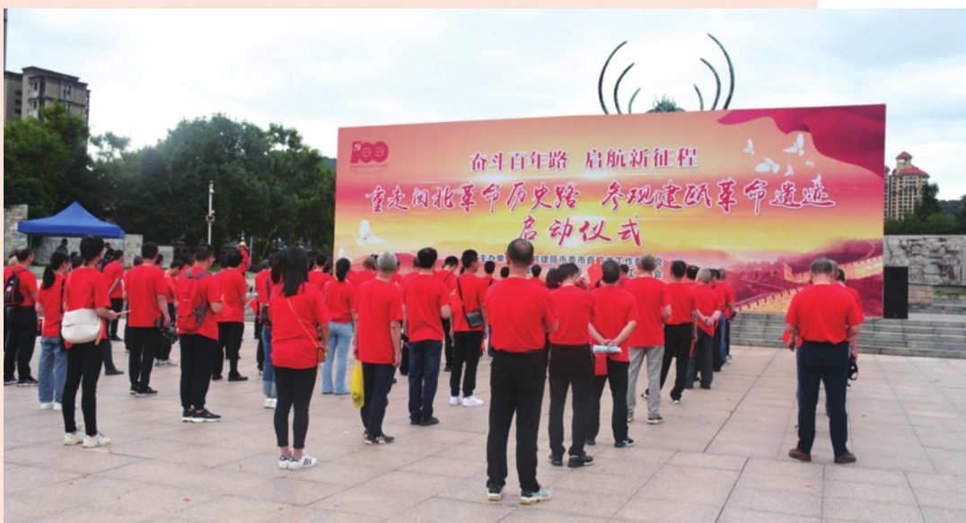
6月8日，市直机关党组织书记“重走闽北革命历史路，参观革命遗址”活动在闽源文化广场开幕。