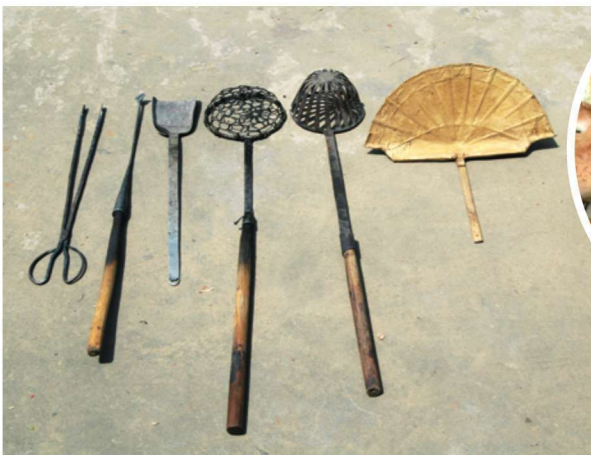
高炉光饼的传统制作工具