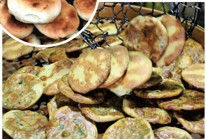
刚刚出炉的肉馅光饼，香脆可口。