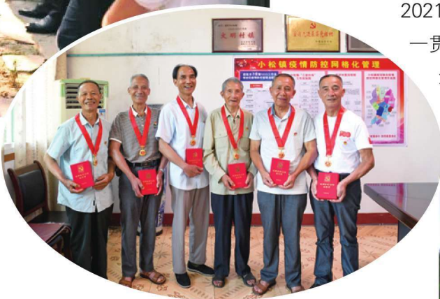
2021年，党中央首次向健在的、党龄达到50年、一贯表现良好的党员颁发“光荣在党50年”纪念章。6月28日，市政府办举办“光荣在党50年”纪念章颁发仪式。图为小松镇老党员喜获“光荣在党50年”纪念章。