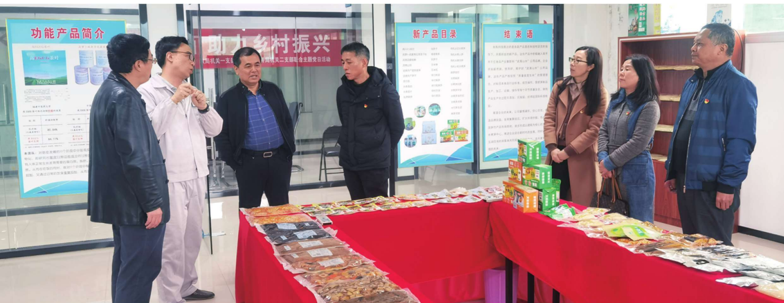
3月,建瓯市财政局、税务局联合开展税源调查活动。