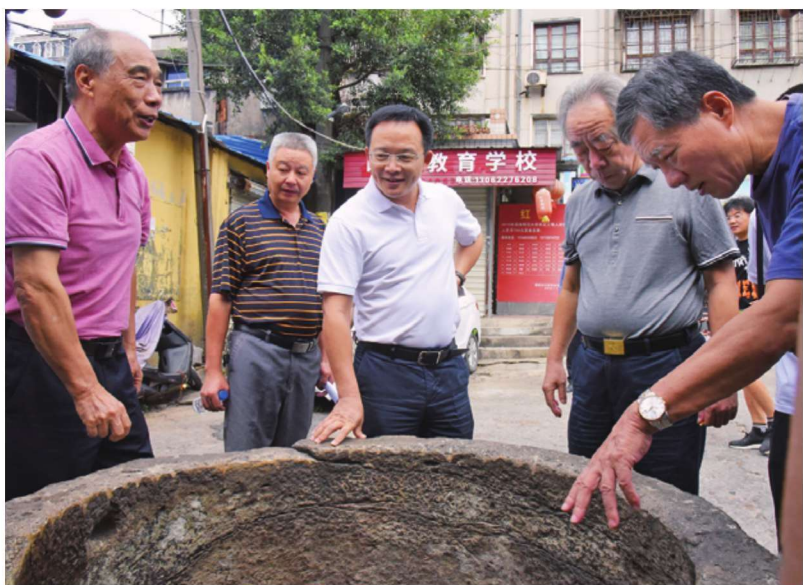
10月19日，朱子文化专家学者们在铁井栏、紫芝街历史文化街区、府学旧址、五经博士府、良泉井等地实地调研，了解建瓯朱子文化遗存保护和规划发展情况，为建瓯朱子文化弘扬传承建言献策。图为考察铁井栏尚书井。