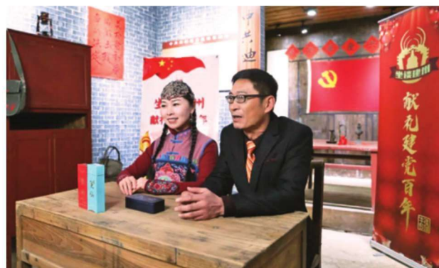
2月27日,牛年首场“坐谈建州”走进红色迪口。