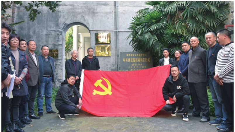
3月22日，市委宣传部组织宣传部党支部、市文体旅局支部、市融媒体中心党总支等到闽北临委开展党史学习教育。