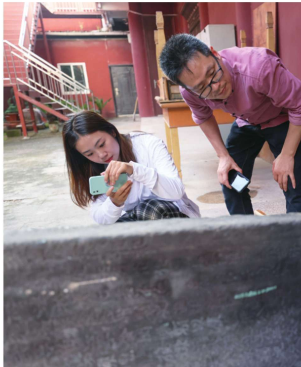
5月14日，在建瓯古代供奉“全城之母”练氏夫人的“全城祠”原址所在地，现芝山街道铁井栏22号房屋一处夹墙内发现清代乾隆年间所立的《重修全城祠记》古石碑。该文物已转移到了建瓯市博物馆收藏。