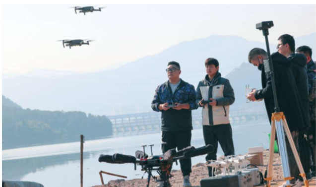
1月19日,建瓯市举行“无人机·AI+河道生态巡查”启动仪式,这既是建瓯市生态巡查技术手段的提升,更是建瓯市河长制工作智能化的一个标志。