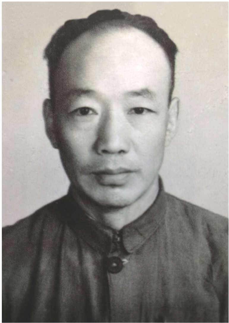
张永和像(20世纪40年代)