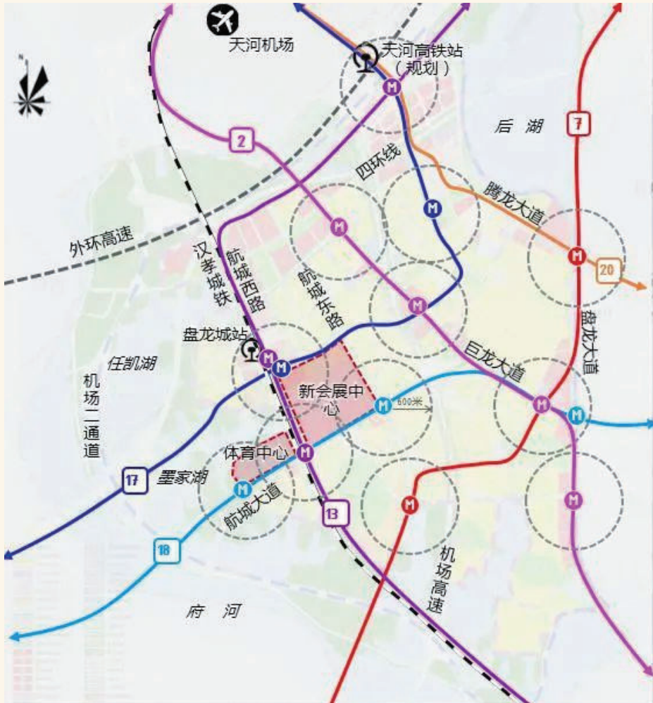
黄陂区构建“七纵十一横五射三环”交通网