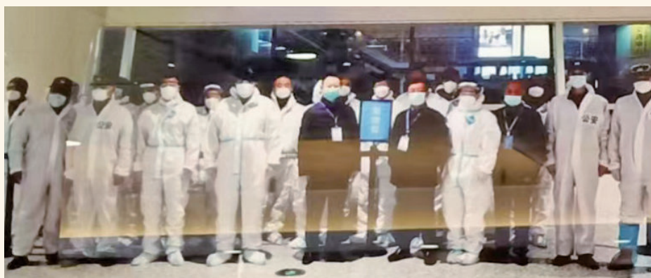
2020年12月7日，巴基斯坦—天河机场直航包机旅客转运