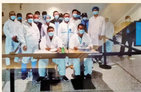
2020年10月12日，天河机场— 青岛抵汉航班防疫登记