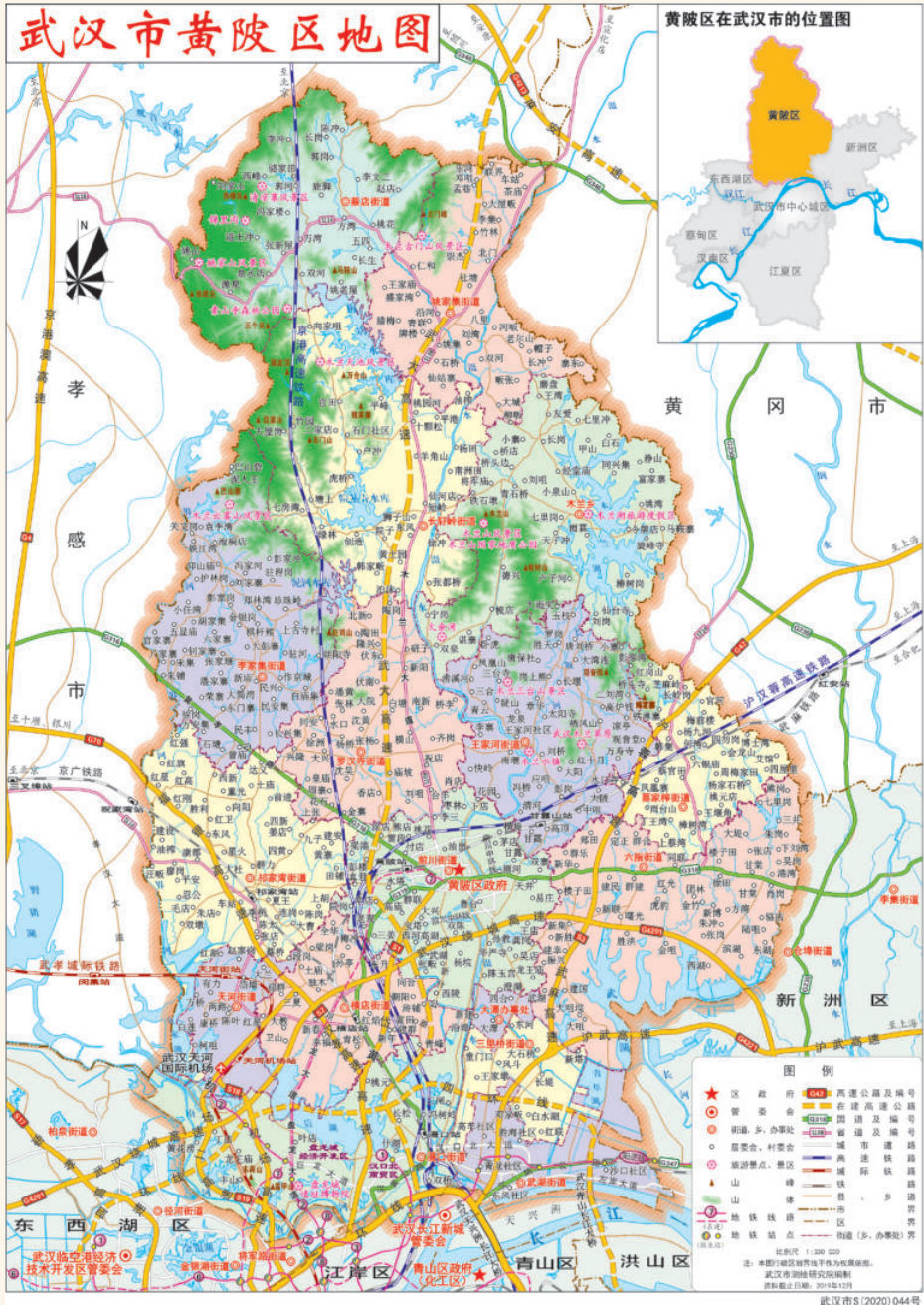
武汉市黄陂区地图