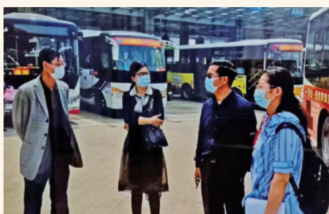
2020年4月8日，国家疾控中心、 省卫健委领导来客运中心检查开班前的 防控消毒工作