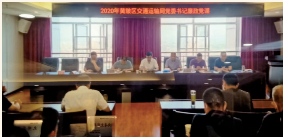
2022年9月4日，区交通运输局举办党委书记廉政党课活动