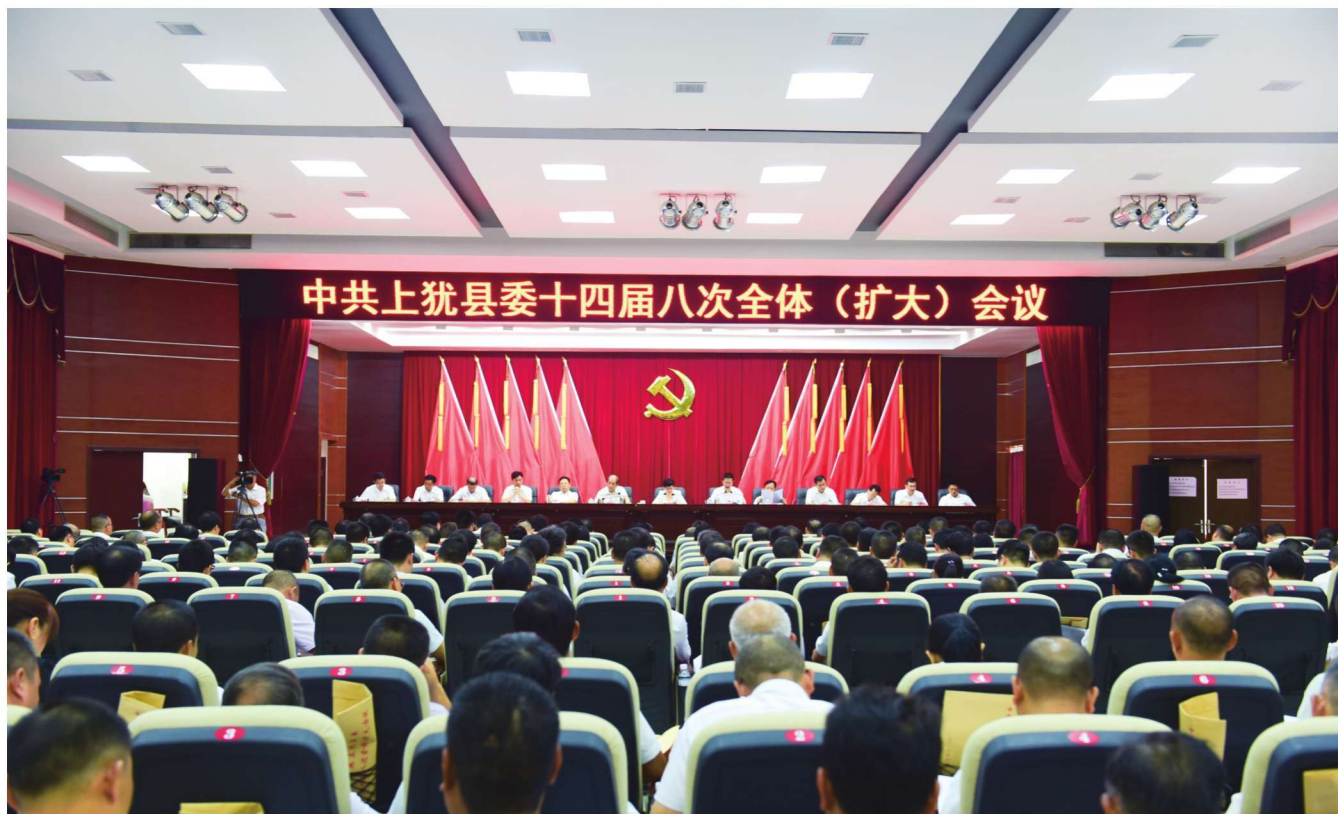
中共上犹县委十四届八次全体（扩大）会议召开