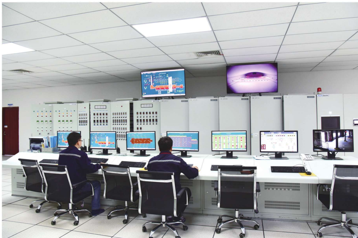
元源新材有限公司自动化控制中心