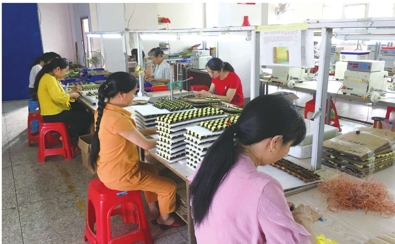
“扶贫车间”让更多贫困群众在家门口就业