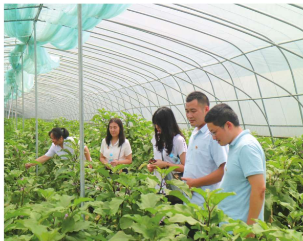
产业奖补政策帮扶贫困群众发展产业脱贫增收