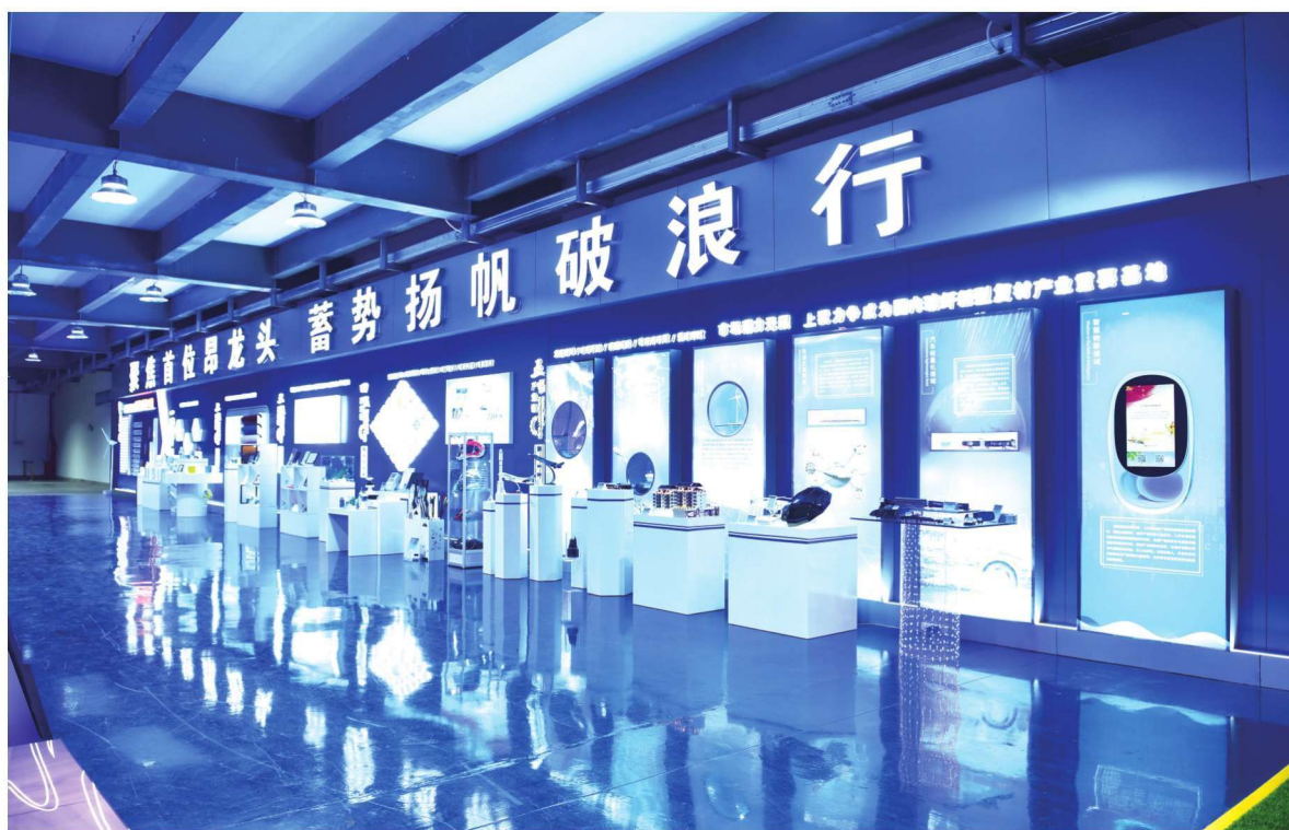
玻纤及新型复合材料应用展示