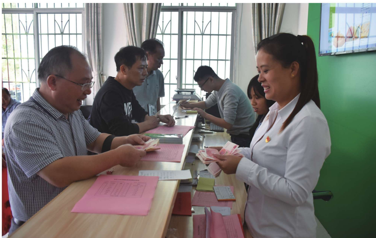
寺下镇富足村“富足之家”搭建电商和消费扶贫平台助推贫困群众脱贫致富