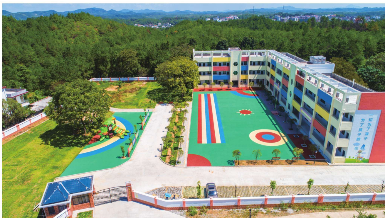
农村幼儿教育条件日臻完善。图为社溪镇中心幼儿园（公办）