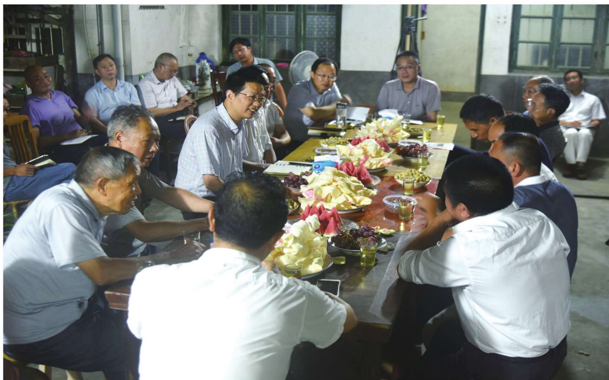
县委副书记、县长余业伟参加“乡间夜话”