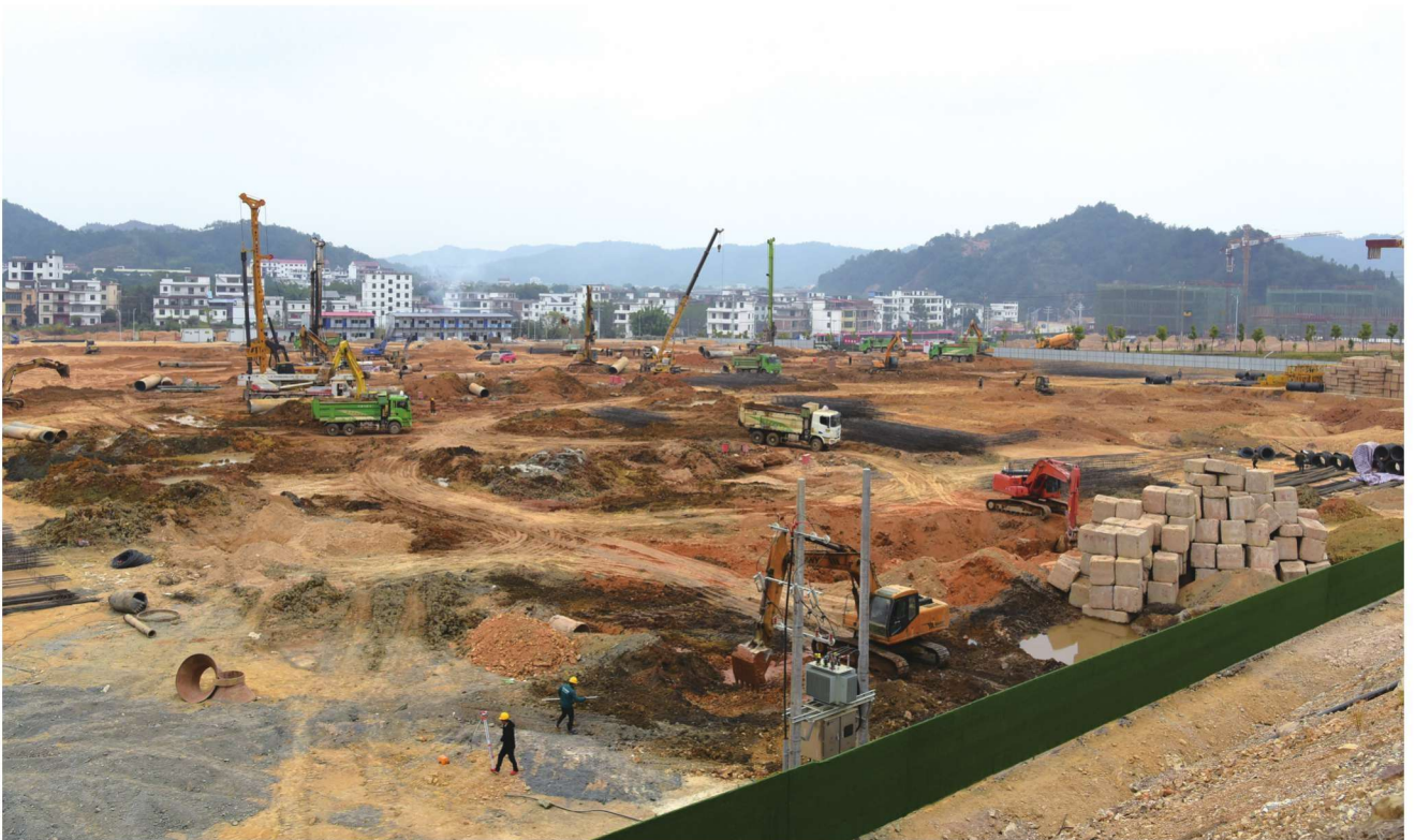
县工业园南区返乡产业园施工现场