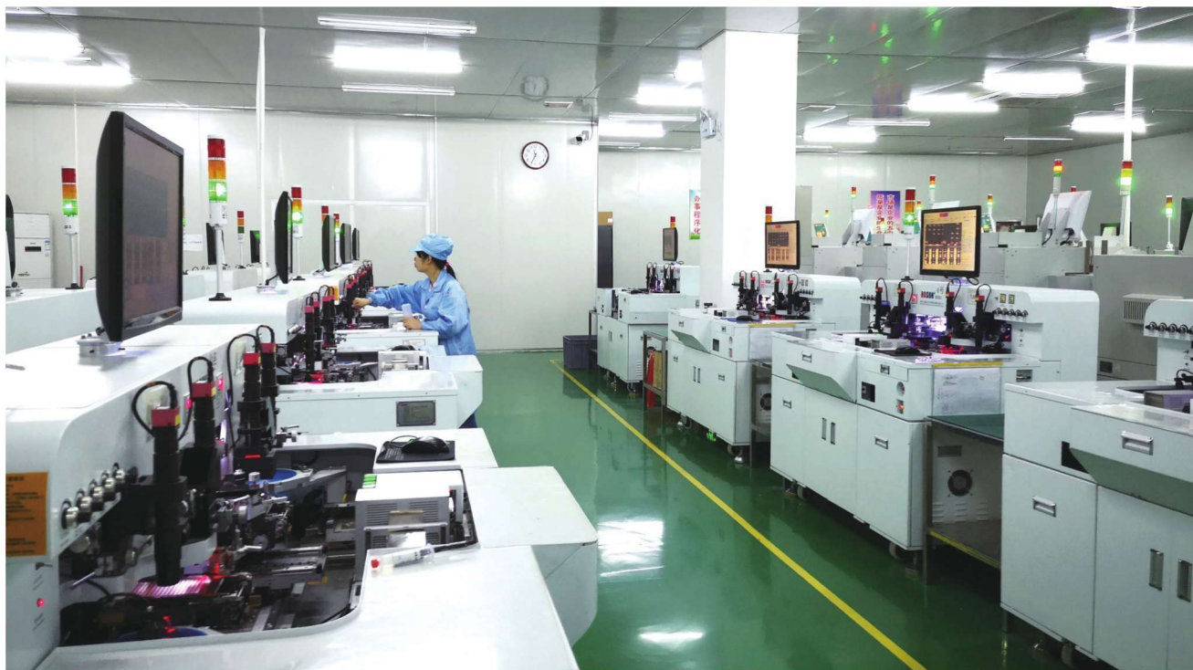
上犹县光电科技产业园生产车间一角