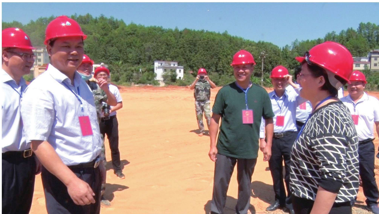
9月24日，市人大常委会组织部分市、县人大代表视察黄埠示范镇人居环境整治工作。