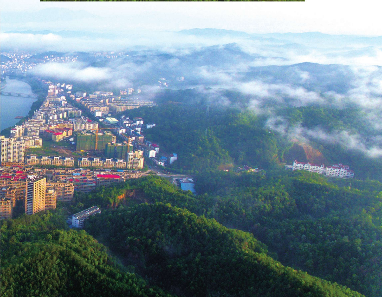
日新月异的上犹县城