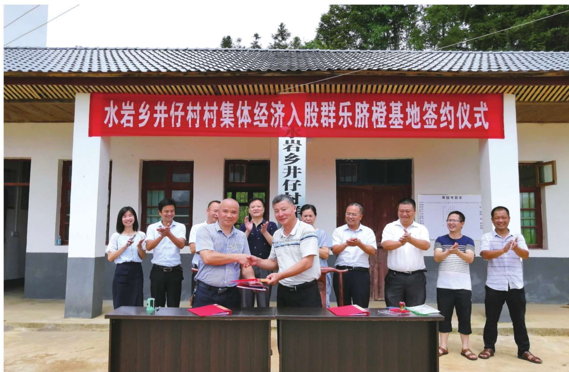
水岩乡井仔村村集体经济入股群乐脐橙基地签约仪式