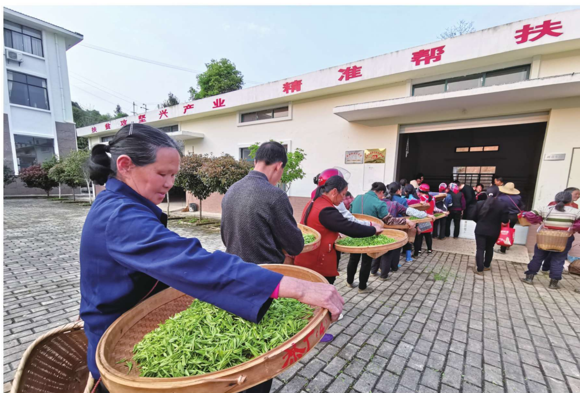
茶叶产业助力群众脱贫增收