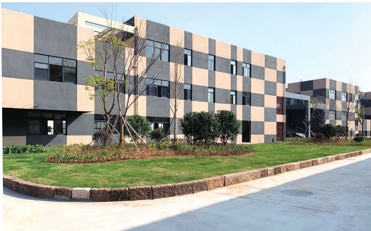
九谷光电企业一角