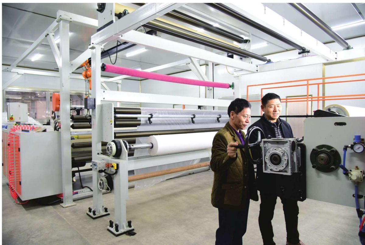
江西志广新材企业生产车间（上、下图）