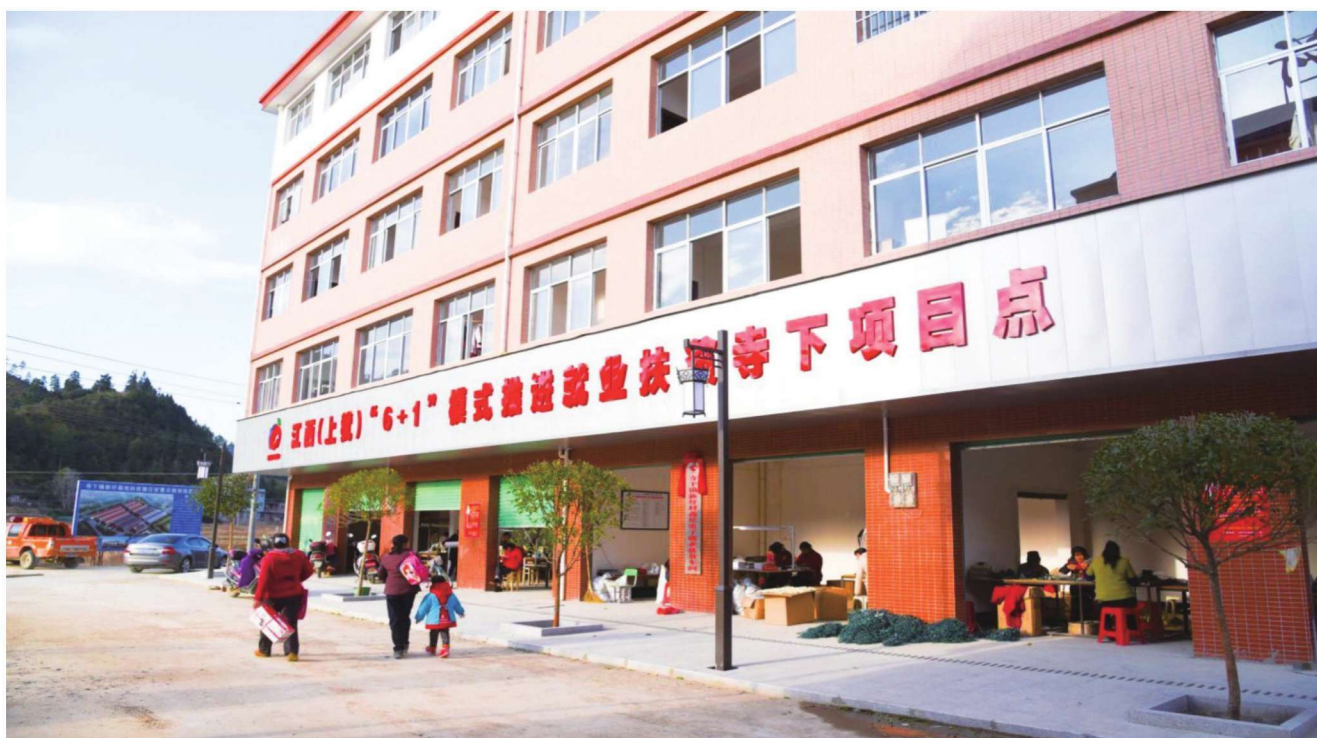
“扶贫车间”让更多贫困群众在家门口就业