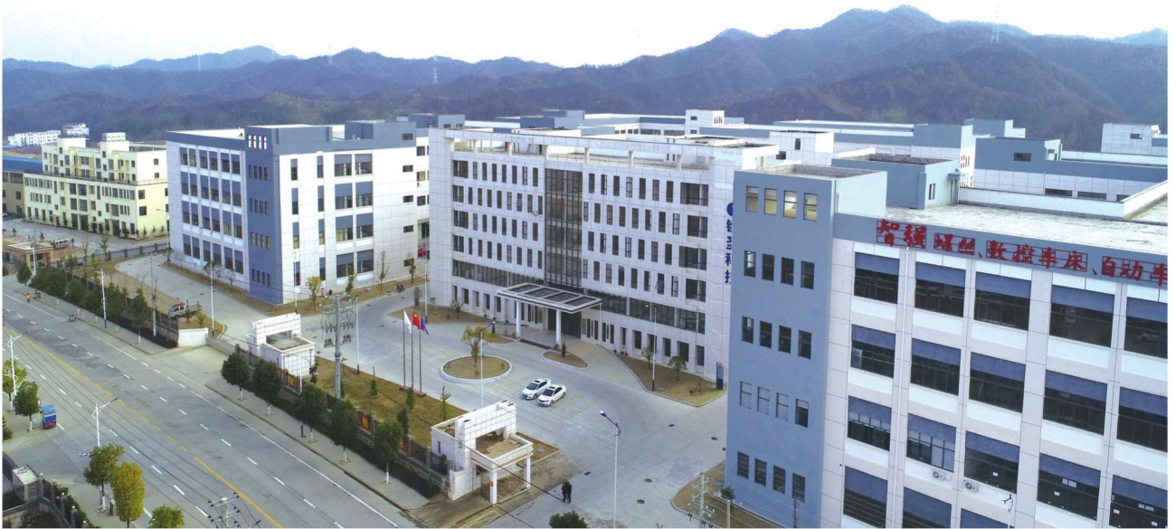
县工业园南区标准厂房