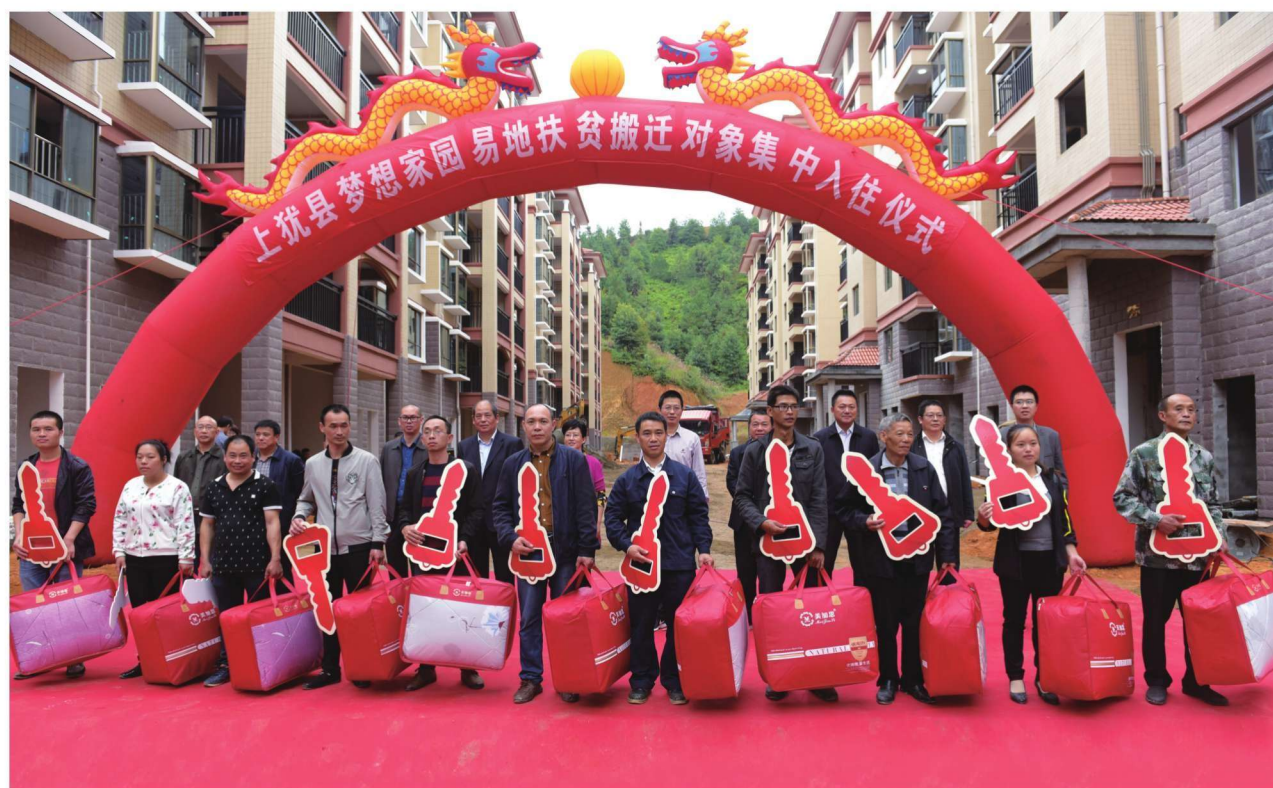
梦想家园易地扶贫搬迁群众喜迁新居