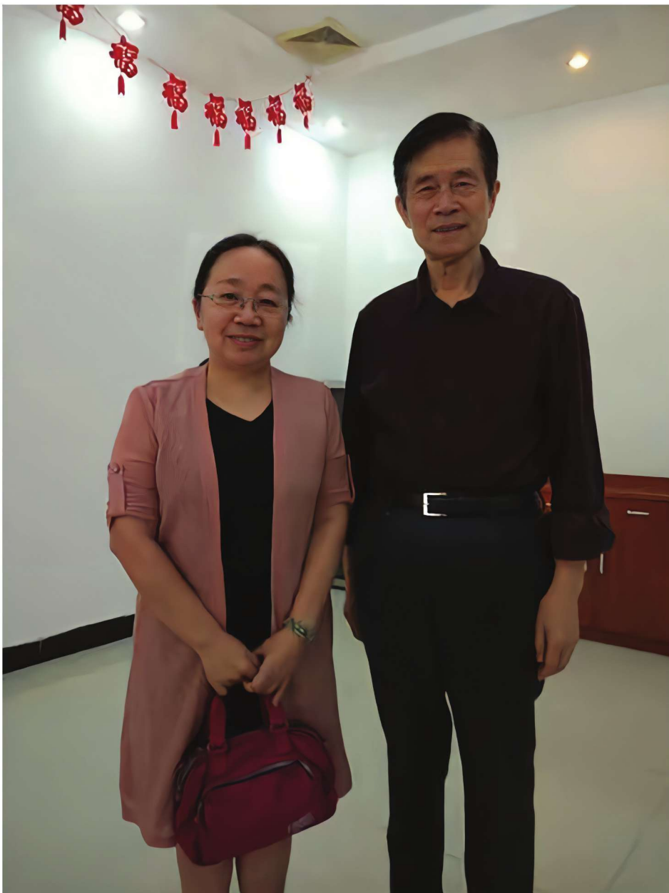
与恩师皮持衡教授合影