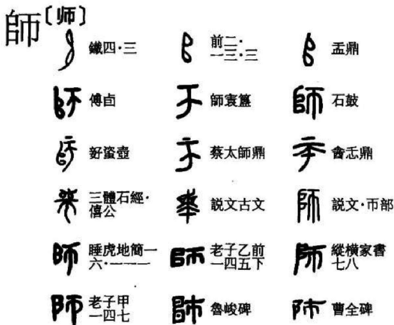
图 1-1 古代“师”的不同写法

旅，以作田役，以比追胥，以令贡赋。” ① 东汉班固(32—92年)《白虎通德论》卷四《三军》：“以为五人为伍，五伍为两，四两为卒，五卒为旅，五旅为师，师二千五百人。” ② 东汉许慎(约58—约147年)的《说文解字》释“师”曰：“二千五百人为师。从市从自。自四币众意也。”对此，清代段玉裁(1735—1815年)的《说文解字注》第六篇下曰：“《小司徒》曰：‘五人为伍，五伍为两，五两为卒 ③ ，五卒为旅，五旅为师。’师，众也。京师者，大众之称。众则必有主之者。《周礼·师氏》注曰：‘师，教人以道者之称也。’” ④ 另外，《周易》六十四卦中的第七卦为坎下坤上的“师卦”：“师：贞，丈人吉，无咎。”《彖》曰：“师，众也。贞，正也。能以