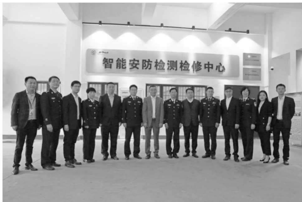
图 4 与浙江大华共建智能安防检测检修中心