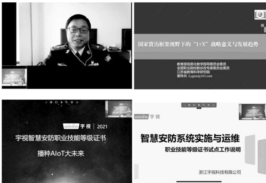
图3 与宇视科技共同发布 X 证书并发言