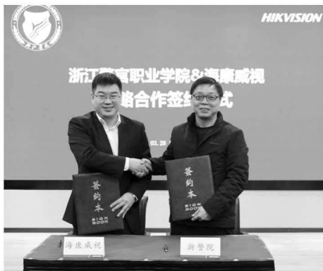
图2 与海康威视签订校企战略合作协议

安防专业服务于以杭州为代表的“万亿级数字安防产业集群”，培养适应现代安全服务业所需的高素质技术技能人才。基于产业和人才定位，实训基地的建设布局紧密围绕区域数字安防产业的转型升级，以及产业对高素质技术技能人才的需求，统筹规划，分段落实。产教融合实训基地充分发挥院校在政策解读、方案申报上的优势，向龙头企业宣贯产教融合政策，引导其向产教融合型企业发展，助力企业获批职业教育培训评价组织。2020年，学院成为教育部“建筑工程识图”“物联网智能家居系统集成和应用”等4项职业技能X证书试点单位；2021年，与企业合作开发“安全防范系统建设与运维”等3项X证书获批教育部第四批职业技能等级证书，并承担X证书的基地建设、教材编写、全国师资考证等合作项目。如图3所示。