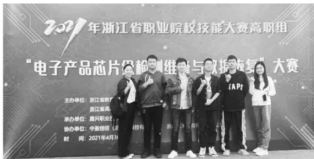
图 7 现代学徒制学员获省级竞赛二等奖（左数第三）

构建行业认知、课内实操、证书实训、学徒顶岗、竞赛实践“学练赛一体”实践体系。学院通过开展行业专家讲座、参观企业展厅等方式提高行业认知；以课内实操辅以综合实训练就基础技能；通过现代学徒制+企业订单强化专业技能；以大学生电子设计、产品检测维修等竞赛为载体提升综合能力；组织专业教师考取 X 证书讲师资质，参与 X 证书教材开发并将内容融入专业教学。获奖成果如图 7、图 8 所示。