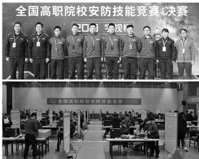
图 8 “宇视杯”全国高职院校安防技能竞赛