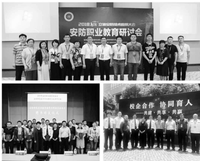
图10 系列全国性研讨会议