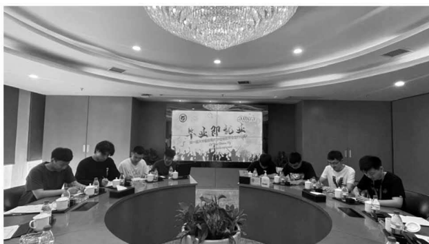
图 6 第一届大华股份现代学徒制班毕业签约仪式