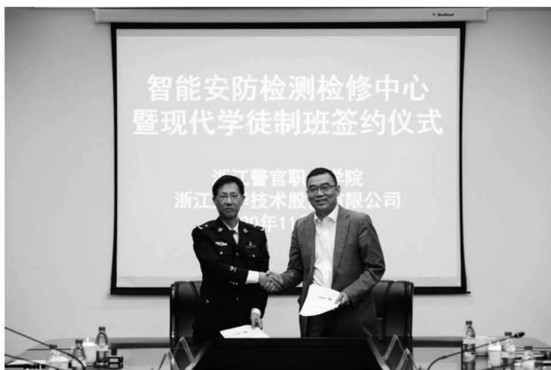
图 5 智能安防检测检修中心暨现代学徒制班签约仪式