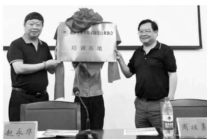
图9 培训基地揭牌仪式

安防专业与浙江省安全技术防范行业协会共建省内唯一“浙江省安全技术防范行业协会培训基地”（图9），并注重发挥该基地的社会服务与培训功能，保障行业从业人员的资信等级培训、继续教育培训、新兴技术及标准宣贯培训。2018年，校企双方共同发起成立“全国安防职业教育联盟”（以下简称“联盟”），集结19家全国安防类中高本院校，33家企业及10余家行业组织、政府部门、科研机构等，搭建行、校、企协同育人平台，共同探索人才贯通培养模式，共建共享产教融合改革成果。联盟相继召开了安全防范技术专业建设与发展研讨会、无人机安防应用与入侵反制研讨会、无人机实战演练、安防职业教育产教融合研讨会等系列全国性研讨会议（图10），举办数届全国安防职业技能大赛和全国X证书师资培训班，将基地建设经验在全国范围内交流分享，从而实训基地的育人成效进一步显现。