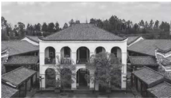
• 2-2 问津书院讲堂

《论语》中有一段“子路问津”的故事，说孔子领弟子们周游列国，行于楚国时，被一条大河拦住去路。附近的农田中有两个老者正在耕地，孔子让子路向他们打听渡口。这二人实为隐居的高士长沮和桀溺，他们嘲笑“生而知之”的孔子竟不知路在何方。他们没有告诉子路该往哪里走，反而劝说子路，这天下就如滔滔江河水，无人可易之，与其费尽心力说服统治者，不如洁身自好，