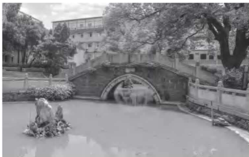
• 3-2 放生池与圣僧桥