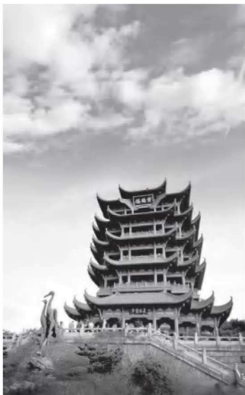
• 1-1 黄鹤楼正面

黄鹤楼始建于三国时期东吴黄武二年（223），是孙权依山而建的一座军事哨所。至唐朝，黄鹤楼逐步演变为名胜景点，成为文人墨客争相吟诵的文化名楼。古黄鹤楼为木制结构，在漫长的历史变迁中，屡毁屡建，屡建屡毁，在明朝就重建了4次，在清朝重修了6次，最后于清朝光绪十年（1884）毁于一场大火。各个朝代的黄鹤楼有着不同的布局和风格。关于古代黄鹤楼的形象可见之于宋画中的黄鹤楼，元朝永乐宫壁画中的黄鹤楼，明朝安正文画的黄鹤楼，以及清朝同治七年（1868）重建的黄鹤楼的照片中。从这些历史资料来看，古黄鹤楼建筑风格的共同之处在于其色调均为黄瓦红柱、富丽堂皇，外形巍峨厚重、挺拔雄伟，重重飞檐拔地而起，如黄鹤般展翅欲翔。不同之处在于，唐代的楼雄浑，宋、元的楼精致，明代的楼隽秀，清代的楼奇特。1957年修建武汉长江大桥时，黄鹤楼旧址被占用。现今的黄鹤楼为1981年在距旧址1公里左右的蛇山东岭上重建的仿古建筑。其主楼以清朝同治年间的黄鹤楼