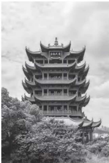
• 1-2 黄鹤楼背面