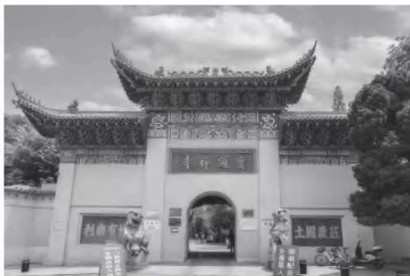
• 3-1 宝通寺山门

宝通寺坐北朝南，依山而建，居高临下，气势不凡。寺院的建筑群沿洪山而上，随山势起伏，层叠有致。中轴线上主要的建筑自下而上为山门、放生池、