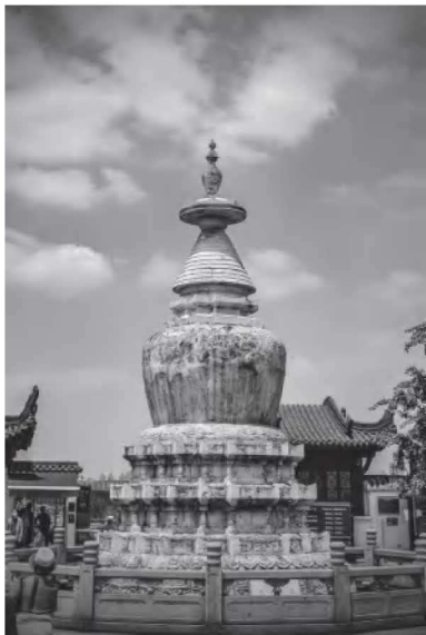
• 1-4 胜象宝塔

胜象宝塔塔高 9.36 米，底座宽 5.48 米，采用外部石砌、内部砖砌的方式建造。塔座为圆形须弥座，外围雕刻有云神、水兽、莲花、金刚杵等花纹和梵文。从下至上塔身内收外展，十三天相轮逐层收缩，尺度越来越小，整体轮廓呈三角形，端庄稳重。整个塔分为须弥座、塔身、相轮、伞盖和宝顶五个部分。这五个部分的形状分别是方形、圆形、三角形、半月形和宝珠形，象征着地、水、火、风、空五轮，故胜象宝塔也被称为五轮塔。另外，由于胜象宝塔外形似灯笼，且有诸葛亮在此燃孔明灯为水军导航的传说，民间也有将其称为“孔明灯”的说法。