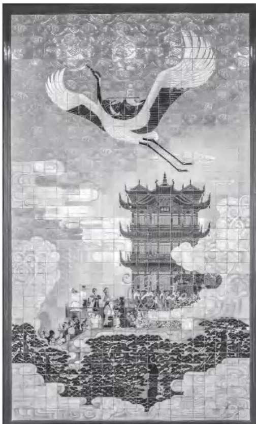
· 1-3 黄鹤楼传说瓷砖拼画（黄鹤楼一楼展厅）

为蓝本，是钢筋混凝土仿木结构。楼高 51.4 米，共五层，外形方正，每边长 35 米，四望如一。重建的黄鹤楼博采历代黄鹤楼之长，汇北雄南秀之风。72 根大柱拔地而起，金色琉璃瓦面古朴富丽。五层飞檐中每一层飞檐都有 12 个翘角凌空，下挂风铃。楼顶为攒尖顶，红葫芦形状的宝顶在夜间闪闪发光。楼内各层陈列着古今名家书画作品，充满诗情画意。在主楼外有南楼、黄鹤铜雕、胜象宝塔、牌坊轩廊、亭阁小径、百年老树，整体古朴雅致，对主楼起到了很好的映衬作用。