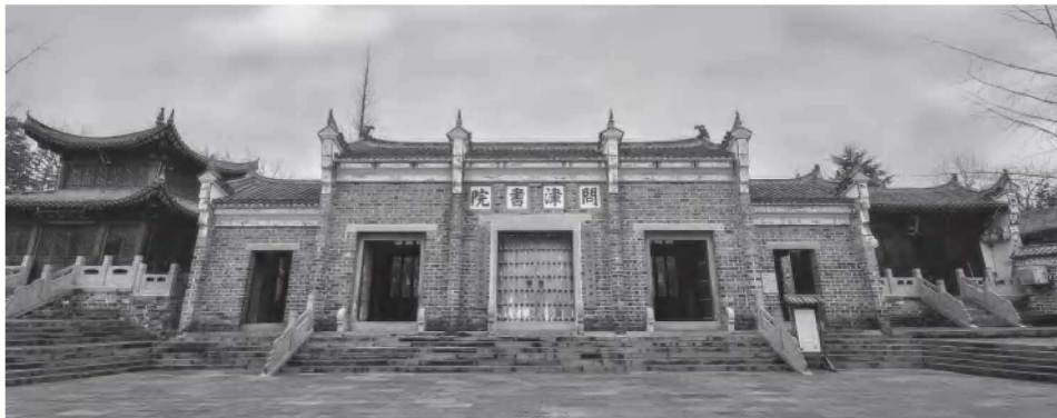
• 2-1 问津书院仪门

问津书院位于武汉市新洲区孔子山南麓，得名于《论语》“子路问津”的典故。据《问津书院志》记载，书院前身为孔庙，始建于西汉年间，为淮南王刘安为纪念孔子使子路问津于长沮、桀溺之事所建。自汉代到南宋末年，孔庙多次得到官府修缮和扩建。东晋成帝咸康二年（336）豫州刺史毛宝、唐武宗会昌二年（842）黄州刺史杜牧和南宋黄州太守孟珙等在拜谒孔庙之后都相继对其进行过扩建。南宋末年，江西名儒龙仁夫效仿长沮、桀溺，归隐于孔子山，修建学舍，立院讲学，时称“龙仁夫书院”，首开书院讲学之风。元末明初，书院一度毁于战火，后在地方官吏、乡绅和名儒的努力下，多次复修。在明代的两次大规模复建中，孔庙与书院合并，湖广巡抚熊尚文以子路问津之寓意，题匾额命名新书院为“问津书院”。至明万历年间，问津书院的讲学活动达到极盛，众多鸿儒授业于此，四方学子云集问道，儒士们分宗别派，众家争鸣。明崇祯末年，书院毁于兵燹。后又数次修复。至清代，书院逐渐成为官方科考取士之所，由此得到官方的保护和修复，并获得康熙帝御书的“万世师表”和嘉庆帝御书的“圣集大成”的匾额。同治、光绪年间，书院又多次复建并扩