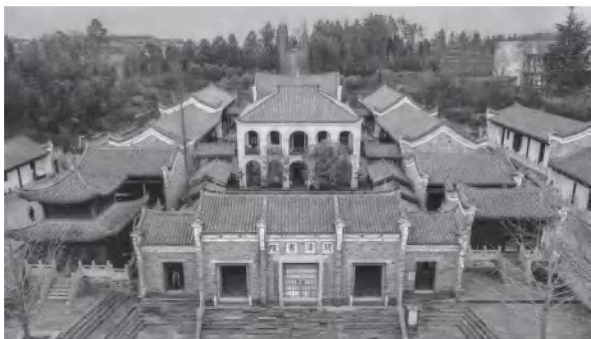
• 2-3 问津书院俯瞰