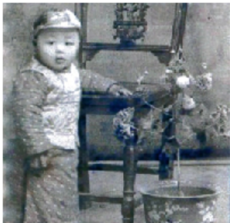
欧阳自远一周岁生日照

1935年10月9日，从江西省吉安市一户姓欧阳的人家里，传出一声嘹亮的啼哭声。整整两天两夜，这家的产妇终于生出了一个男婴。男婴出生时，全身发紫。助产士把孩子倒提起来，使劲儿一拍屁股，才有了那声惊天的哭声。